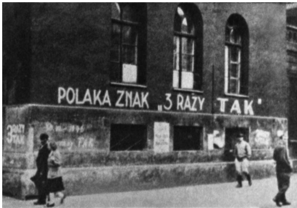
Komunistyczna propaganda przed referendum

Największa partia opozycyjna – Polskie Stronnictwo Ludowe – znalazła się w trudnym położeniu. Program PSL nakazy-