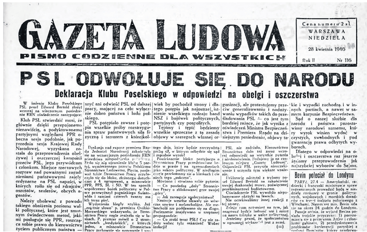
Pierwsza strona „Gazety Ludowej”, dziennika wydawanego przez PSL