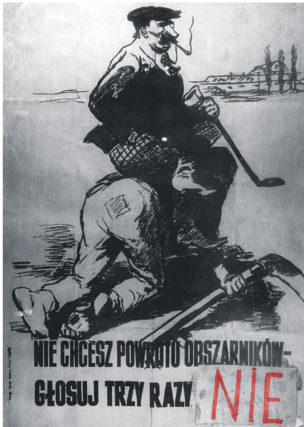
Propagandowy plakat referendalny, na którym słowo „TAK” zostało przykryte słowem „NIE”

Drugim wicepremierem był Stanisław Mikołajczyk, lider Polskiego Stronnictwa Ludowego, były premier Rządu RP na Uchodźstwie. Gdy na konferencji jałtańskiej zapisywano, że TRJN powstanie na bazie komunistycznego Rządu Tymczasowego z dołączeniem demokratycznych polityków z kraju i z zagranicy, to myślano właśnie o ludowcach i Mikołajczyku. Ten polityk już w listopadzie 1944 r. przestał być premierem uchodźczego rządu uznając, że losy państwa rozstrzygną się w kraju. Wrócił do Polski w czerwcu 1945 r. i stanął na czele wychodzącego z konspiracji SL – formalnie prezesem był do śmierci Wincenty Witos, ale realnie kierował Mikołajczyk. Pod jego sztandar przeszła również część „lubelskiego” SL. Żeby odróżnić się od prokomunistycznych ludowców, do nazwy SL dodano przymiotnik „Polskie”, stąd od sierpnia 1945 r. mowa o PSL. Oprócz