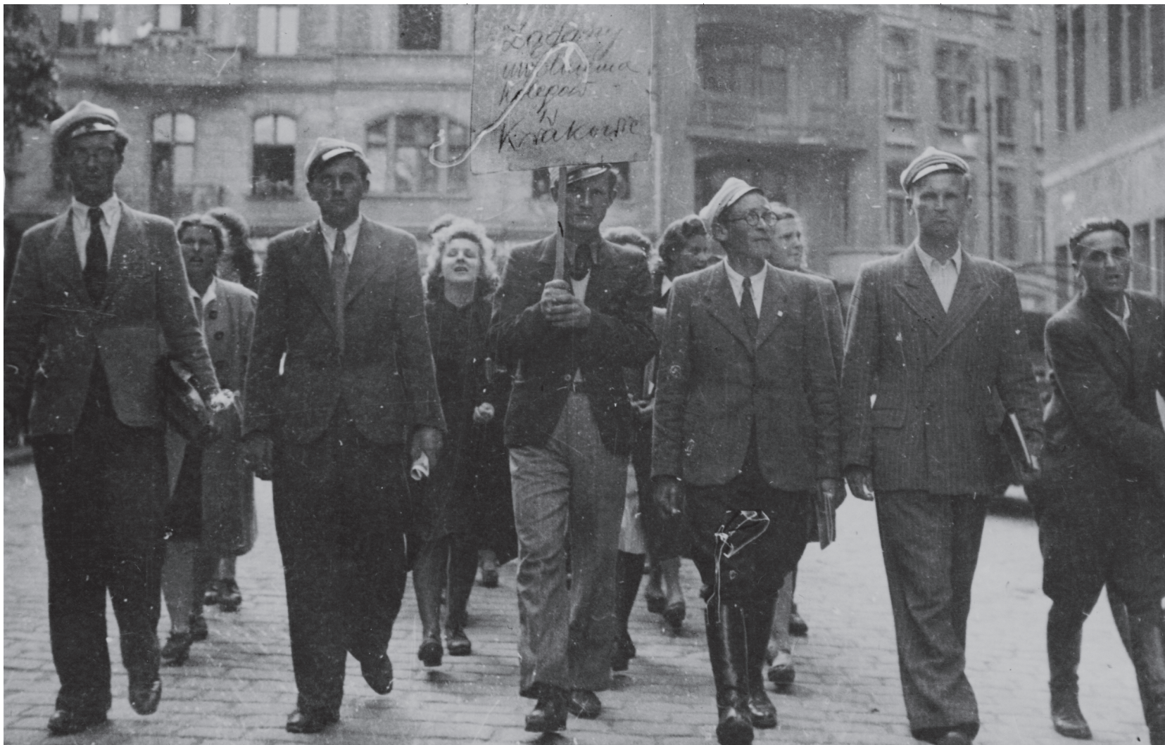
Poznańscy studenci demonstrują w maju 1946 r. z hasłem „Żądamy uwolnienia kolegów w Krakowie”

śledztwach kierowano zatrzymanych przed Wojskowe Sądy Rejonowe, czyli powołane w styczniu 1946 r. specjalne sądy do spraw określanych jako polityczne, których sędziowie, oficerowie komunistycznego wojska, często mieli za sobą jedynie kursy polityczno-prawne. Towarzyszyli im usłudzy prokuratorzy. Ten system odpowiadał za większość mordów sądowych, czyli niesprawiedliwych wyroków śmierci. W represyjnym stosowaniu narzędzi prawnych pomagał wydany 13 czerwca 1946 r. dekret o przestępstwach szczególnie niebezpiecznych w okresie odbudowy państwa, tzw. mały kodeks karny.