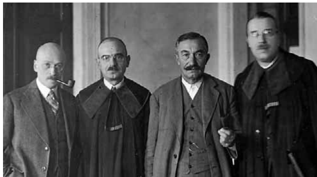
Proces brzeski w Sądzie Okręgowym przy ulicy Miodowej 15 w Warszawie. Oskarżeni Adam Pragier (pierwszy od lewej) i Wincenty Witos (trzeci od lewej) wraz z obrońcami.

W wyniku dokonanej przez Józefa Piłsudskiego zamachu stanu, 14 maja prezydent Stanisław Wojciechowski, premier Witos oraz ministrowie opuścili Belwedera, a następnie podali się do dymisji. Wiele osób obawiało się, że konflikt zbrojny może zmienić się w wojnę domową. Prawo obywateli wszystkich obywateli zostało złamane. W wyniku walk w Warszawie prawie czterysta osób poniosło śmierć, a około tysiąca zostało rannych, wśród ofiar była też ludność cywilna.