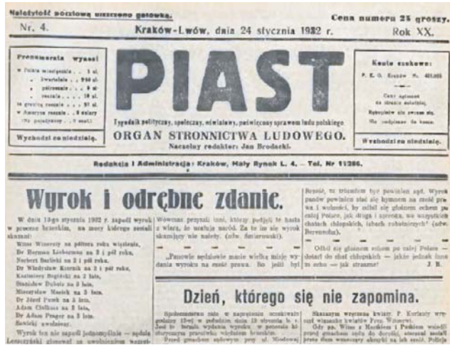
Tygodnik „Piast” z 24 stycznia 1932 r. Informacje na temat wyroku w procesie brzeskim.

Dopiero po ponad czterdziestu latach, 25 maja 2023 r. Sąd Najwyższy rozpoznał kasację wniesioną w 2020 roku przez Rzecznika Praw Obywatelskich. Wyroki sądów obu instancji zapadłe w latach 1932-1933 zostały uchylone. W rezultacie wszyscy politycy oskarżeni i skazani w procesie brzeskim zostali uniewinnieni. Przedstawiając uzasadnienie wyroku, przewodniczący składu orzekającego stwierdził, że: „Śledztwo i proces w rozpoznawanej sprawie stanowiły przykład instrumentalnego wykorzystania prawa i sądów do prześladowania przeciwników politycznych. (...) Ta sprawa powinna stanowić lekcję nie tylko dla sędziów, ale także dla przedstawicieli władzy wykonawczej, ustawodawczej, dla nas wszystkich”.