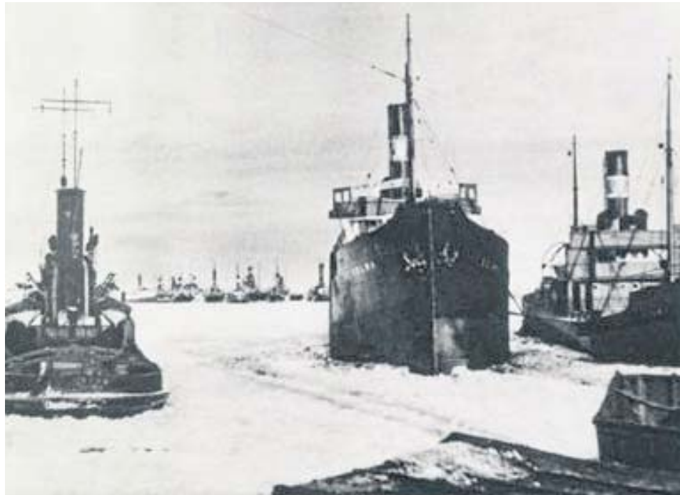
Gdynia, 1928 r.

Wolność nie przyszła w jednym dniu (jak świętujemy 11 listopada), ale była długim i trudnym, trwającym niemal cztery lata procesem, w którym różne dzielnice, regiony a nawet powiaty, w różnych dniach, miesiącach i latach