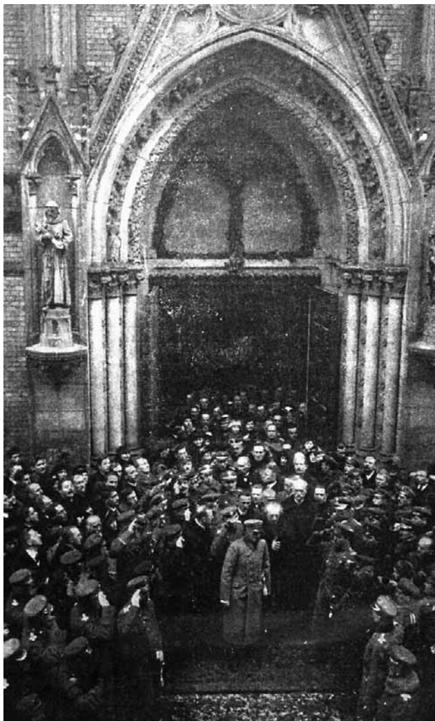
Nabożeństwo z okazji otwarcia obrad Sejmu Ustawodawczego w 1919 r., na pierwszym planie Józef Piłsudski, za nim po prawej - Ignacy Paderewski.

Polski autorytaryzm budowany był stopniowo i na pewno nie manifestował się w szczególnie ostrych formach - co nie zmienia faktu, że na wielu płaszczyznach oznaczało odejście od zasad demokracji. Nie odważyłbym się przy tym na stwierdzenie, że system ten był budowany w ramach prawa. Rozwiązania prawne raczej sankcjonowały kroki, które nagięły lub po prostu łamały literę, a przede wszystkim ducha pierwszej demokratycznej konstytucji polskiej, przyjętej w marcu 1921 r. (przy wszystkich jej słabościach).