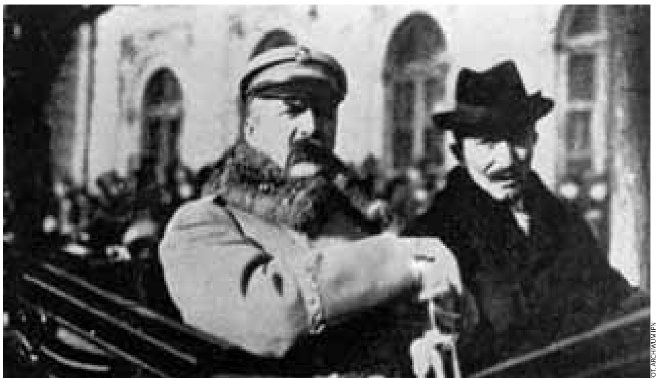
Józef Piłsudski i Wincenty Witos ok. 1920 r.

Poważnym i nierozwiązanym problemem II Rzeczypospolitej były relacje z mniejszościami narodowymi, stanowiącymi ok. 30% ogólnej liczby mieszkańców. Oba adresowane do mniejszości narodowych programy asymilacji: narodowej (promowany przez pravicę narodową) i państwowej (będący programem obozu sanacji), nie przyniosły pozytywnych skutków, a brak autonomii kulturalnej Ukraińców (w tym brak zgodny na powstanie narodowego Uniwersytetu) implikowało m.in. narastanie nacjonalizmu ukraińskiego, a z dru-