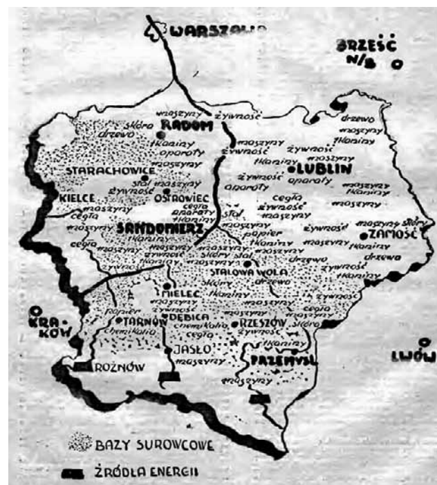
Mapa Centralnego Okręgu Przemysłowego z Ilustrowanego Kalendarza Słowa Pomorskiego, 1939 r.

Podsumowując, można przywołać opinię Bernarda Singera, autora felietonów parlamentarnych z lat międzywojennych, oceniającego realizację założenia Centralnego Okręgu Przemysłowego: „... stwierdzić można, że nad rycerskość żołnierza górniczego będzie przygotowanie techniczne oparte o bazę przemysłową”.