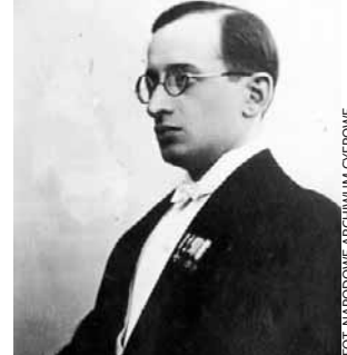
Władysław Dziadosz, wojewoda kielecki, 1938 r.

W 1938 r. wyznaczono granice ścisłego COP, w których szczególną opieką objęto zakłady przemysłowe, produkujące dla potrzeb wojska. Tereny związane z nowymi inwestycjami w COP, nazwane zostały „trójkątem bezpieczeństwa”, zgodnie z koncepcjami podejmowanymi jeszcze w latach 20. Największe nakłady inwestycyjne w regionie kielecko - radomskim dotyczyły powiatu radomskiego, natomiast Zagłębie Staropolskie w swych historycznych granicach, znalazło się poza obszarem szczególnego rozwoju przemysłu metalowego o charakterze zbrojeniowym.