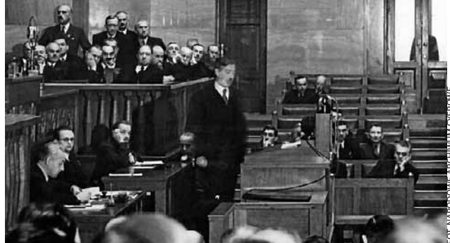
Wicepremier Eugeniusz Kwiatkowski w Sejmie, 1935 r.

Według ekonomisty Czesława Bobrowskiego COP sta-