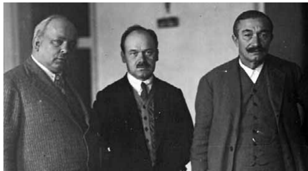
Proces brzeski w Sądzie Okręgowym przy ulicy Miodowej 15 w Warszawie. Część oskarżonych podczas przerwy w procesie.