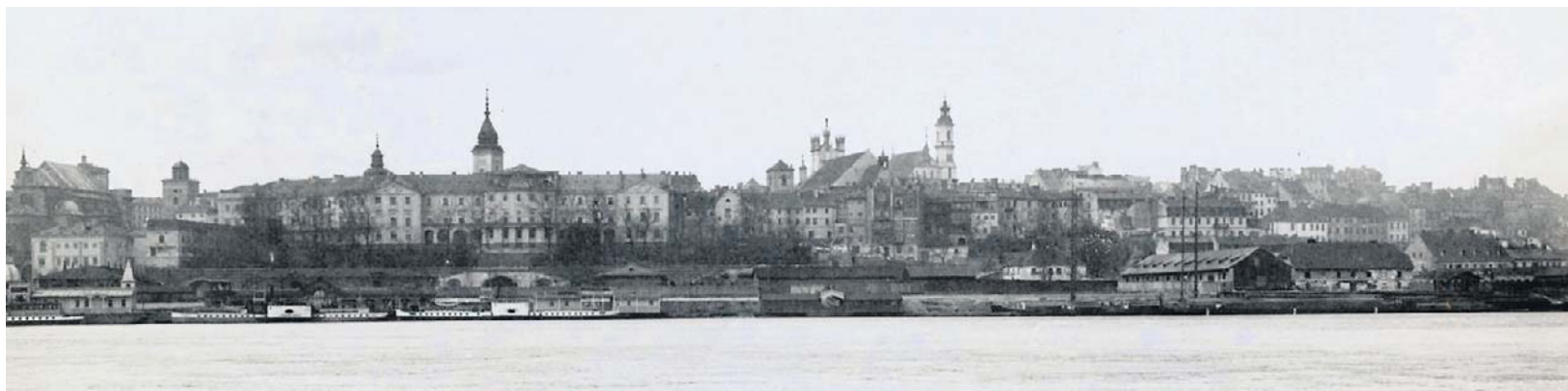
Panorama przedwojennej Warszawy.

Bardzo trudno o takie porównania i zestawienia. Nie powinniśmy zbyt łatwo popadać w kalkulacje, kto był gorszy, a kto lepszy; czyj autorytaryzm był łagodniejszy, a czyj ostrzejszy. Powiedziałbym raczej, że Polska akurat w tym aspekcie nie wyróżniała się niczym szczególnym: tendencje do autorytaryzmu charakteryzowały cały region i niemal wszystkie państwa wyłonione czy przekształcone w wyniku traktatu wersalskiego (by ująć rzecz hasłowo). Praktycznie tylko Czechosłowacja pozostała formalnie pełną demokracją, choć i tam standardy odbiegały od dzisiejszych.