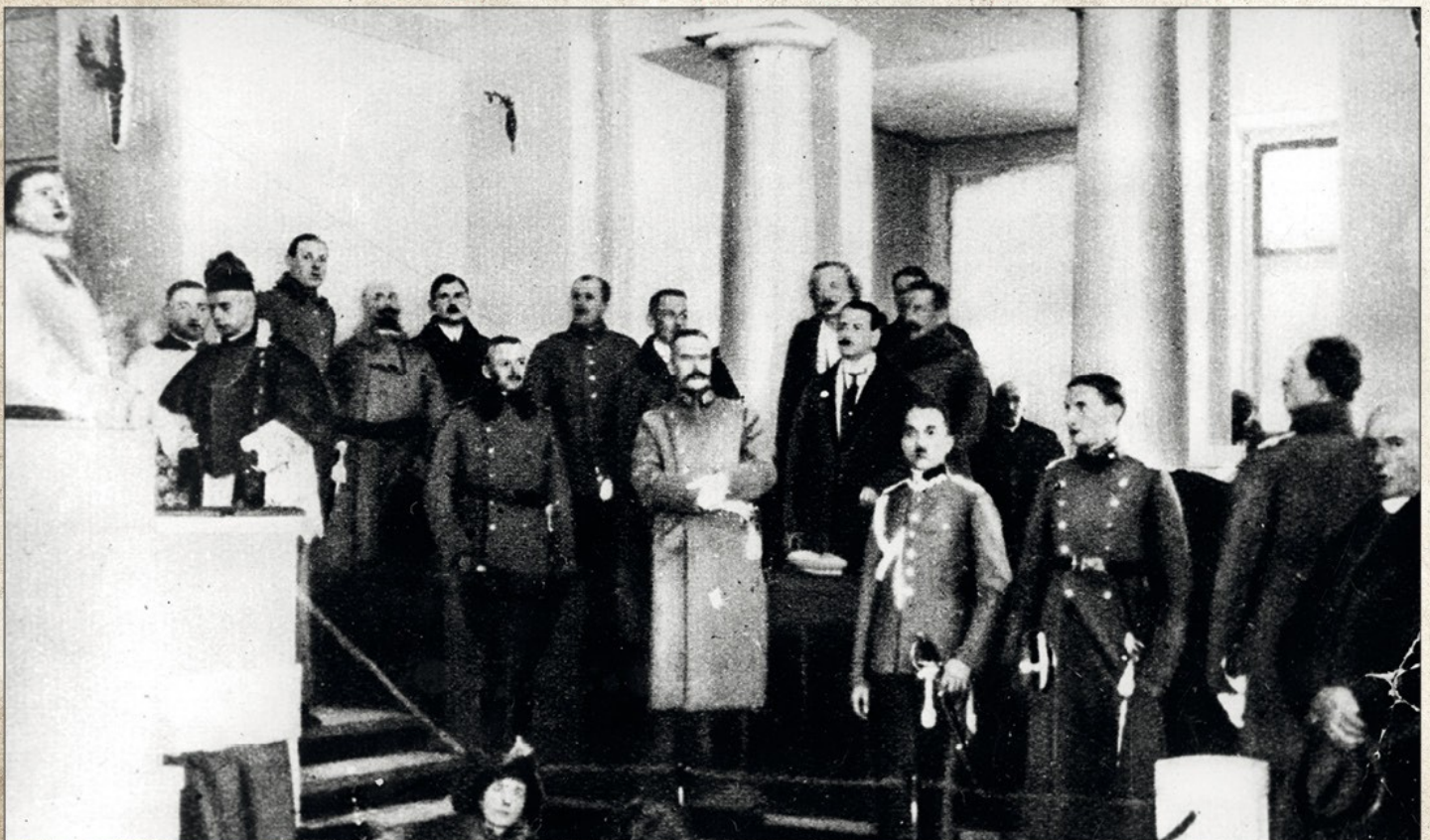
Otwarcie Sejmu Ustawodawczego w Warszawie, 10 lutego 1919 r.

Na początku lutego 1919 roku w państwie, które jeszcze trzy miesiące wcześniej nie istniało – i to od 123 lat! – było już po pierwszych wyborach parlamentarnych. A już 10 lutego, w gmachu byłego rosyjskiego Instytutu Maryjskiego przy ul. Wiejskiej w Warszawie, odbyło się pierwsze w niepodległej Polsce posiedzenie Sejmu Ustawodawczego.