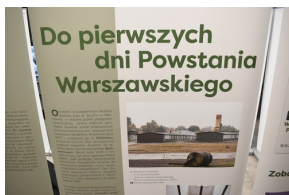
Wystawa o Stefanie Roweckim „Grocie”.