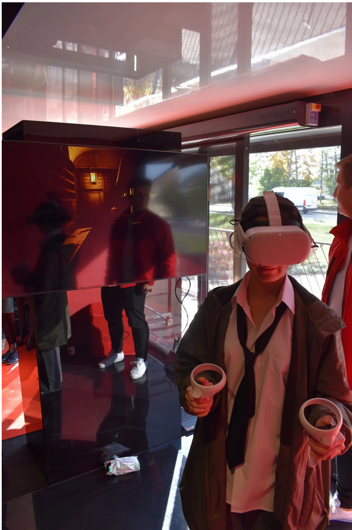
„Gra Szyfrów” w Końskich.