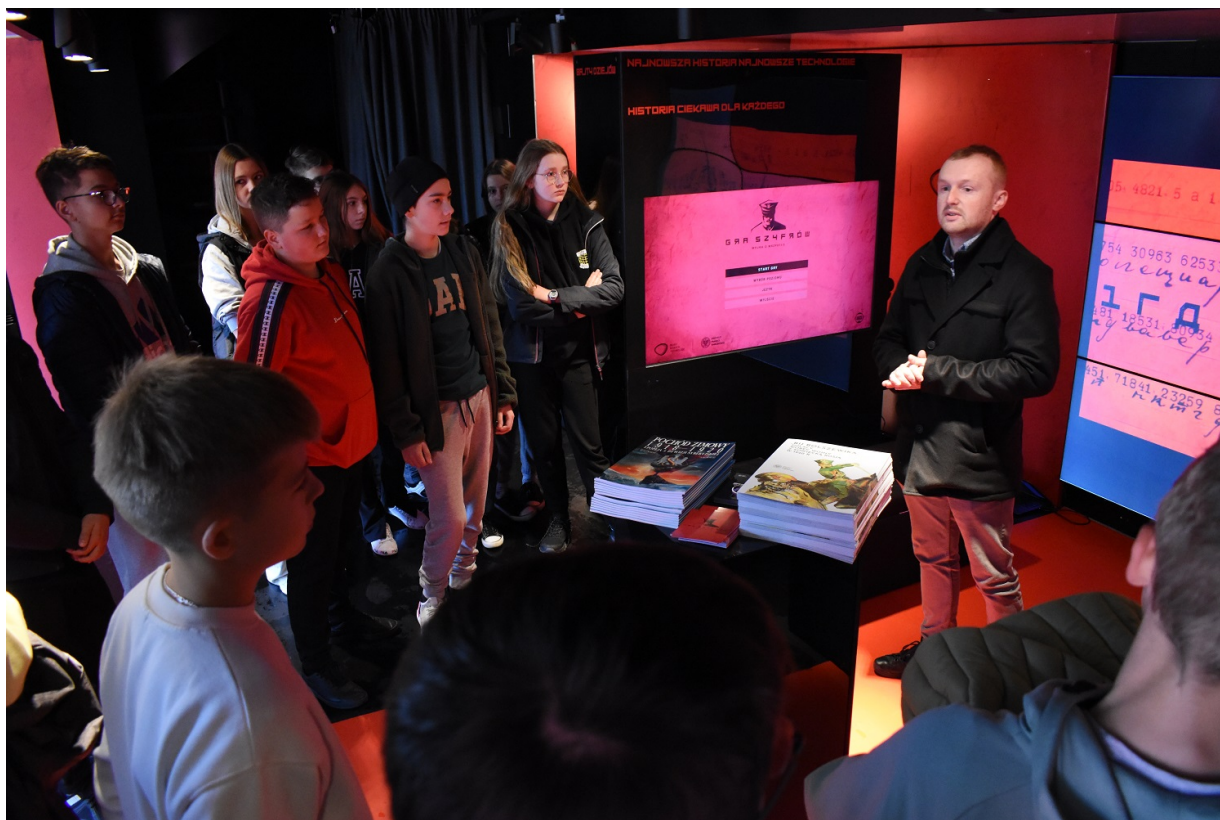
Mobilny showroom z „Grą Szyfrów” w Jędrzejowie.