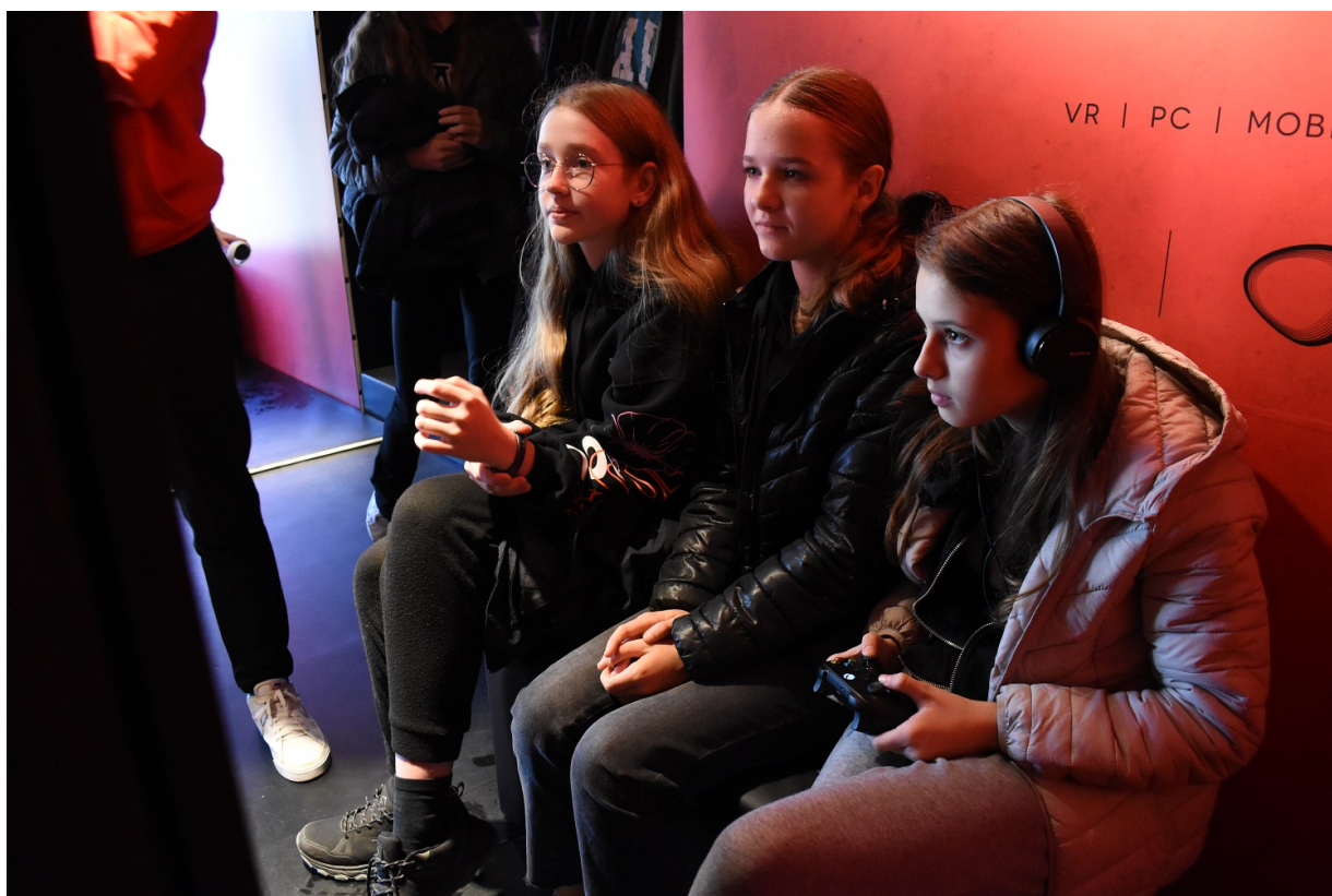
Mobilny showroom z „Grą Szyfrów” w Jędrzejowie.