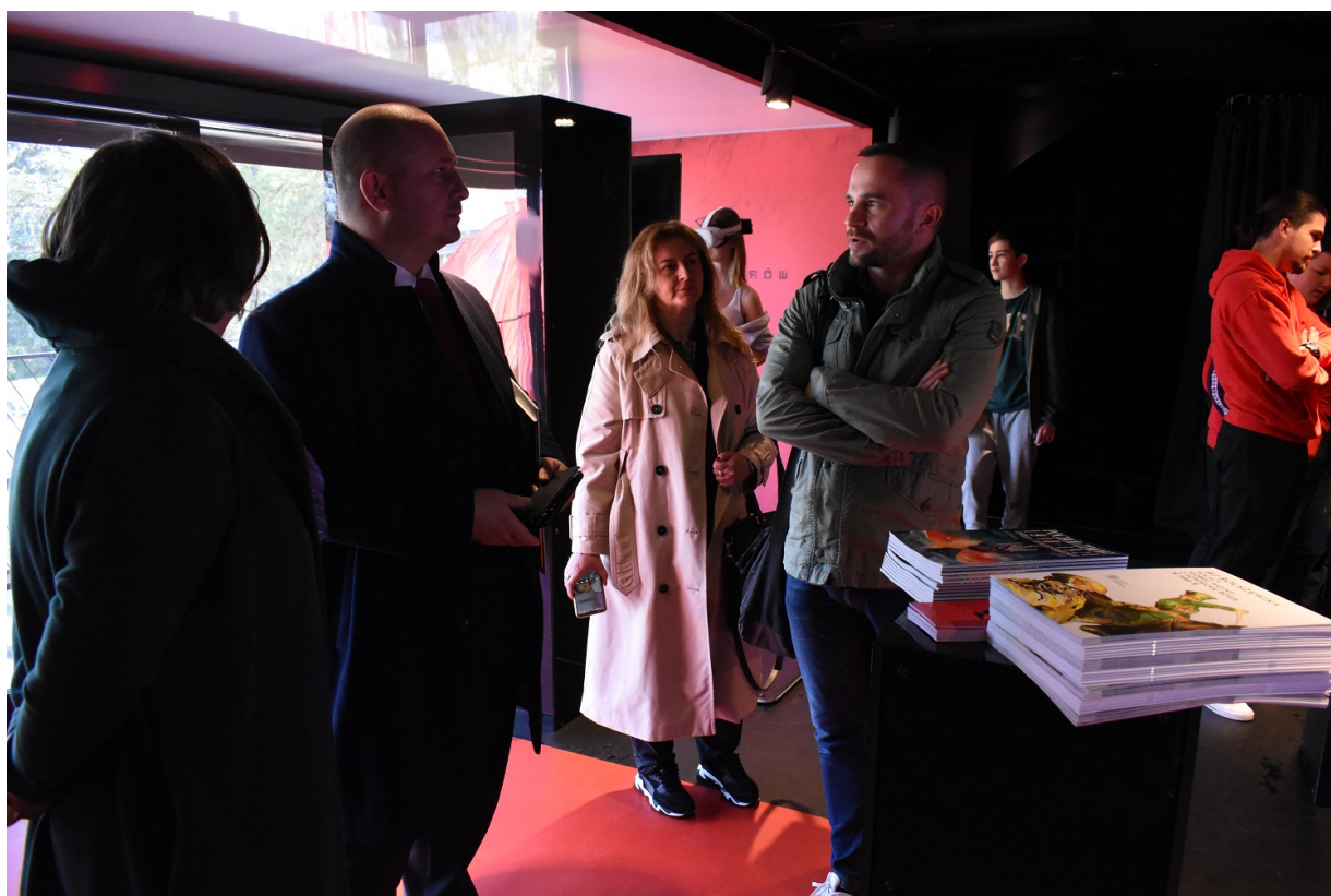
Mobilny showroom z „Grą Szyfrów” w Jędrzejowie.