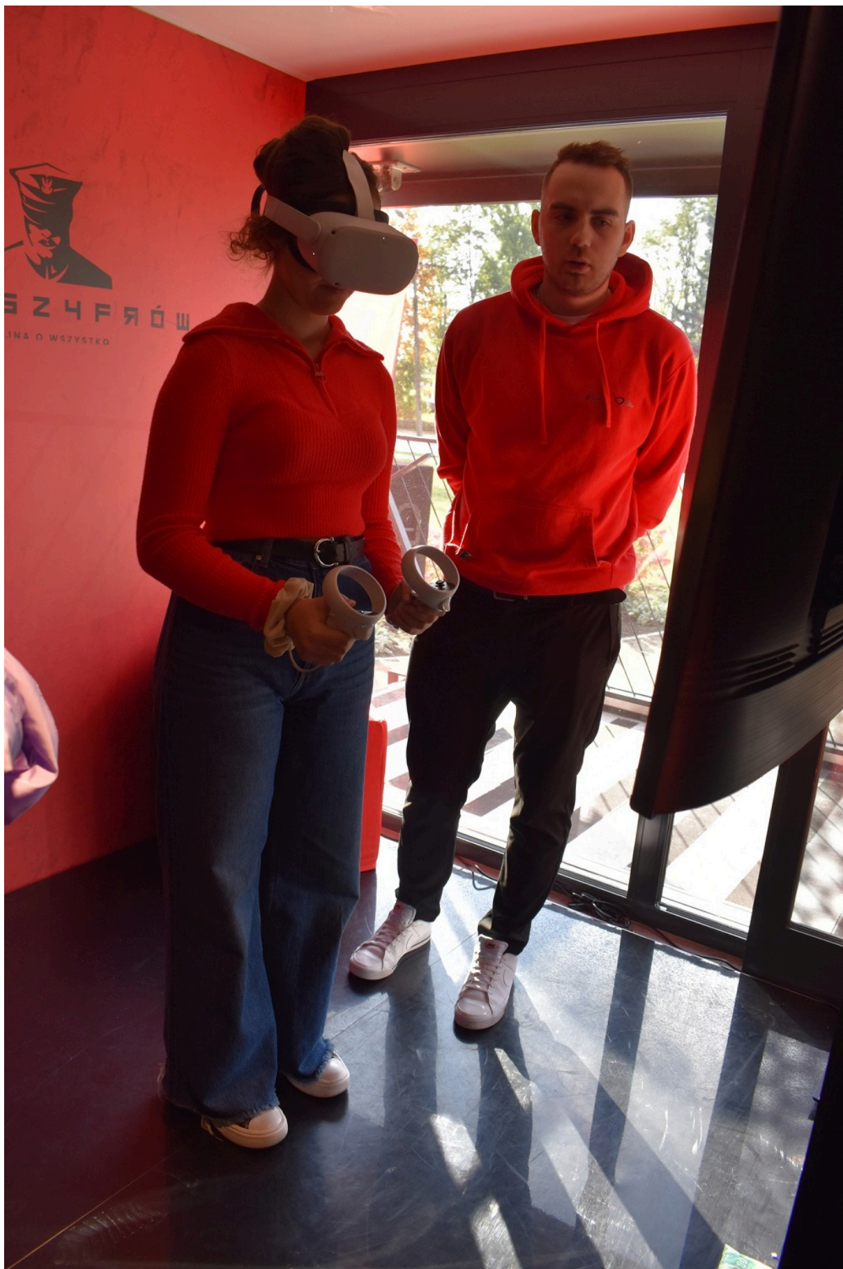
„Gra Szyrów” w Końskich.