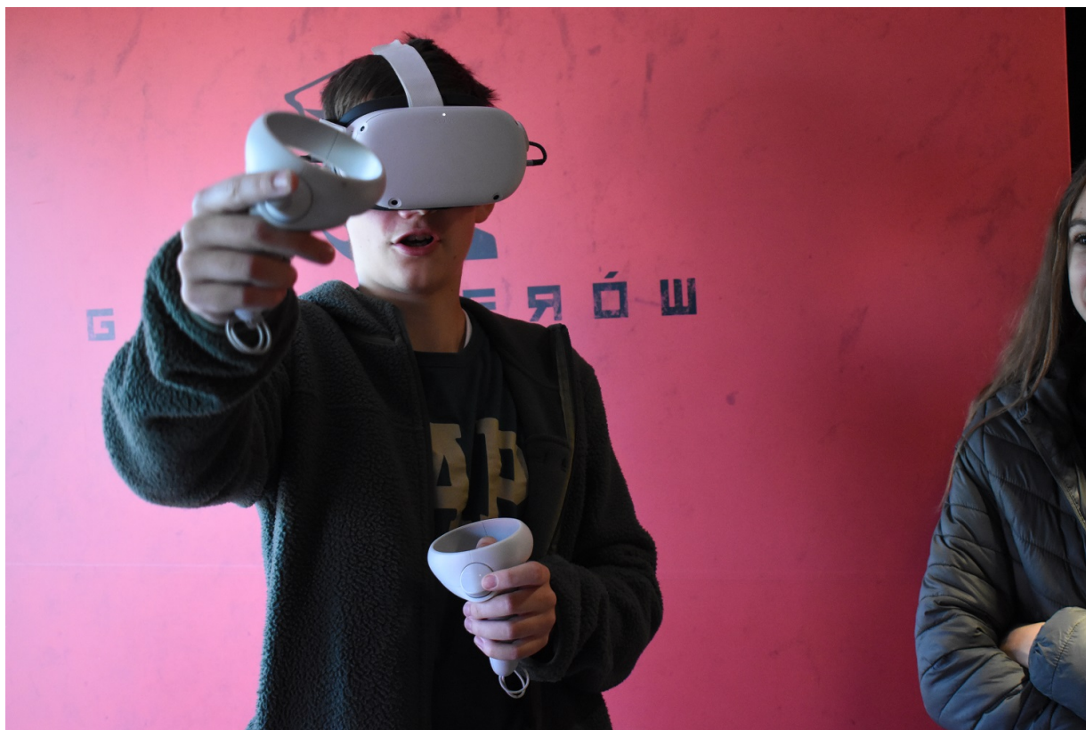
Mobilny showroom z „Grą Szyfrów” w Jędrzejowie.