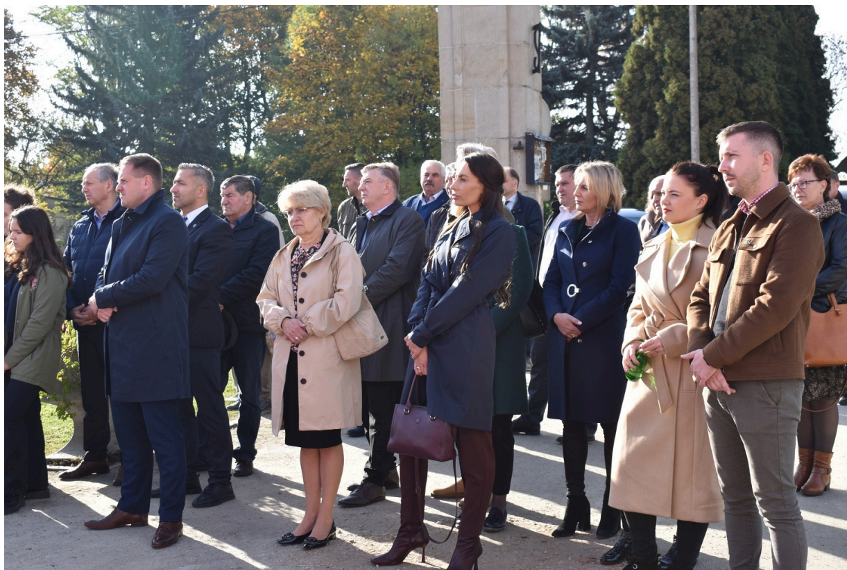
„Gra Szyfrów” w Końskich.

Mobilny showroom promujący gamingowy projekt edukacyjny IPN pt. „Gra Szyfrów” 11 października 2022 r. zaparkował na placu przed Urzędem Miasta i Gminy w Końskich. W prezentacji innowacyjnej inicjatywy brał udział prezes Instytutu dr Karol Nawrocki wraz z pracownikami kieleckiej delegatury IPN. 12 października tir z grą zatrzymał się na parkingu przy Centrum Kultury w Jędrzejowie.