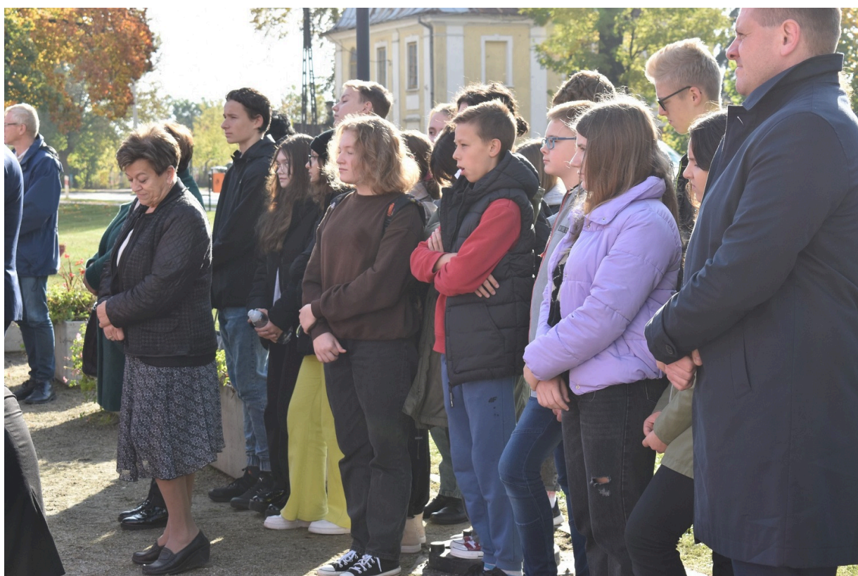
„Gra Szyfrow” w Końskich.