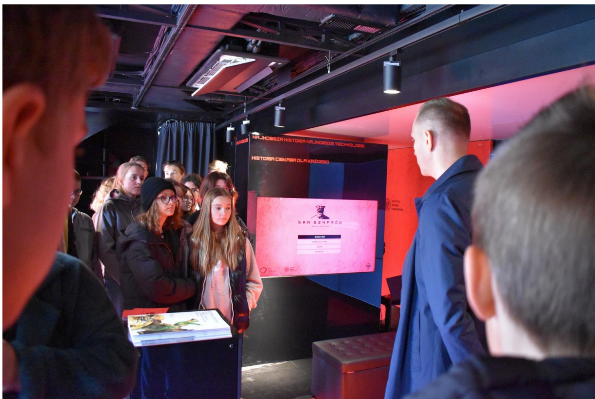
„Gra Szyfrów” w Końskich.