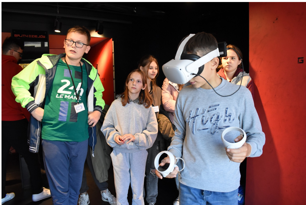
Mobilny showroom z „Grą Szyfrów” w Jędrzejowie.