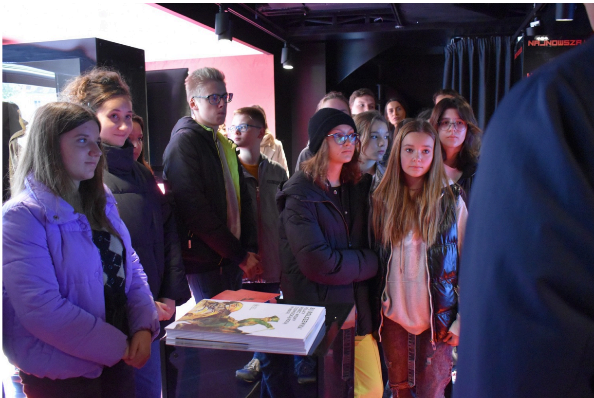
„Gra Szyfrów” w Końskich.