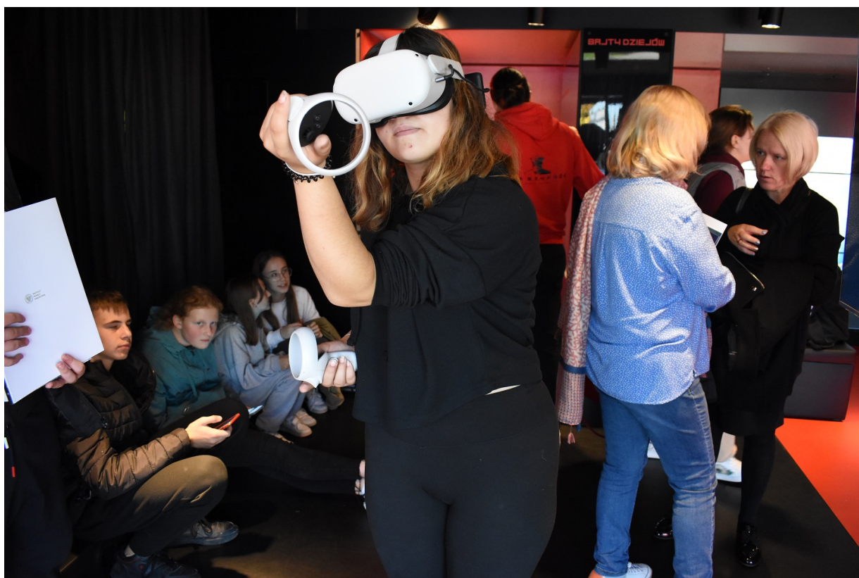
Mobilny showroom z „Grą Szyfrów” w Jędrzejowie.

Mieszkańcy Końskich mogli bezpłatnie wypróbować grę wideo, która służy nie tylko