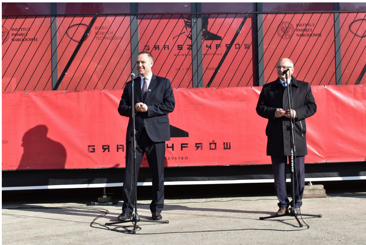
„Gra Szyfrow” w Końskich.