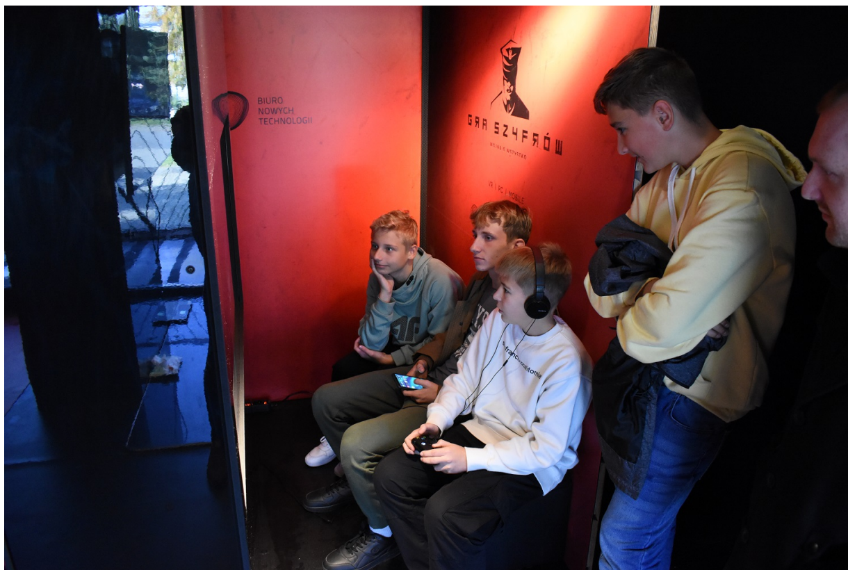
Mobilny showroom z „Grą Szyfrów” w Jędrzejowie.