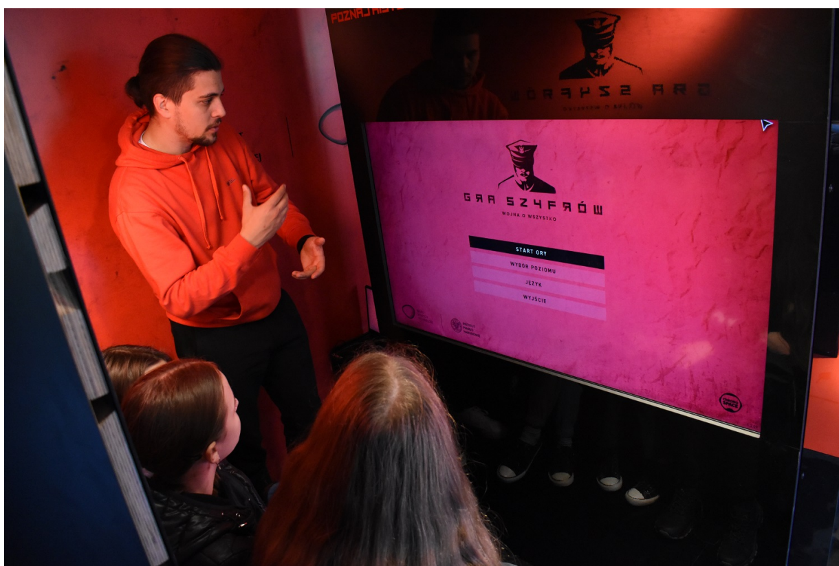
Mobilny showroom z „Grą Szyfrów” w Jędrzejowie.