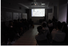
Wykład o Żołnierzach Wyklętych i sens filmowy w kieleckim „Przystanku Historia”.