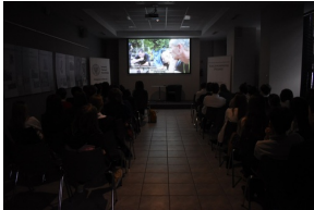
Wykład o Żołnierzach Wyklętych i sens filmowy w kieleckim „Przystanku Historia”.