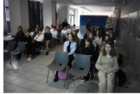
Wykład o Żołnierzach Wyklętych i sens filmowy w kieleckim „Przystanku Historia”.