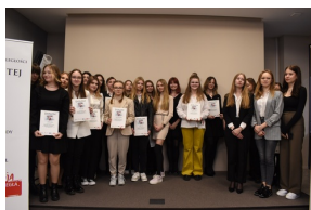
Ogólnopolski konkurs recytatorski „W kręgu poezji i prozy łagrowej więźniarek KL Ravensbrück” - etap regionalny w Kielcach.