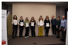
Ogólnopolski konkurs recytatorski „W kręgu poezji i prozy łagrowej więźniarek KL Ravensbrück” - etap regionalny w Kielcach.