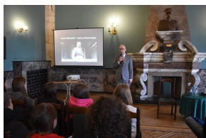
Cykl wystaw pt. „Ojcowie Niepodległości” - Józef Piłsudski