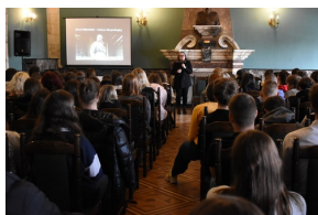
Cykl wystaw pt. „Ojcowie Niepodległości” - Józef Piłsudski