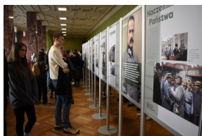
Cykl wystaw pt. „Ojcowie Niepodległości” - Józef Piłsudski