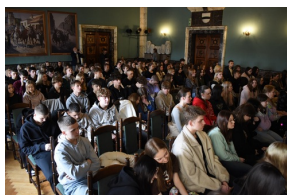
Cykl wystaw pt. „Ojcowie Niepodległości” - Józef Piłsudski