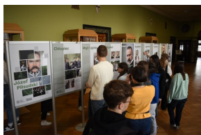
Cykl wystaw pt. „Ojcowie Niepodległości” - Józef Piłsudski