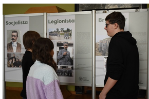
Cykl wystaw pt. „Ojcowie Niepodległości” - Józef Piłsudski