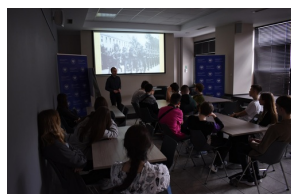
Z Kielecczynny na Westerplatte - cykl spotkań i audycji