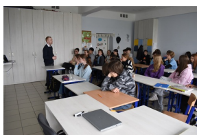
Z Kielecczyny na Westerplatte - zajęcia w Akademickiej Szkole Podstawowej im. Williama Shakespeare'a