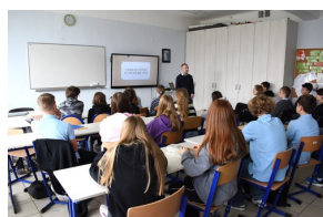
Z Kielecczyny na Westerplatte - zajęcia w Akademickiej Szkole Podstawowej im. Williama Shakespeare'a