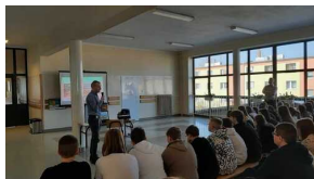
Z Kielecczynny na Westerplatte - cykl spotkań i audycji radiowych