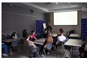
Z Kielecczynny na Westerplatte - cykl spotkań i audycji

5 kwietnia, o patronach swojej szkoły - Bohaterach Westerplatte - posłuchali uczniowie klasy VIII Szkoły Podstawowej nr 12 w Kielcach. Spotkanie odbyło się w kieleckim „Przystanku Historia” IPN. Warto dodać, że zajęcia odbyły się w 85. rocznicę zameldowania się na Wojskowej Składnicy Tranzytowej na Westerplatte ostatni żołnierze przystani z Kielc. Proces zasilania nadmorskiej placówki odbył się na przełomie marca i kwietnia 1939 r. i nie przebiegł tak gładko, jak przewidywano.