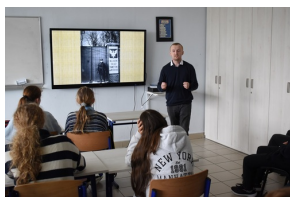
Z Kielecczyny na Westerplatte - zajęcia w Akademickiej Szkole Podstawowej im. Williama Shakespeare'a

W najbliższych miesiącach zostały zaplanowane kolejne spotkania, a ich adresatami będą uczniowie szkół podstawowych i średnich, żołnierze, członkowie klubu seniora, a także osadzeni w Areszcie Śledczym.