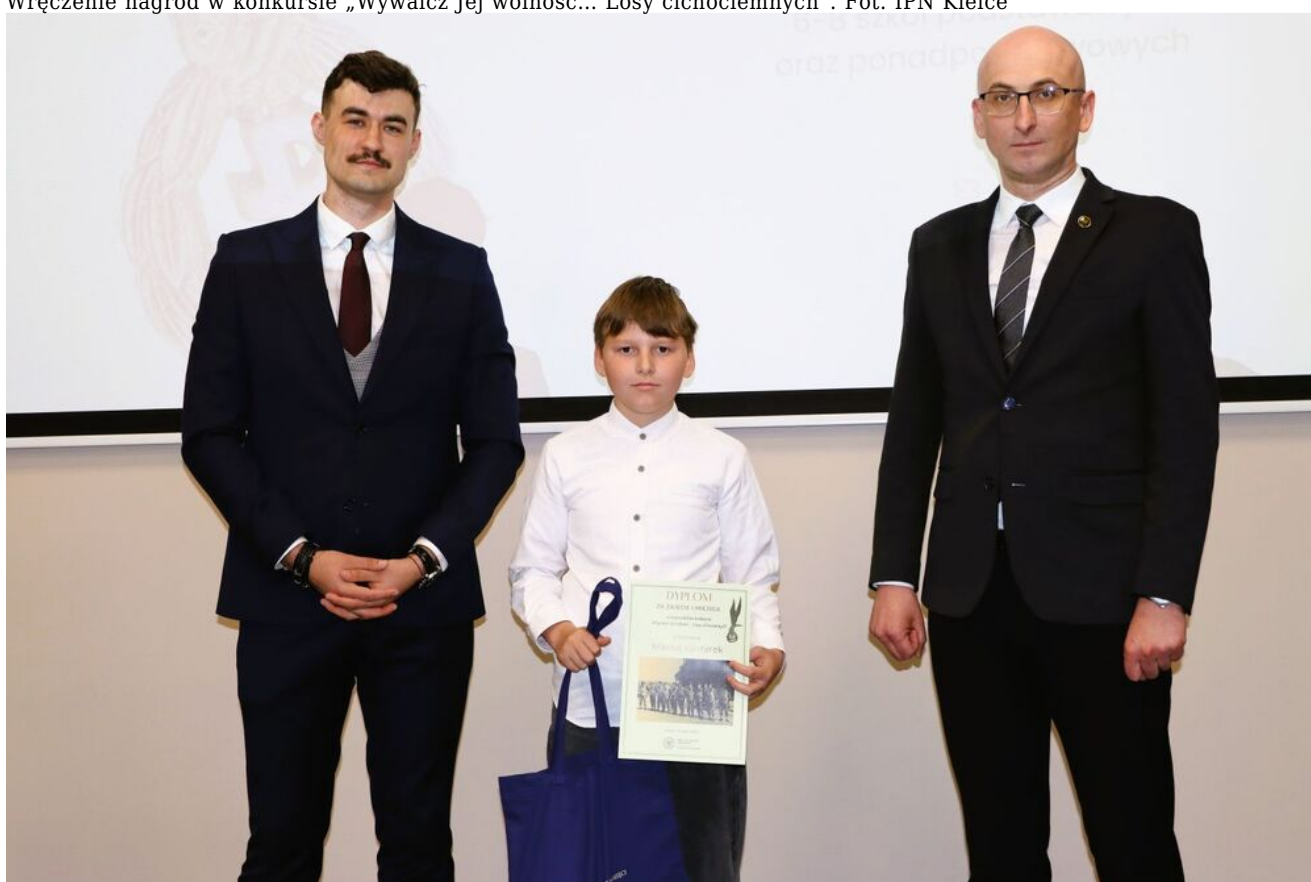
Wręczenie nagród w konkursie „Wywalcz Jej wolność... Losy cichociemnych”.