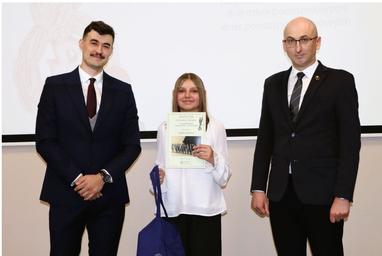
Wręczenie nagród w konkursie „Wywalcz Jej wolność... Losy cichociemnych”.