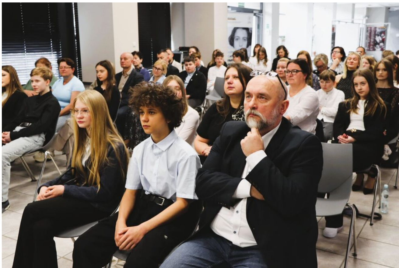
Wręczenie nagród w konkursie „Wywalcz Jej wolność... Losy cichociemnych”.