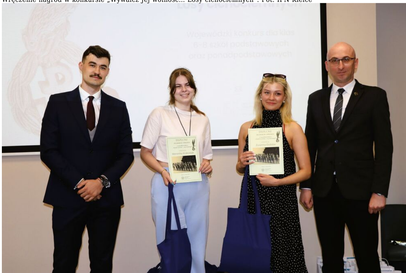
Wręczenie nagród w konkursie „Wywalcz Jej wolność... Losy cichociemnych”.