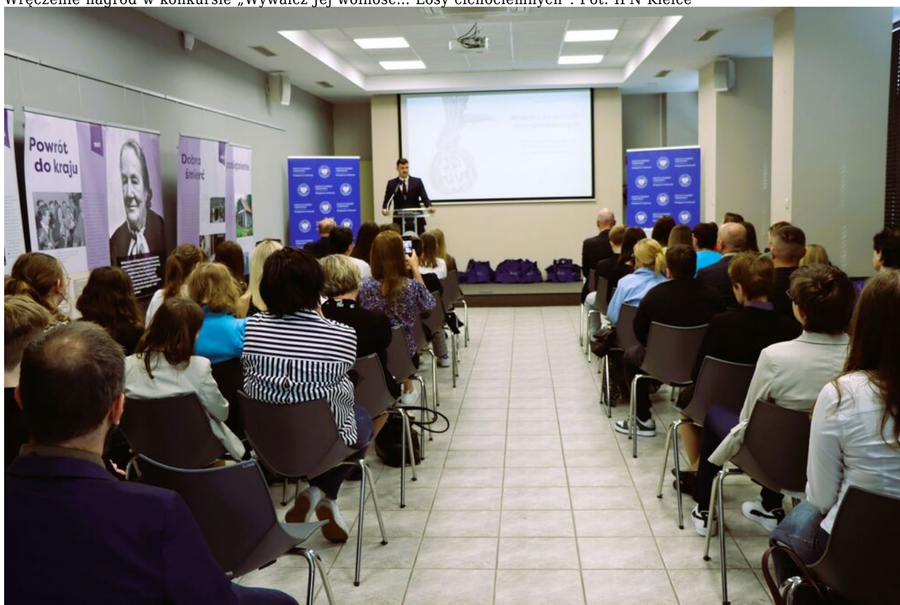
Wręczenie nagród w konkursie „Wywalcz Jej wolność... Losy cichociemnych”.