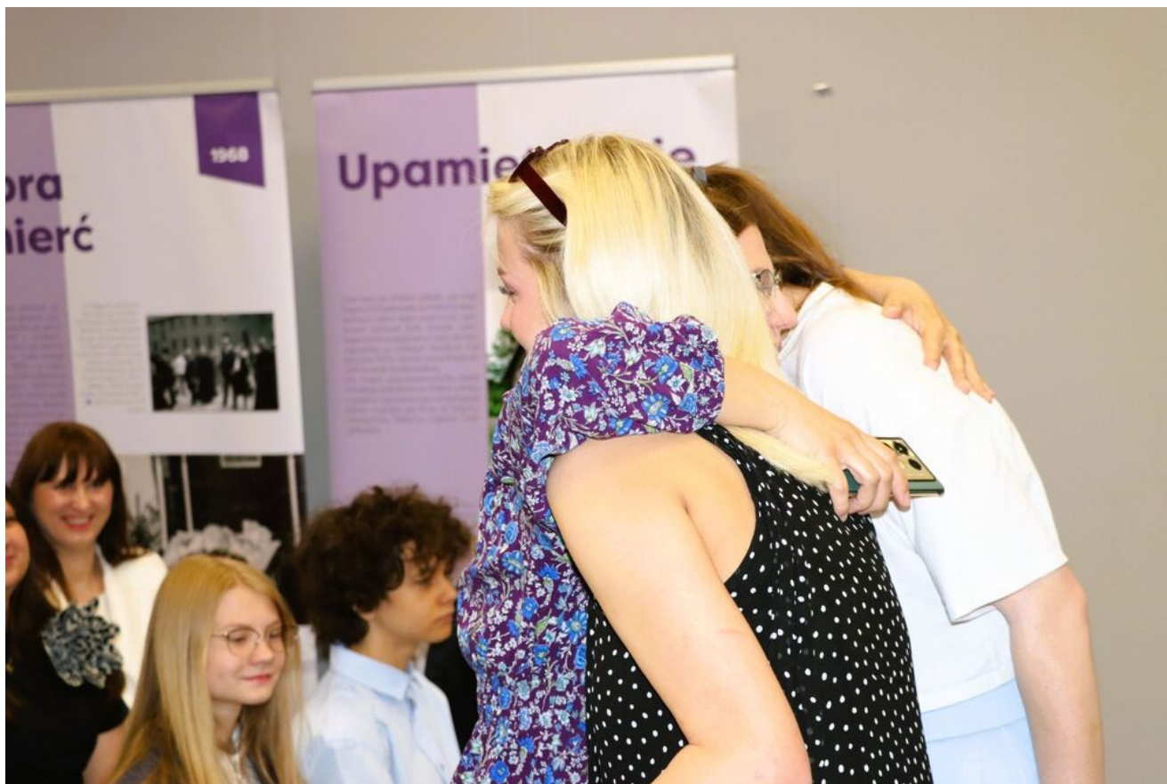
Wręczenie nagród w konkursie „Wywalcz Jej wolność... Losy cichociemnych”.