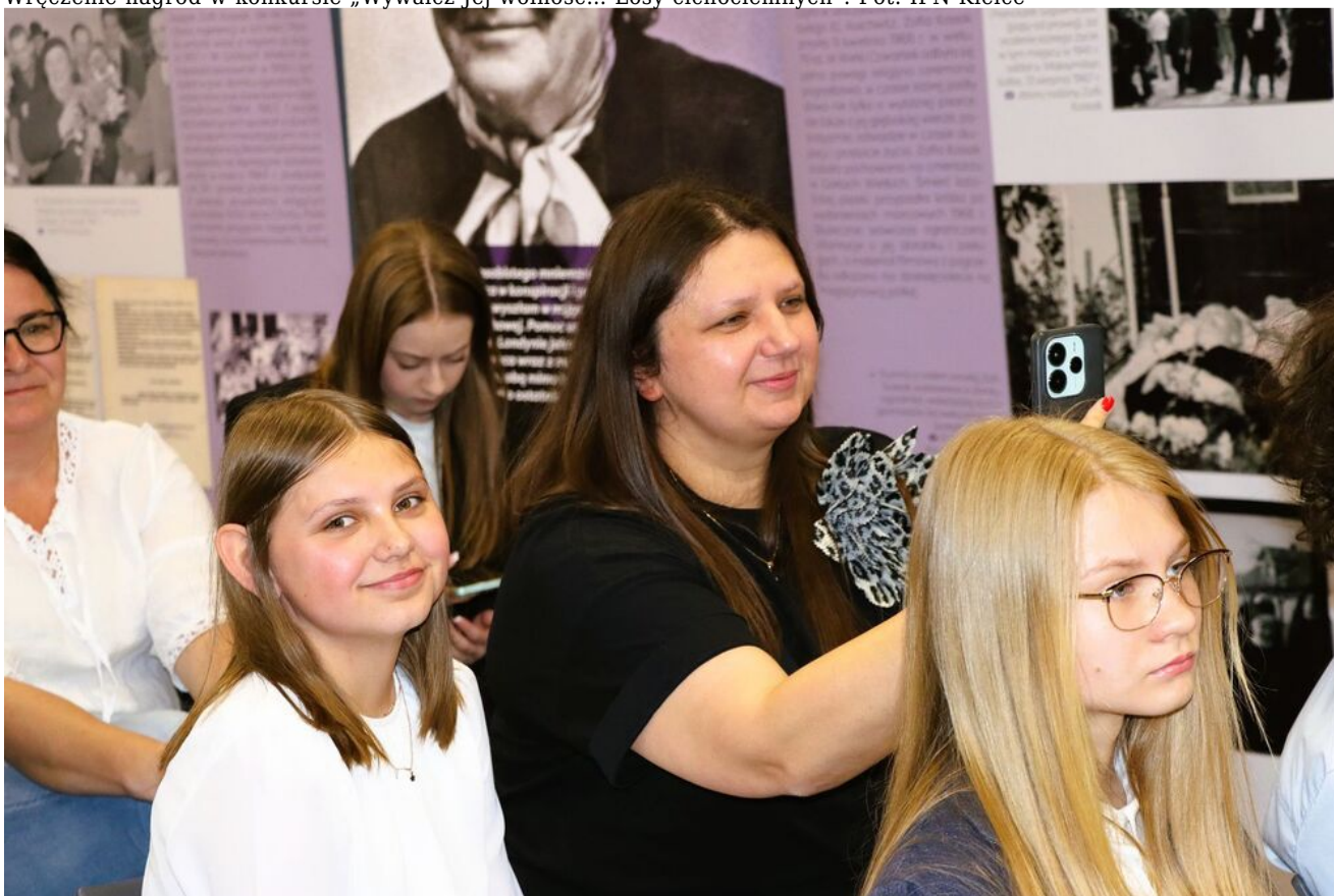
Wręczenie nagród w konkursie „Wywalcz Jej wolność... Losy cichociemnych”.

Laureaci w kategorii szkoły podstawowe (prace literackie):