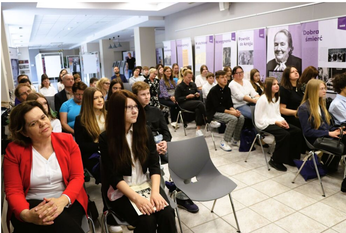
Wręczenie nagród w konkursie „Wywalcz Jej wolność... Losy cichociemnych”.