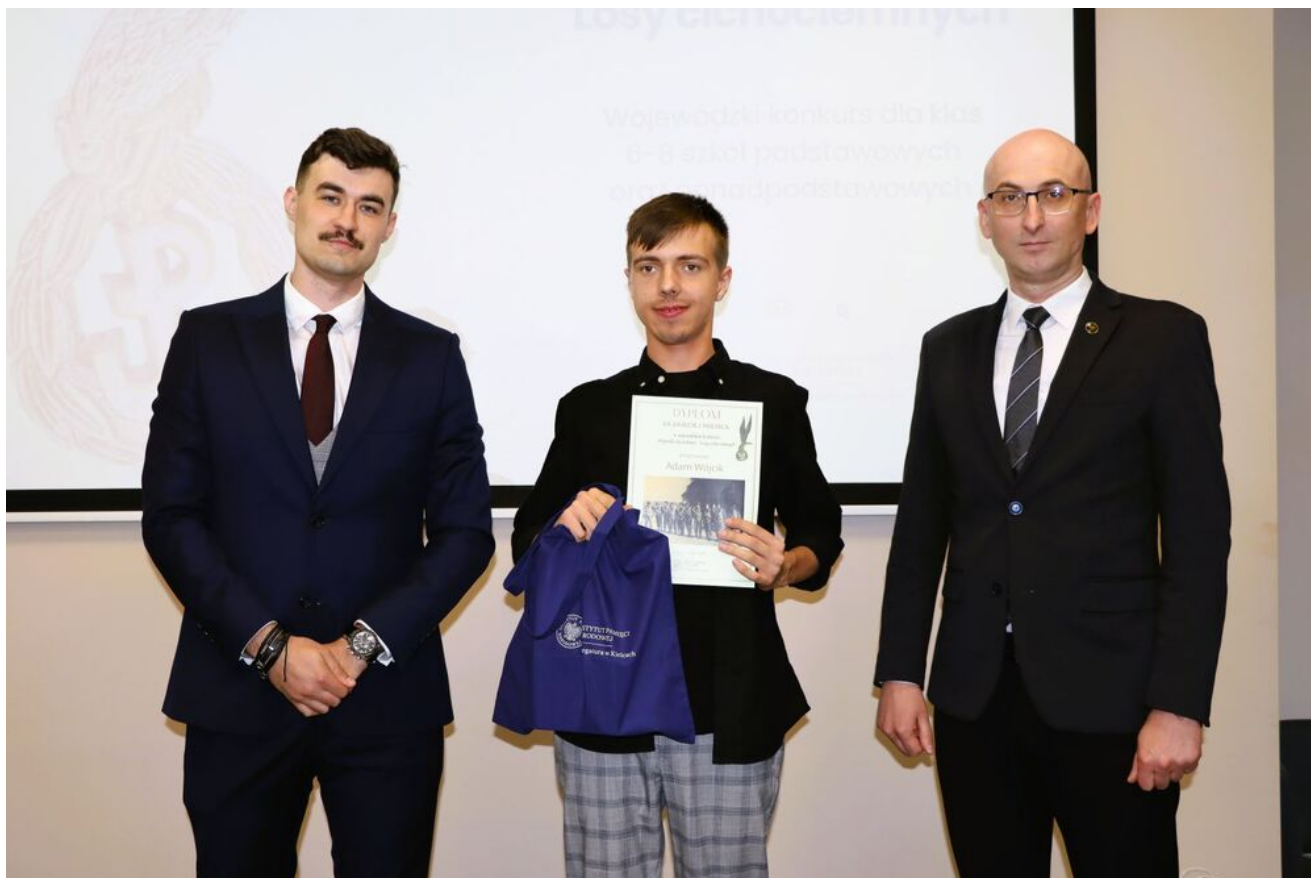
Wręczenie nagród w konkursie „Wywalcz Jej wolność... Losy cichociemnych”.