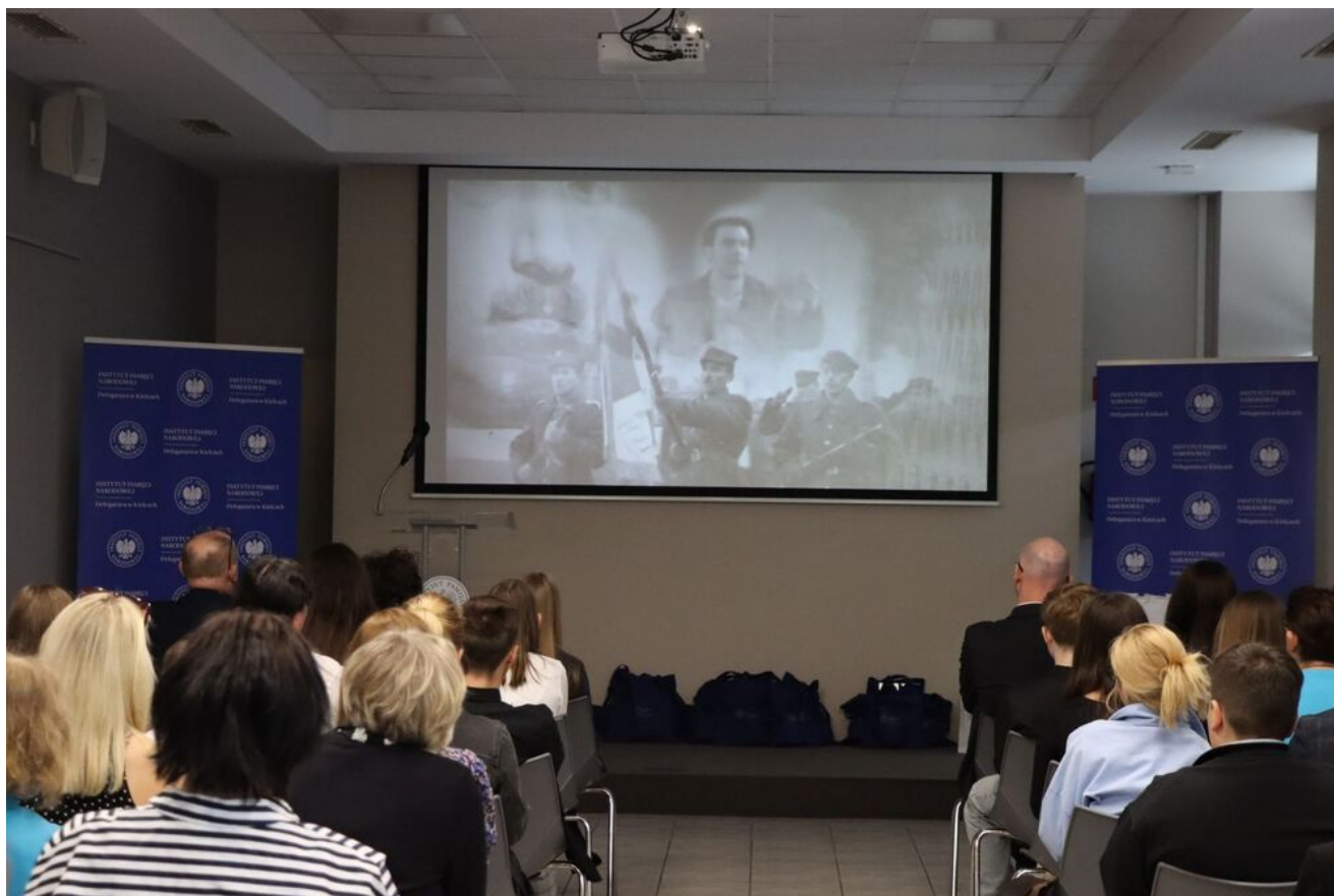
Wręczenie nagród w konkursie „Wywalcz Jej wolność... Losy cichociemnych”.