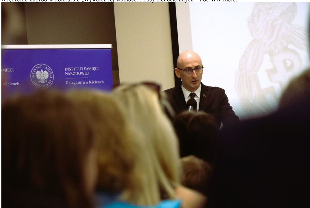
Wręczenie nagród w konkursie „Wywalcz Jej wolność... Losy cichociemnych”.