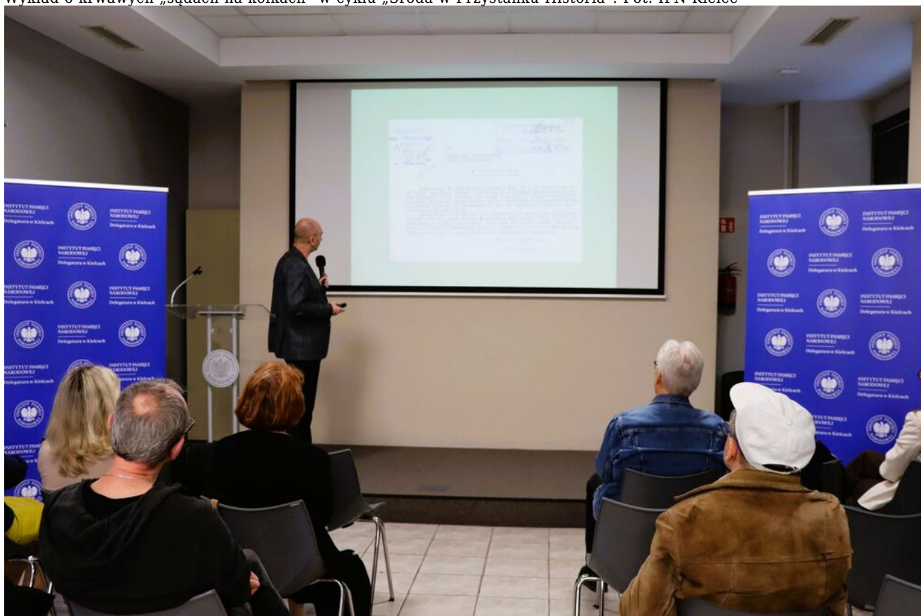
Wykład o krwawych „sądach na kółkach” w cyklu „Sroda w Przystanku Historia”.