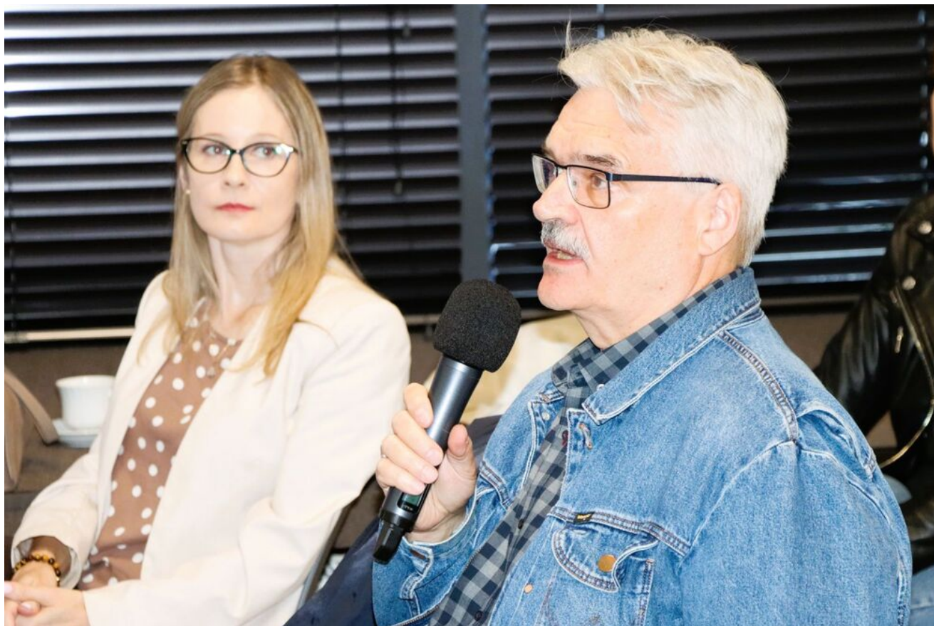
Wykład o krwawych „sądach na kółkach” w cyklu „Sroda w Przystanku Historia”.