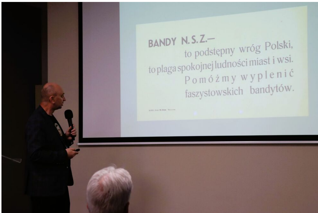
Wykład o krwawych „sądach na kółkach” w cyklu „Sroda w Przystanku Historia”.