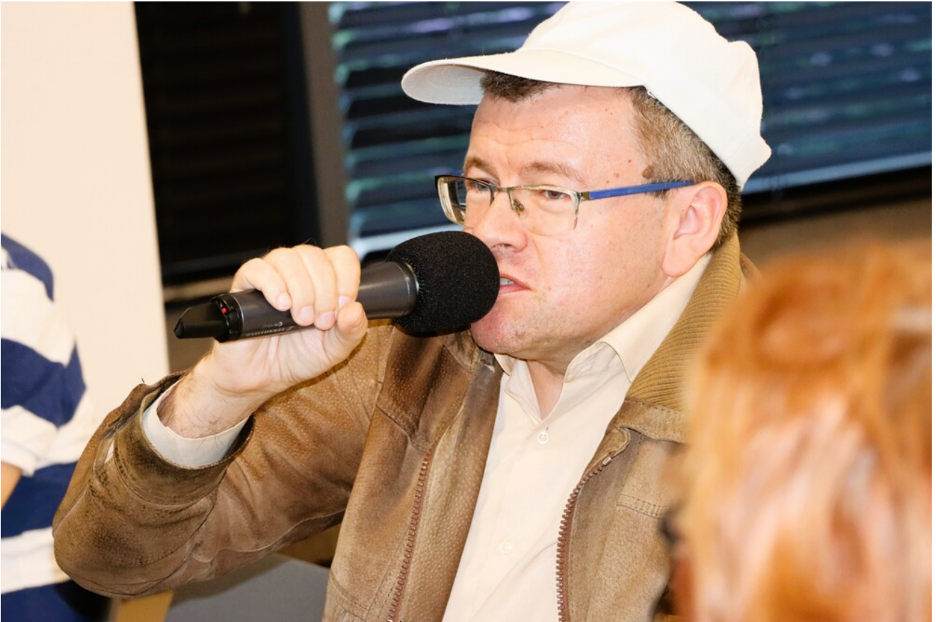
Wykład o krwawych „sądach na kółkach” w cyklu „Sroda w Przystanku Historia”.