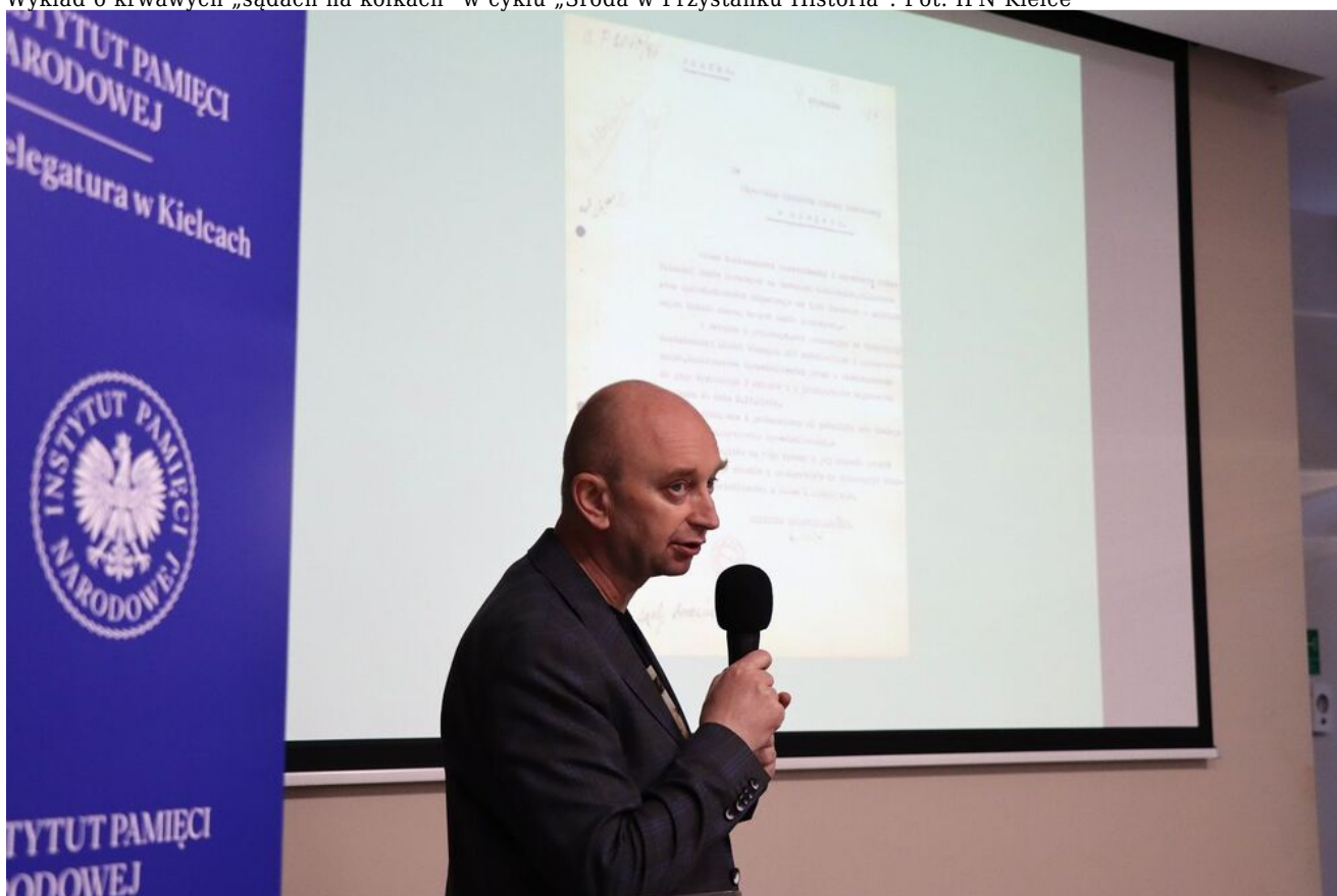
Wykład o krwawych „sądach na kółkach” w cyklu „Sroda w Przystanku Historia”.