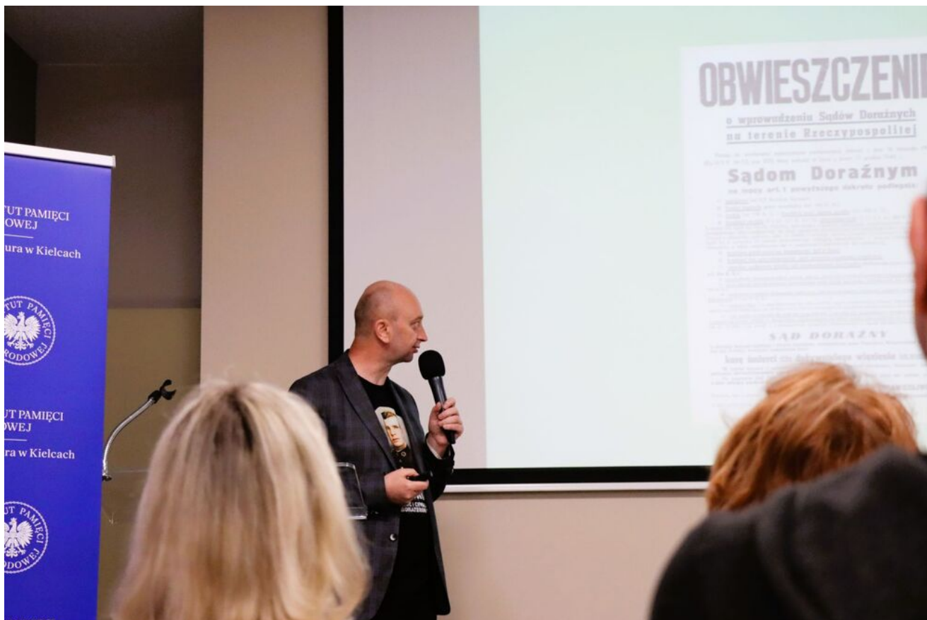
Wykład o krwawych „sądach na kółkach” w cyklu „Sroda w Przystanku Historia”.