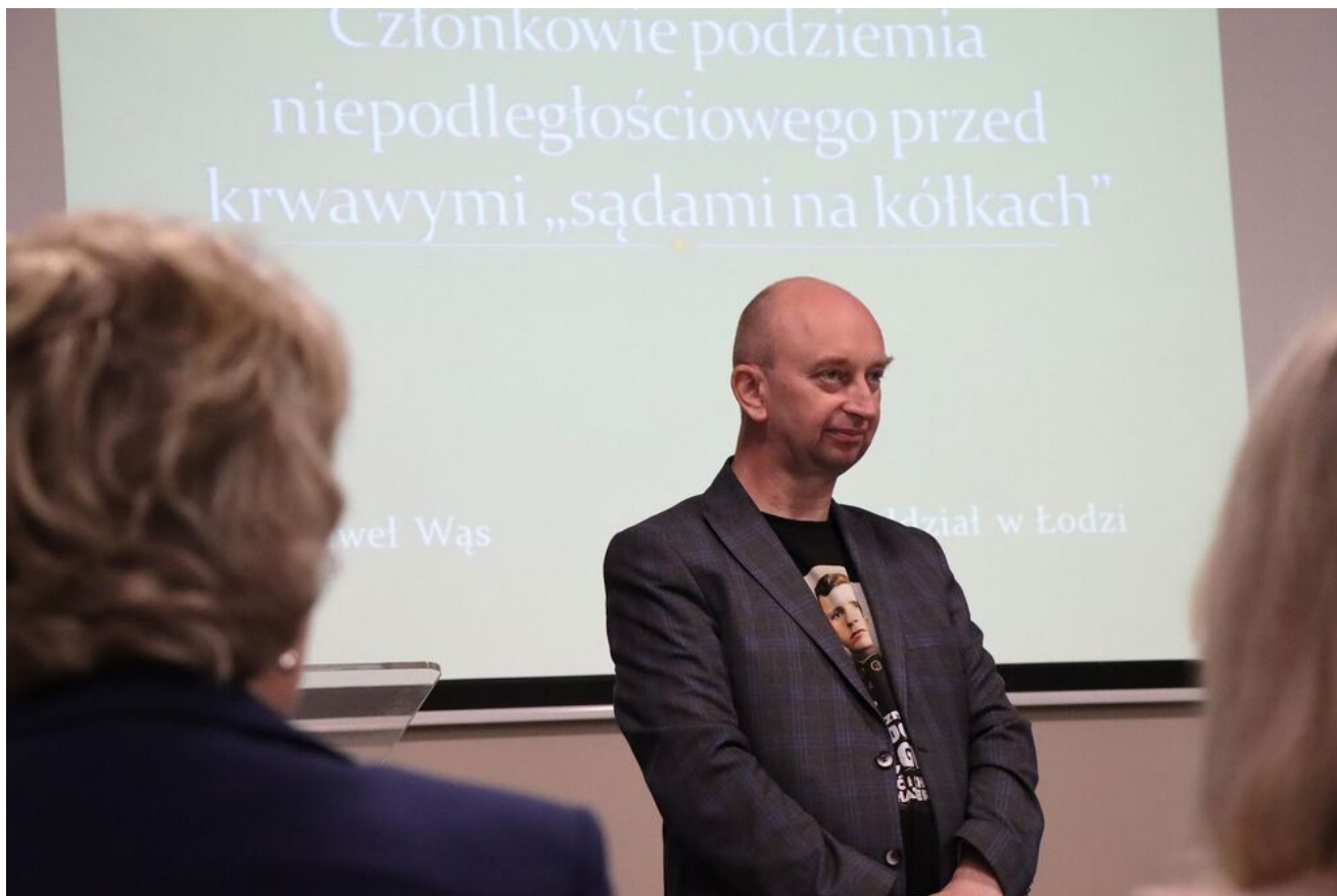
Wykład o krwawych „sądach na kółkach” w cyklu „Środa w Przystanku Historia”.