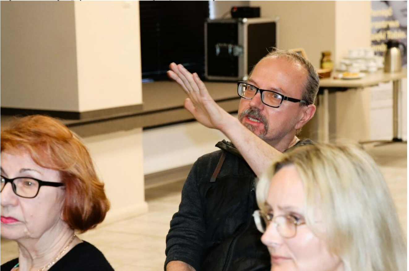
Wykład o krwawych „sądach na kółkach” w cyklu „Sroda w Przystanku Historia”.