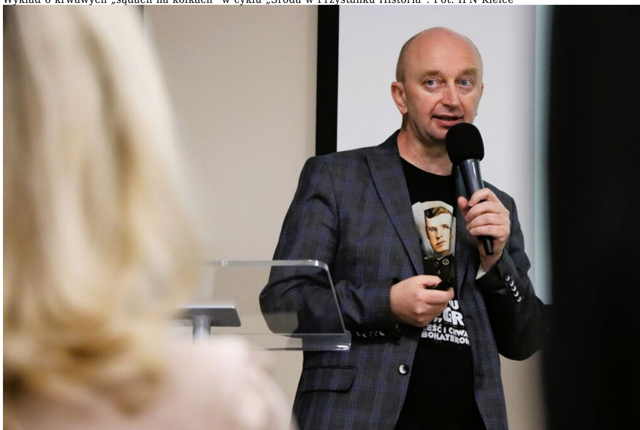
Wykład o krwawych „sądach na kółkach” w cyklu „Środa w Przystanku Historia”.