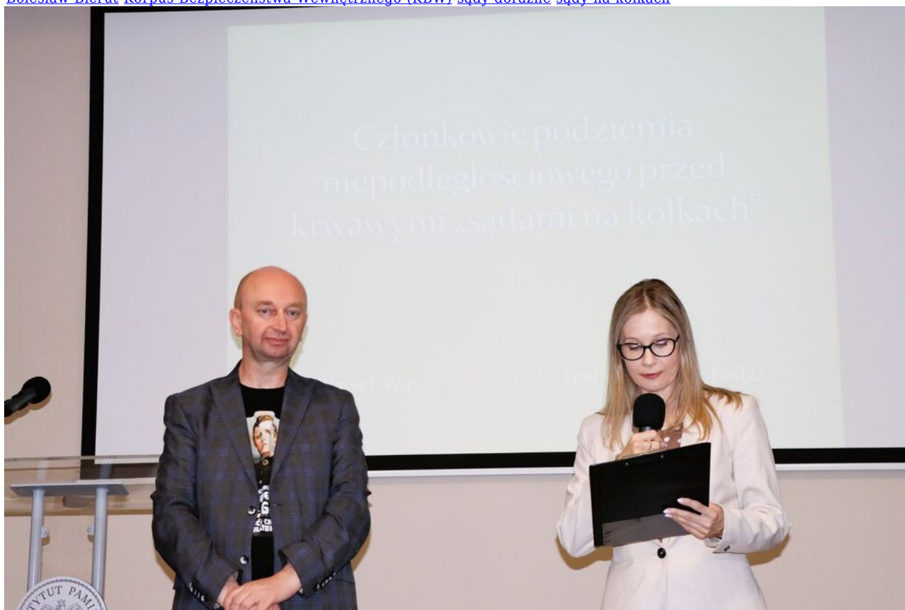
Wykład o krwawych „sądach na kółkach” w cyklu „Środa w Przystanku Historia”.

Bolesław Bierut Korpus Bezpieczeństwa Wewnętrznego (KBW) sądy doraźne sądy na kółkach