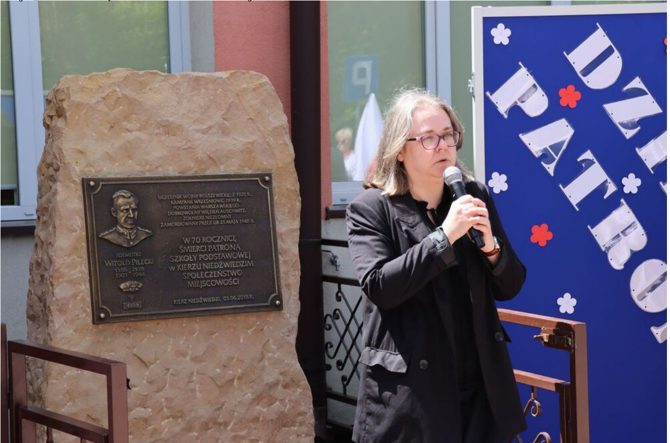
Akcja „Znicze Pamięci” w Szkole Podstawowej w Kierzu Niedźwiedzim.