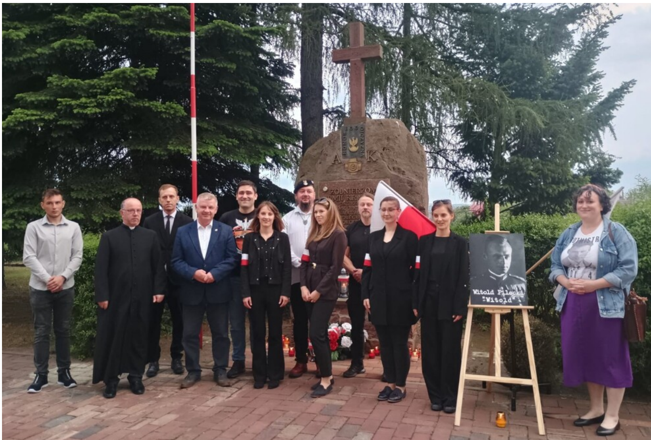
„Światło dla Rotmistrza” w Ostrowcu Świętokrzyskim.