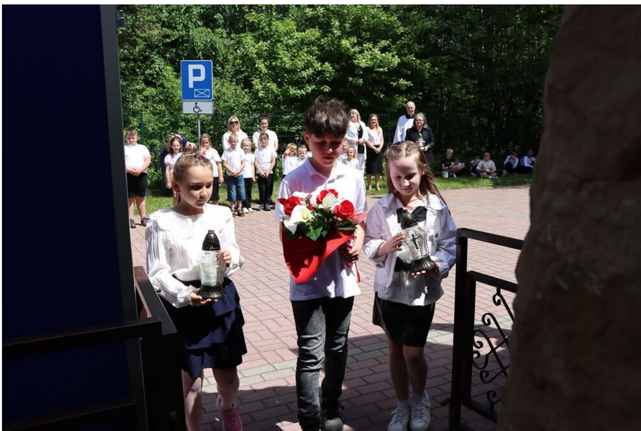
Akcja „Znicze Pamięci” w Szkole Podstawowej w Kierzu Niedźwiedzim.

Rtm. Witold Pilecki to obrońca Polski w 1920 i 1939 roku, który dobrowolnie trafił do Auschwitz, by organizować tam ruch oporu, a po ucieczce z obozu walczył w Powstaniu Warszawskim. W 1947 roku aresztowany i bestialsko torturowany przez komunistycznych funkcjonariuszy. O metodach stosowanych przez śledczych, powiedział w czasie jednego z widzeń z żoną: „Mnie tutaj wykończyli. Oświęcim to była igraszka...”.