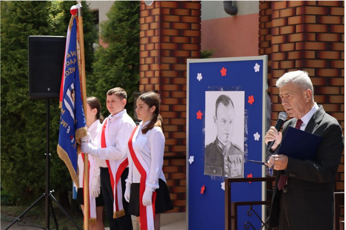
Akcja „Znicze Pamięci” w Szkole Podstawowej w Kierzu Niedźwiedzim.