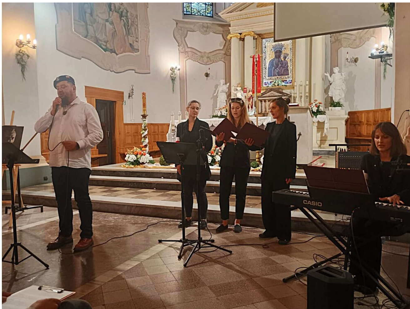
„Światło dla Rotmistrza” w Ostrowcu Świętokrzyskim.