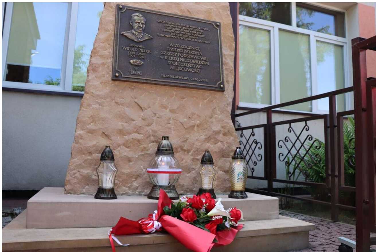
Akcja „Znicze Pamięci” w Szkole Podstawowej w Kierzu Niedźwiedzim.