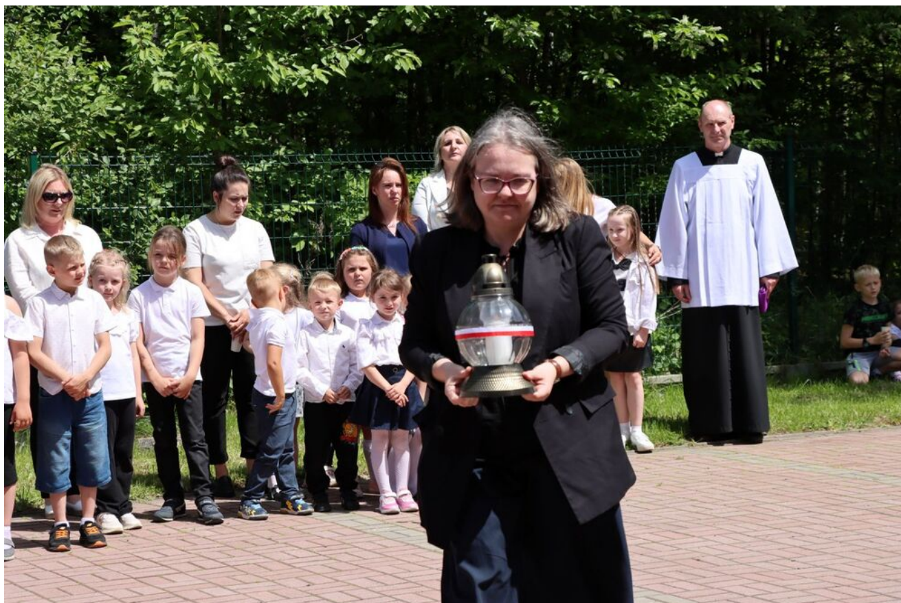
Akcja „Znicze Pamięci” w Szkole Podstawowej w Kierzu Niedźwiedzim.