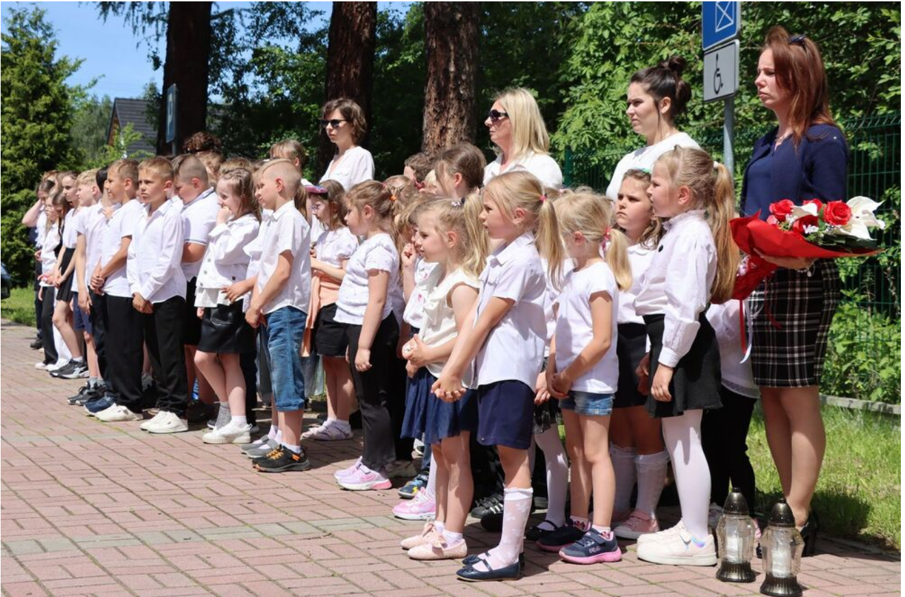
Akcja „Znicze Pamięci” w Szkole Podstawowej w Kierzu Niedźwiedzim.