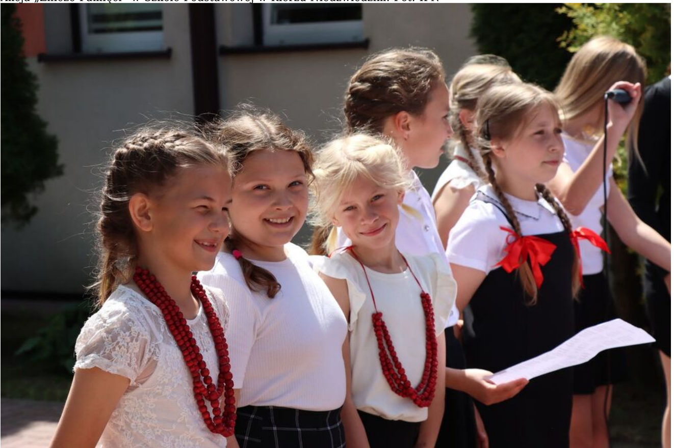
Akcja „Znicze Pamięci” w Szkole Podstawowej w Kierzu Niedźwiedzim.