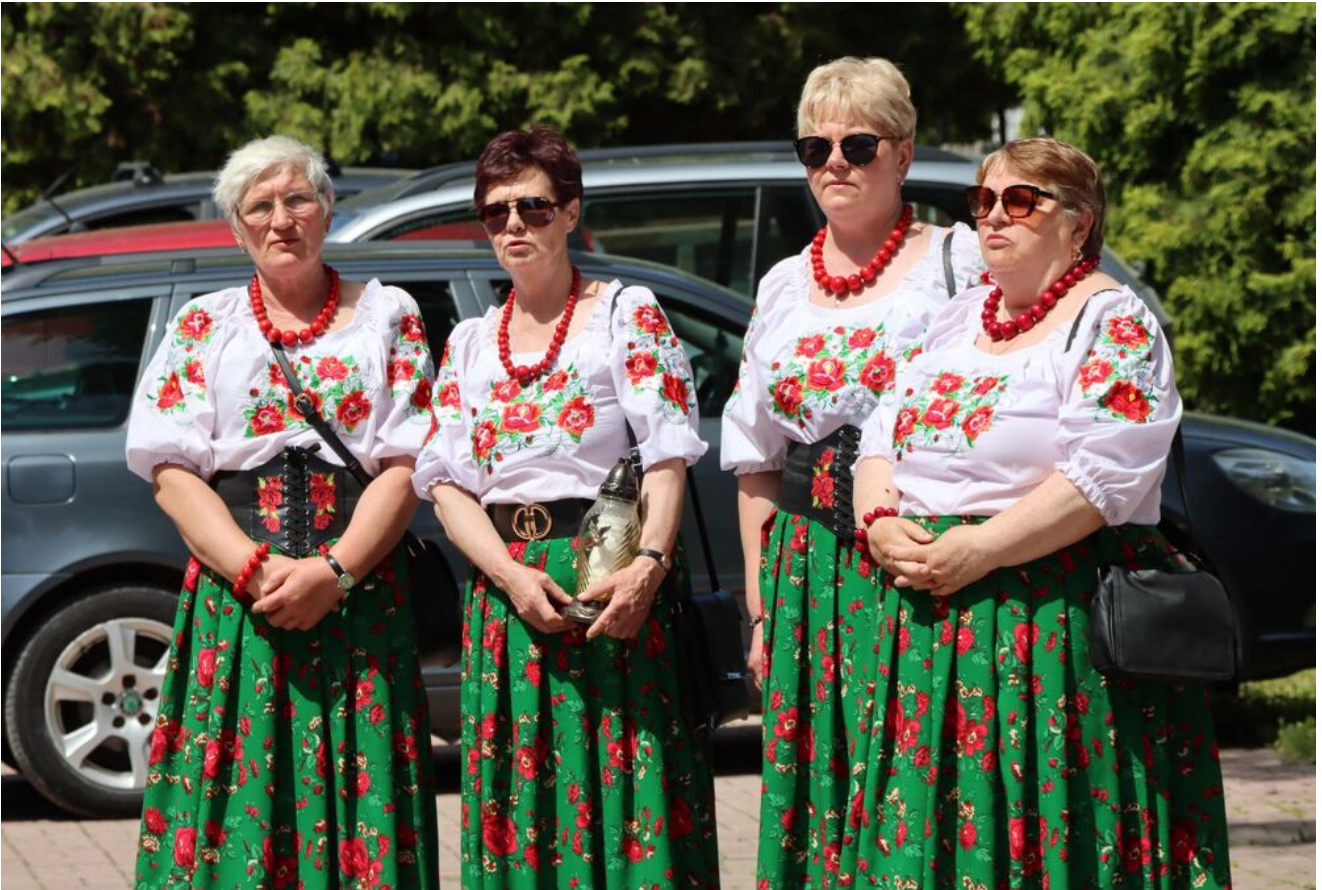
Akcja „Znicze Pamięci” w Szkole Podstawowej w Kierzu Niedźwiedzim.