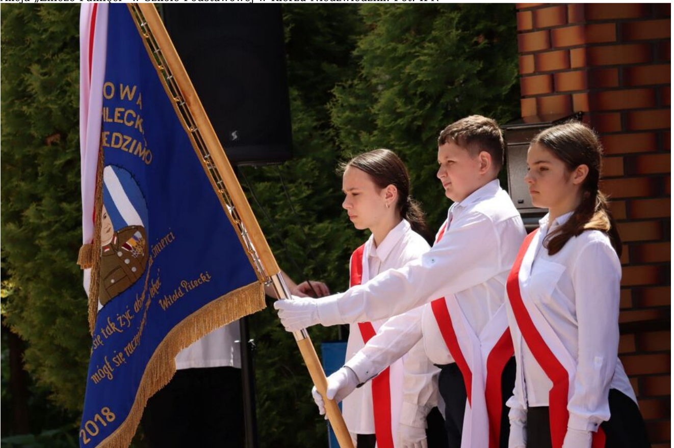
Akcja „Znicze Pamięci” w Szkole Podstawowej w Kierzu Niedźwiedzim.