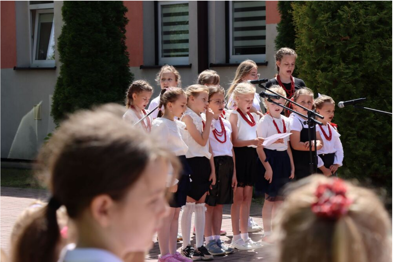
Akcja „Znicze Pamięci” w Szkole Podstawowej w Kierzu Niedźwiedzim.