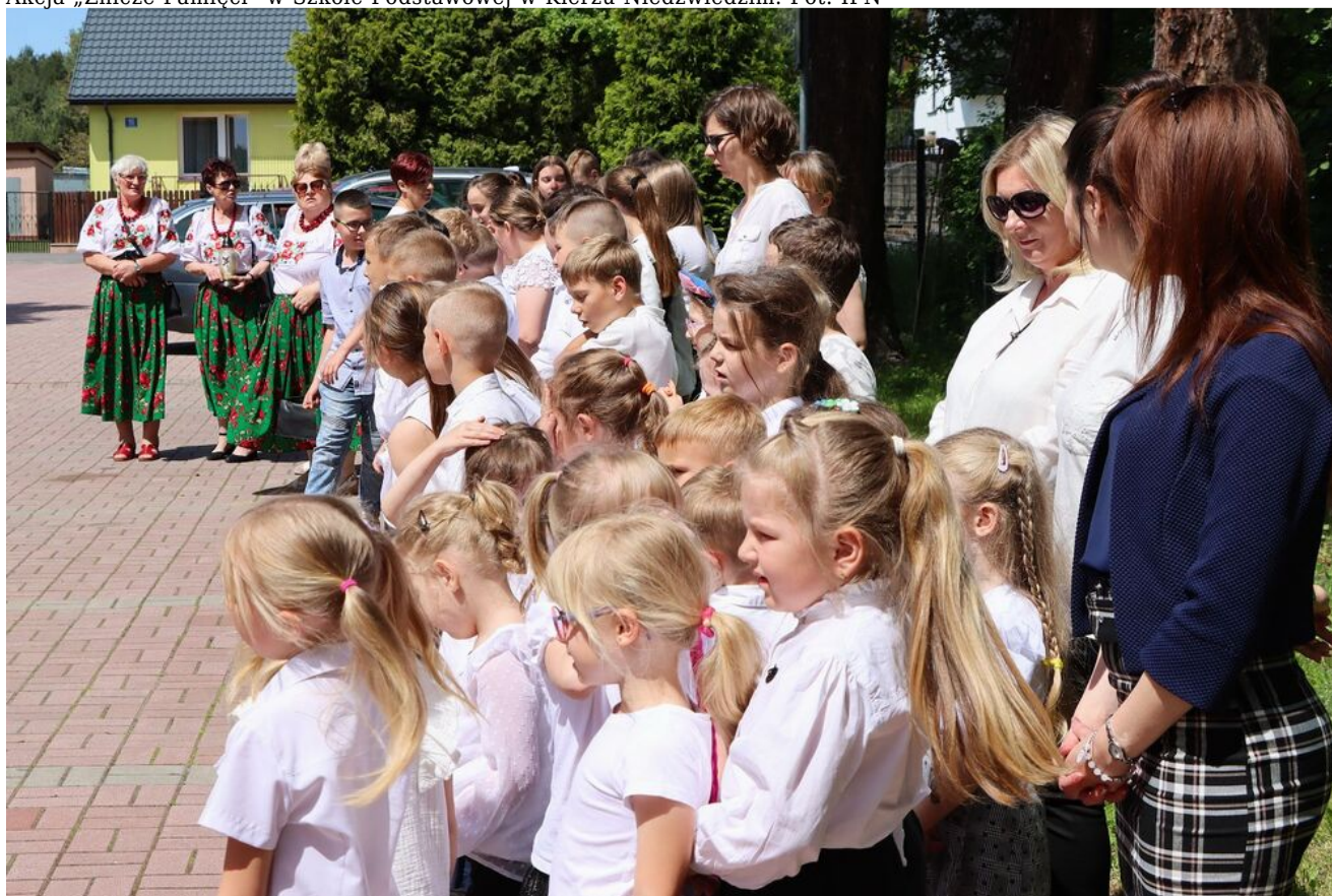
Akcja „Znicze Pamięci” w Szkole Podstawowej w Kierzu Niedźwiedzim.