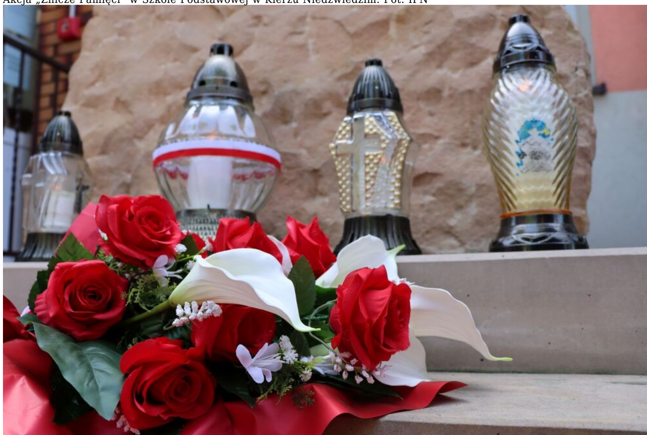
Akcja „Znicze Pamięci” w Szkole Podstawowej w Kierzu Niedźwiedzim.