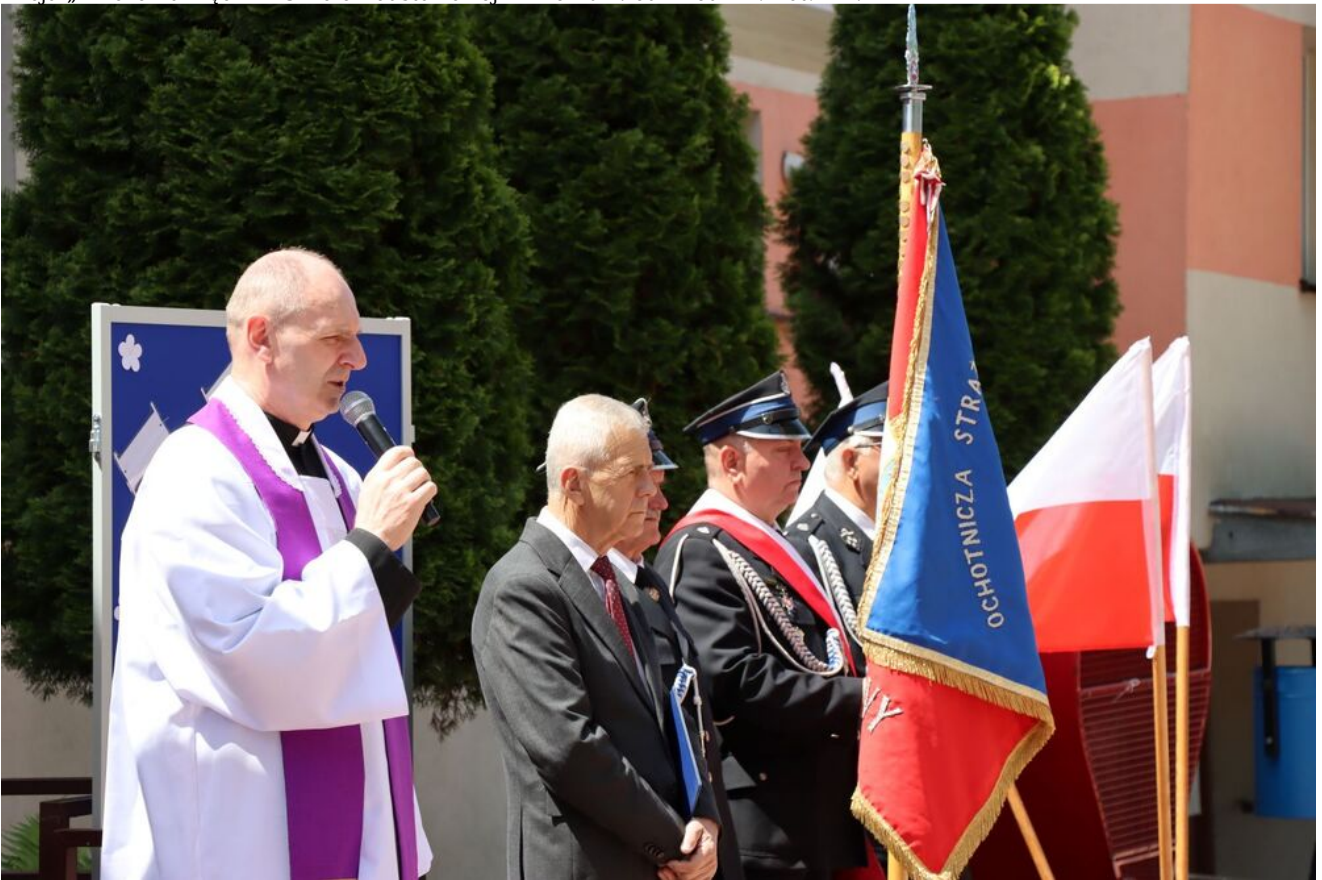
Akcja „Znicze Pamięci” w Szkole Podstawowej w Kierzu Niedźwiedzim.