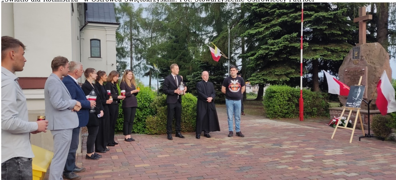
„Światło dla Rotmistrza” w Ostrowcu Świętokrzyskim.