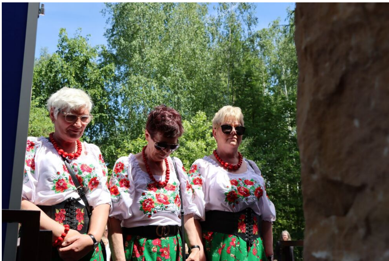
Akcja „Znicze Pamięci” w Szkole Podstawowej w Kierzu Niedźwiedzim.