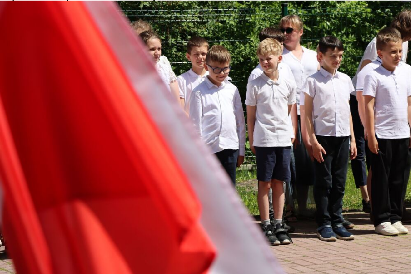
Akcja „Znicze Pamięci” w Szkole Podstawowej w Kierzu Niedźwiedzim.