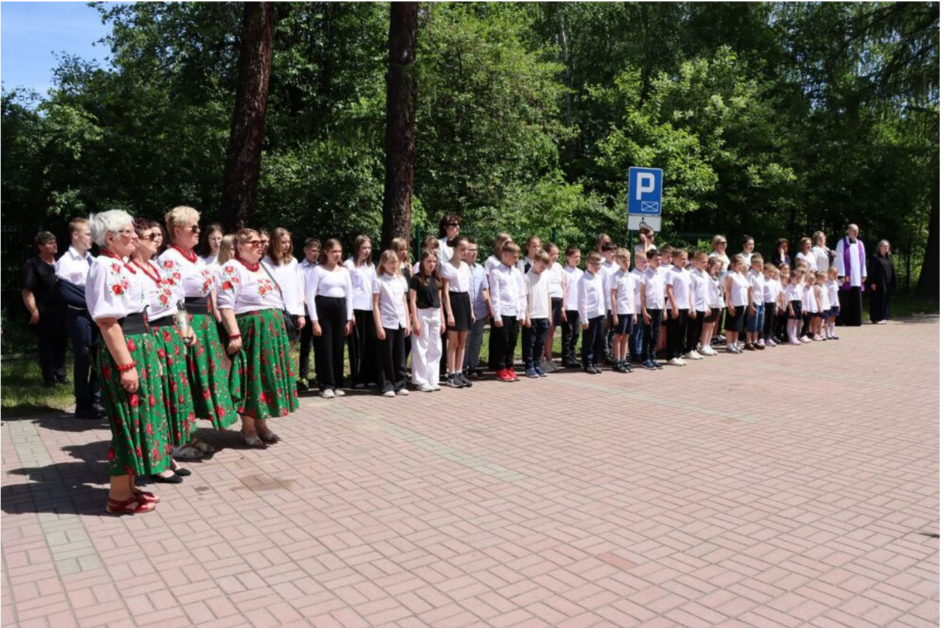
Akcja „Znicze Pamięci” w Szkole Podstawowej w Kierzu Niedźwiedzim.