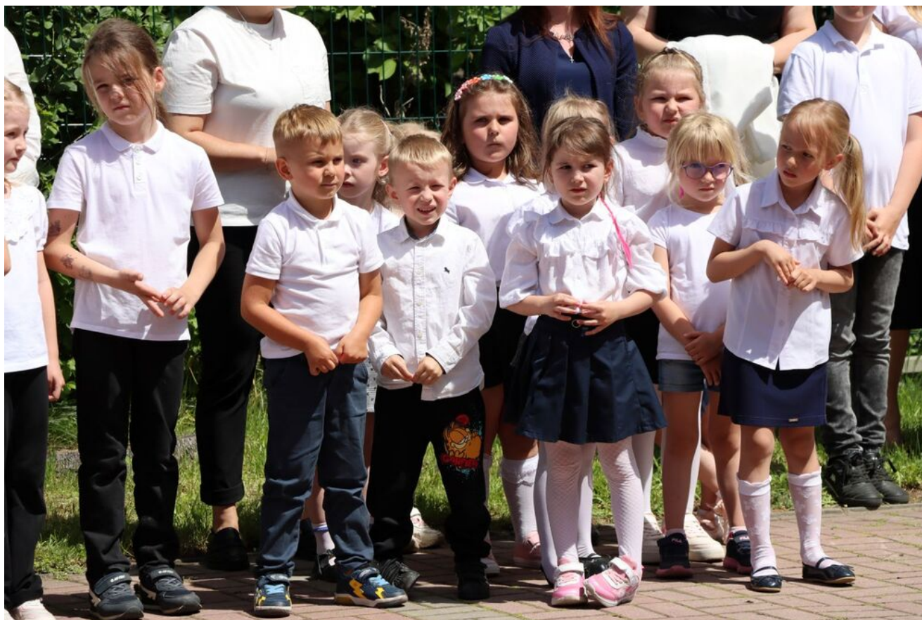
Akcja „Znicze Pamięci” w Szkole Podstawowej w Kierzu Niedźwiedzim.

25 maja 1948 r., o godz. 21.30, w więzieniu mokotowskim w Warszawie, po brutalnym śledztwie, strzałem w tył głowy wykonano wyrok śmierci na rotmistrzu Witoldzie Pileckim. Do dziś nie wiadomo, gdzie zostało pochowanego jego ciało.