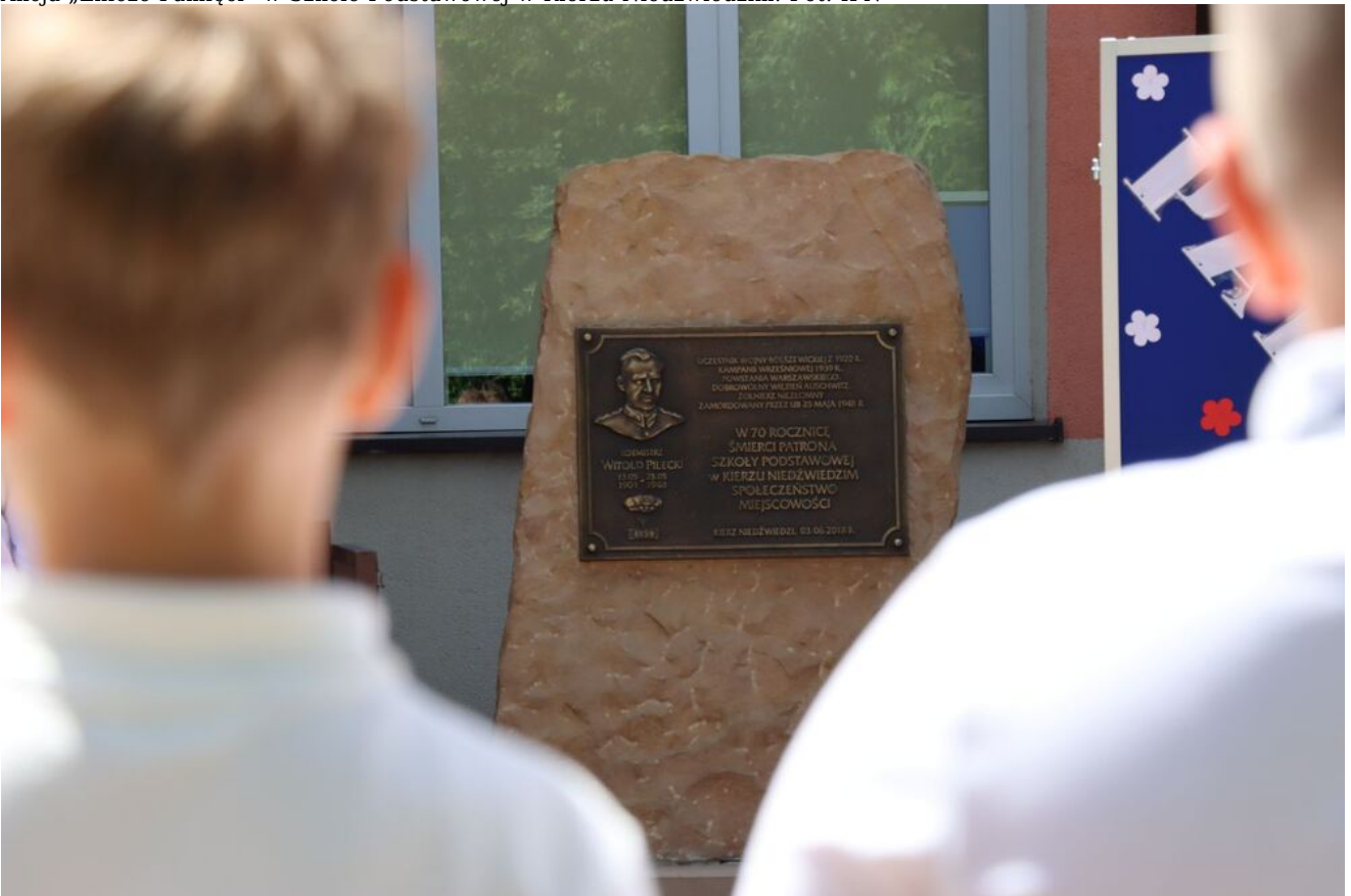
Akcja „Znicze Pamięci” w Szkole Podstawowej w Kierzu Niedźwiedzim.