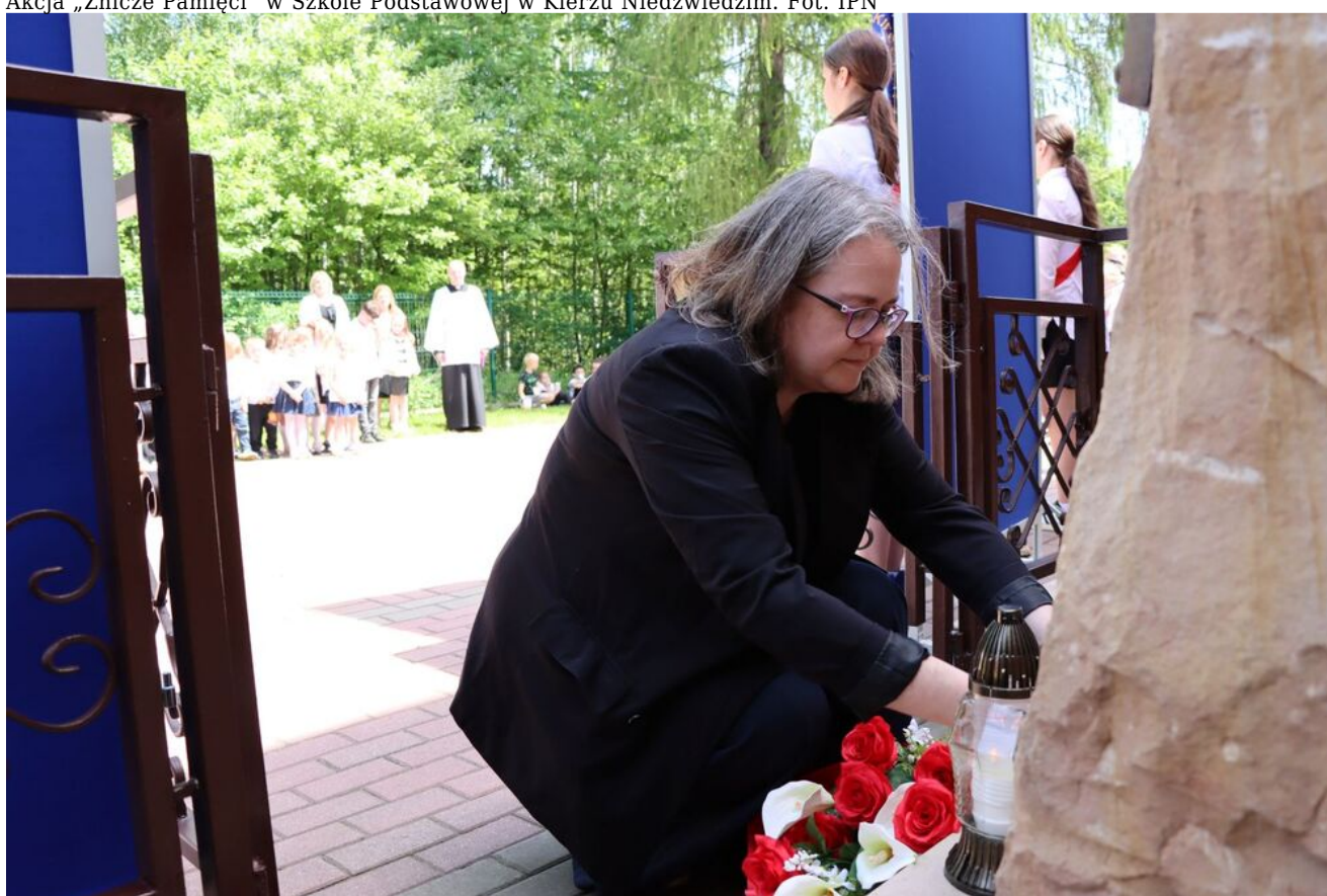
Akcja „Znicze Pamięci” w Szkole Podstawowej w Kierzu Niedźwiedzim.