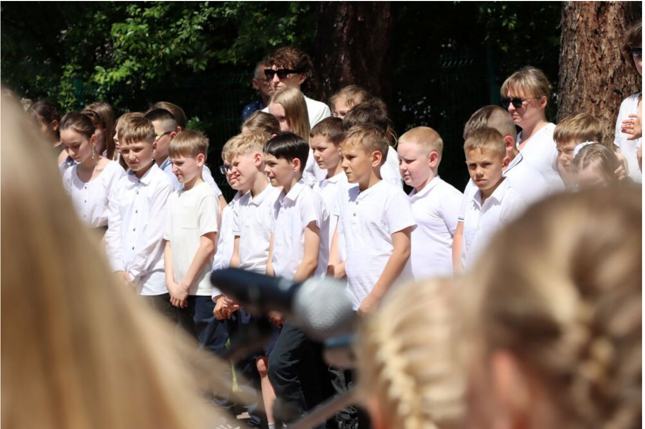
Akcja „Znicze Pamięci” w Szkole Podstawowej w Kierzu Niedźwiedzim.