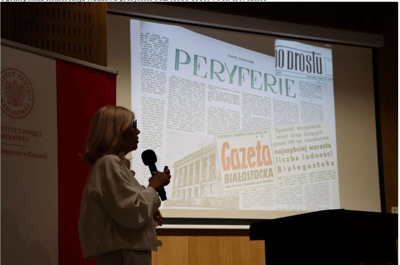
Ogólnopolska Konferencja Naukowa „Peryferie PRL (1956-1980)”.