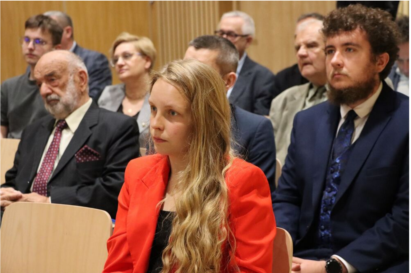
Ogólnopolska Konferencja Naukowa „Peryferie PRL (1956-1980)”.