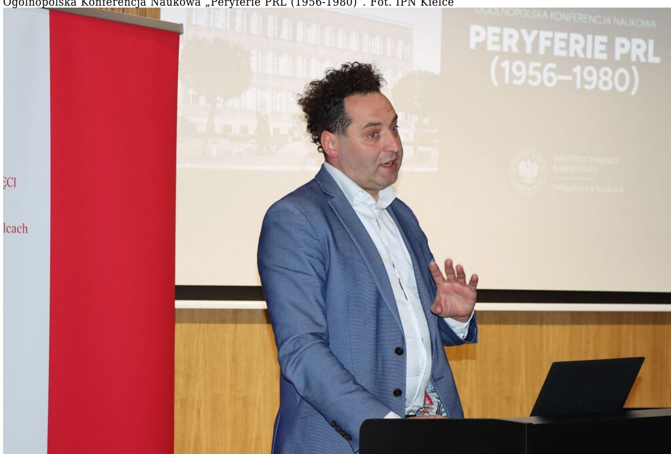
Ogólnopolska Konferencja Naukowa „Peryferie PRL (1956-1980)”.