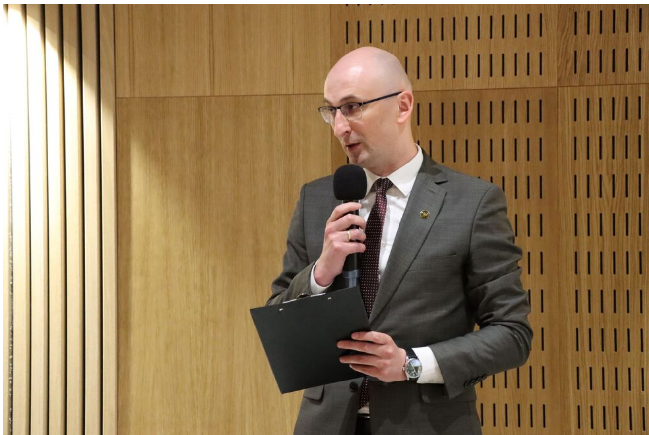
Ogólnopolska Konferencja Naukowa „Peryferie PRL (1956-1980)”.