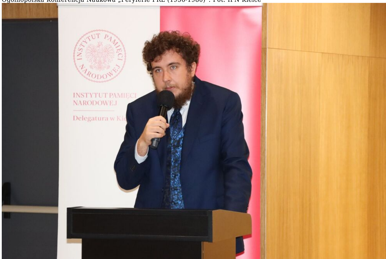
Ogólnopolska Konferencja Naukowa „Peryferie PRL (1956-1980)”.