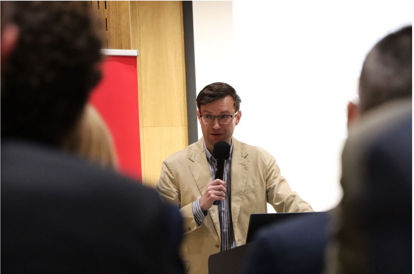
Ogólnopolska Konferencja Naukowa „Peryferie PRL (1956-1980)”.