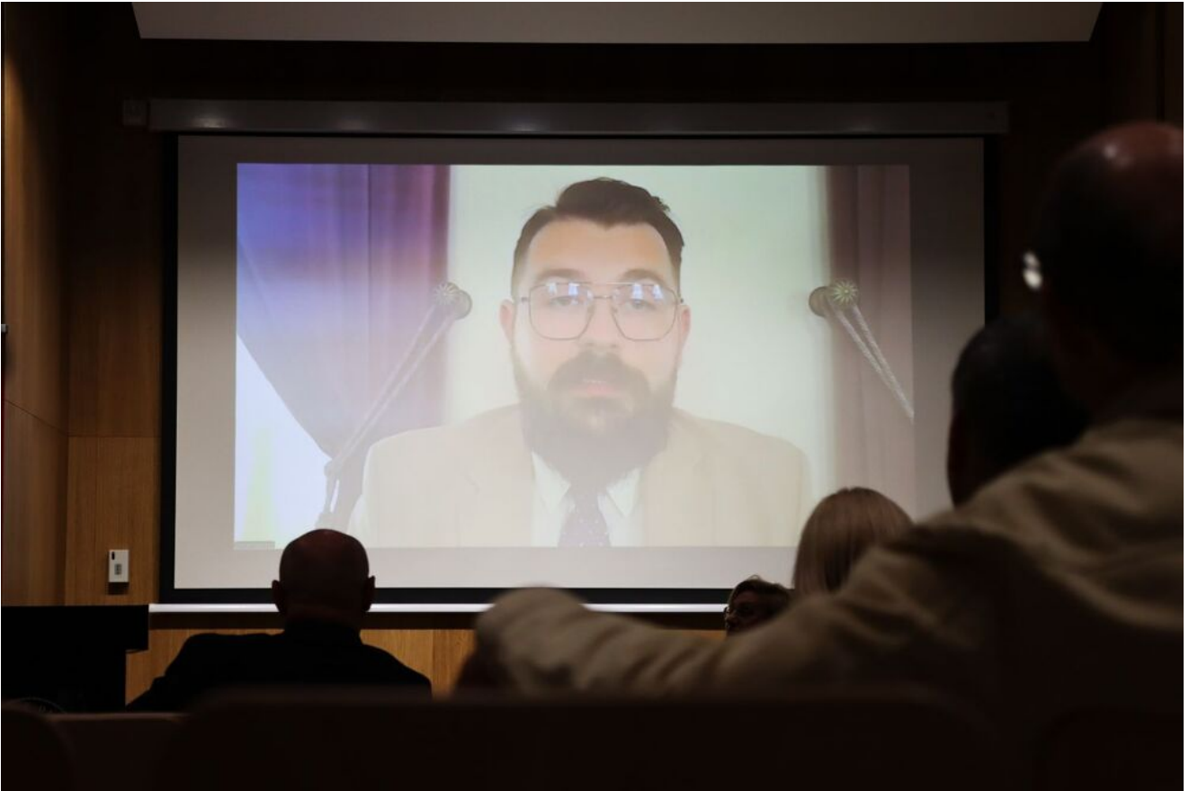
Ogólnopolska Konferencja Naukowa „Peryferie PRL (1956-1980)”.