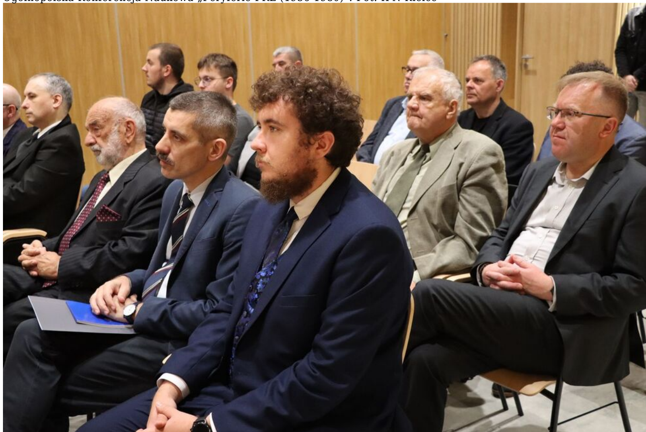
Ogólnopolska Konferencja Naukowa „Peryferie PRL (1956-1980)”.