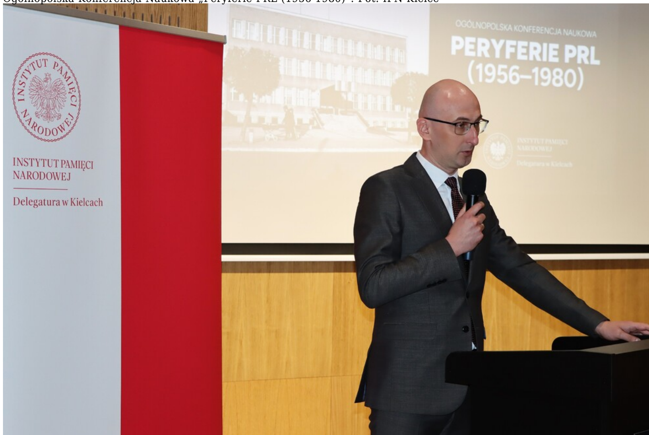
Ogólnopolska Konferencja Naukowa „Peryferie PRL (1956-1980)”.