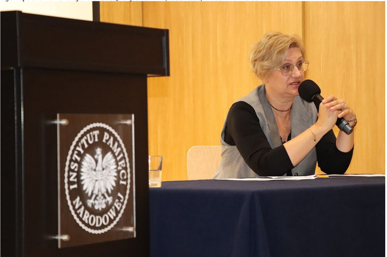
Ogólnopolska Konferencja Naukowa „Peryferie PRL (1956-1980)”.