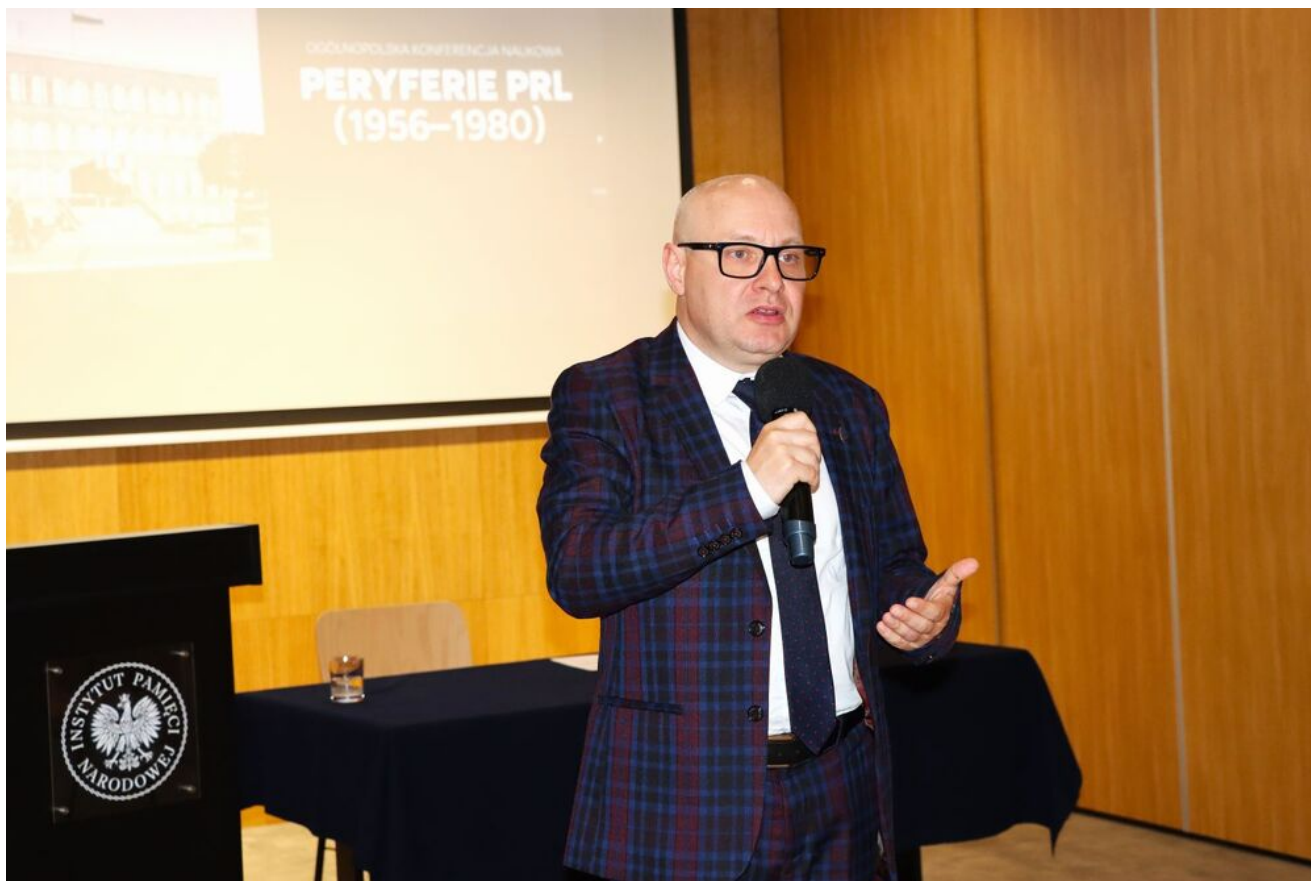
Ogólnopolska Konferencja Naukowa „Peryferie PRL (1956-1980)”.