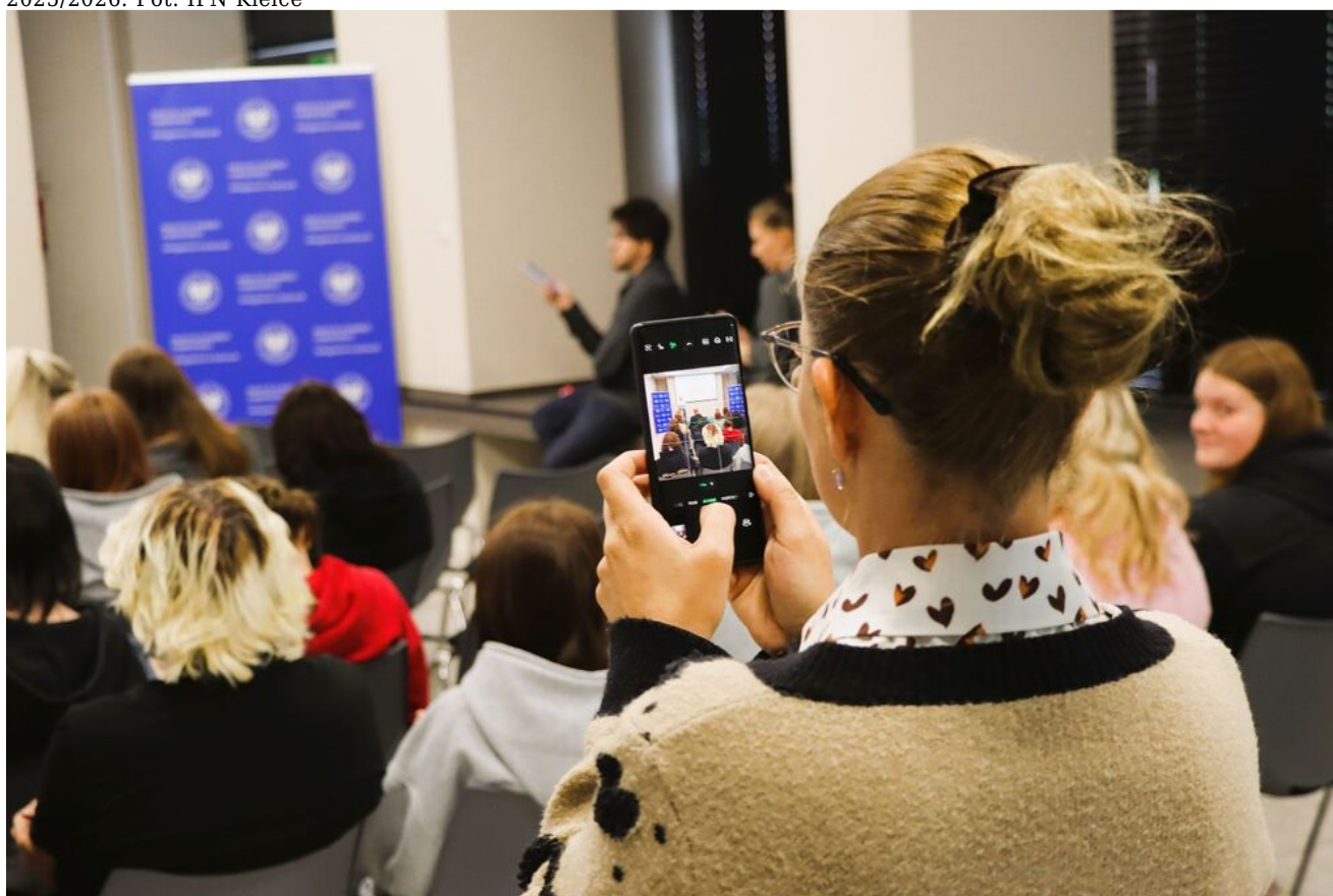
Konferencja prasowa. Podsumowanie współpracy ze środowiskiem świętokrzyskich nauczycieli i uczniów w roku szkolnym 2025/2026.