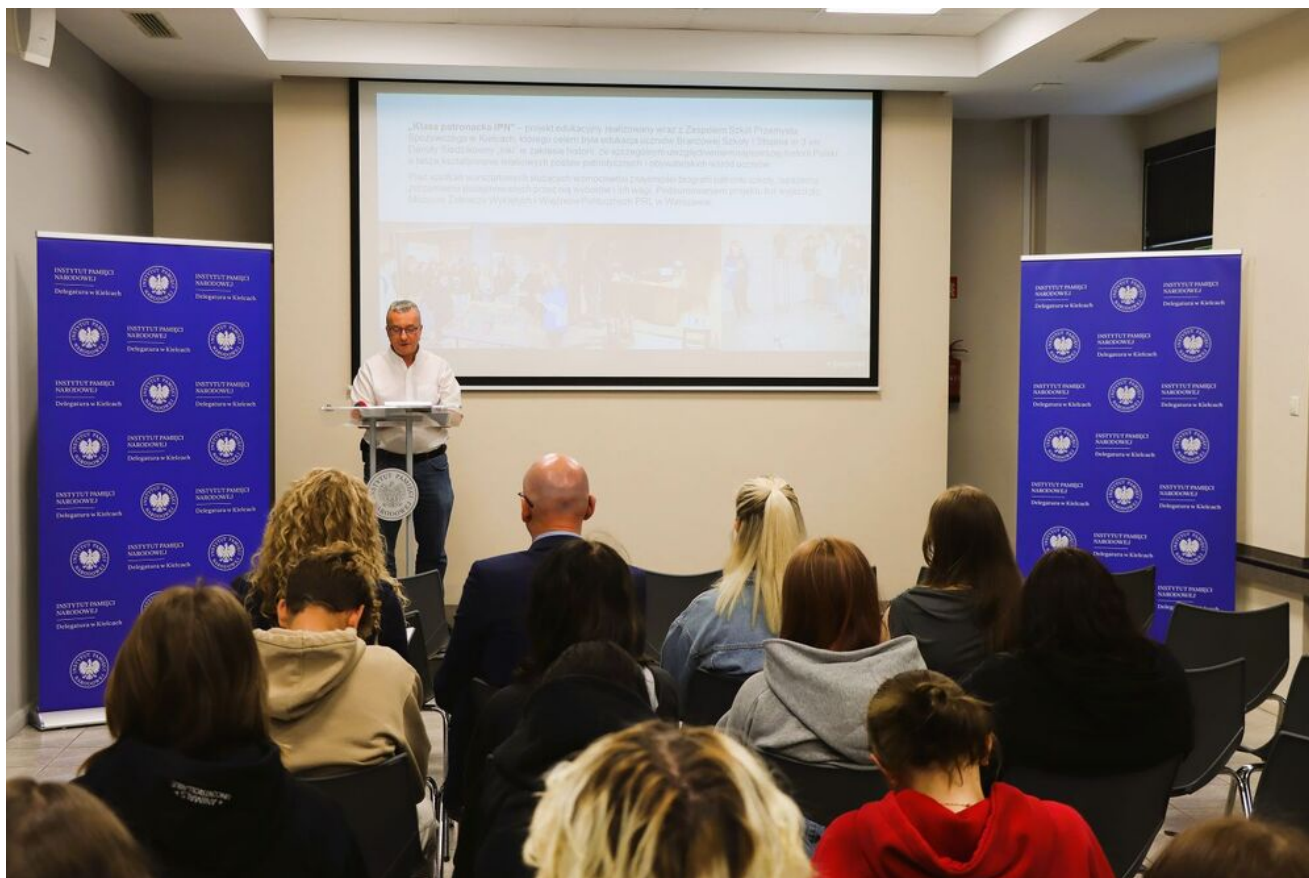
Konferencja prasowa. Podsumowanie współpracy ze środowiskiem świętokrzyskich nauczycieli i uczniów w roku szkolnym 2025/2026.