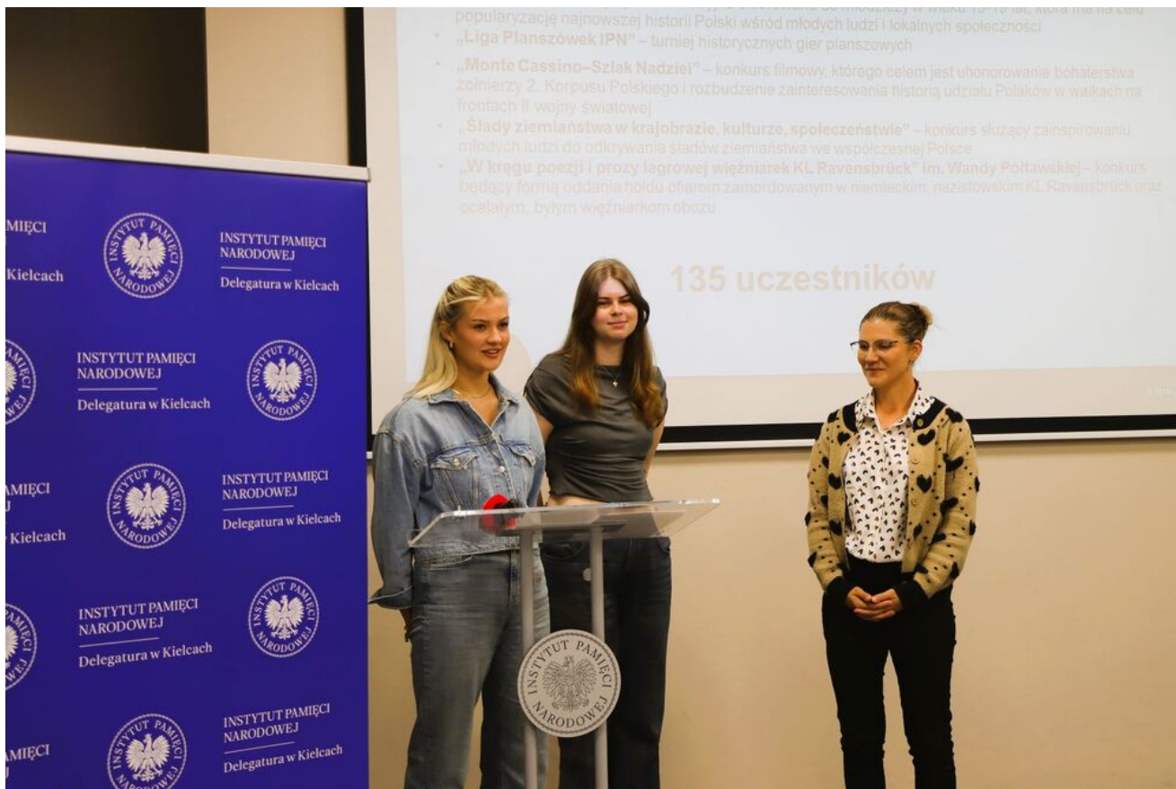
Konferencja prasowa. Podsumowanie współpracy ze środowiskiem świętokrzyskich nauczycieli i uczniów w roku szkolnym 2025/2026.