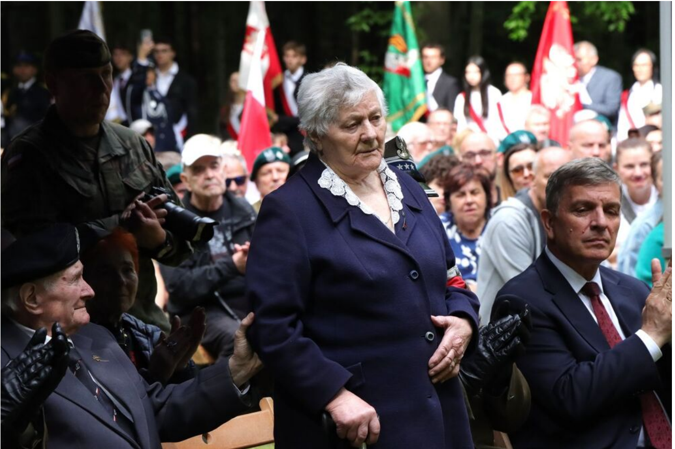
Uroczystości na Wykusie.