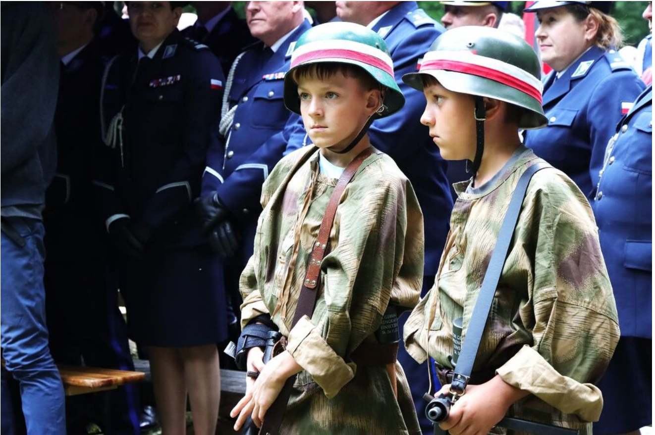
Uroczystości na Wykusie.