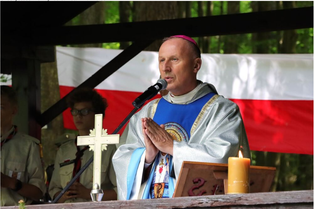
Uroczystości na Wykusie.