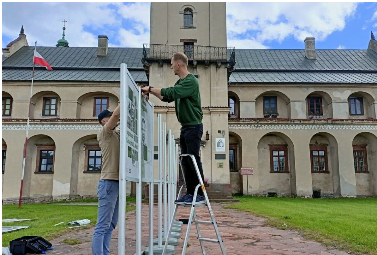
Uroczystości na Wykusie.

O historii Jana Piwnika „Ponurego” i Eugeniusza Kaszyńskiego „Nurta” opowiadały też dwie wystawy, przygotowane przez historyków w Instytucie Pamięci Narodowej.