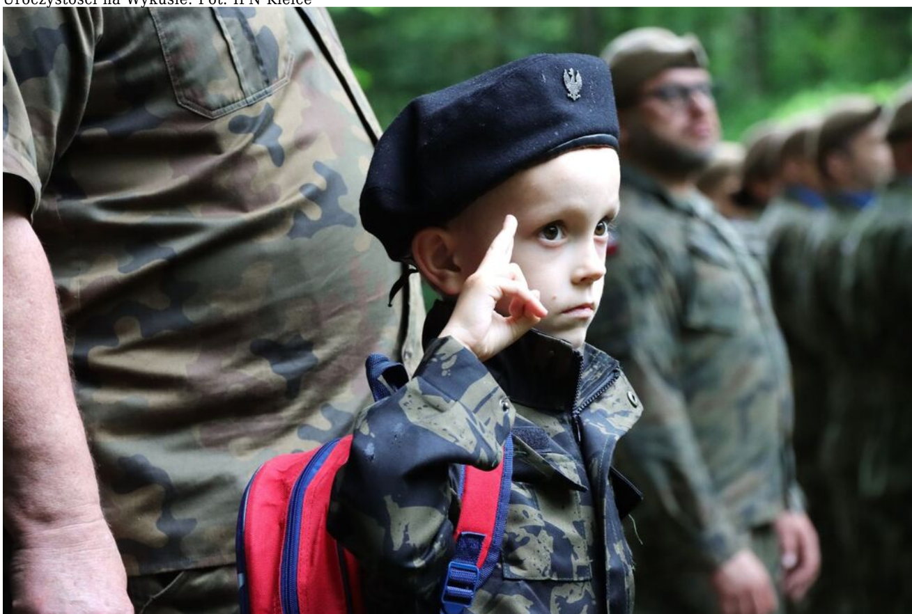
Uroczystości na Wykusie.

Ostatnim dniem uroczystości była niedziela, 14 czerwca. W opactwie cystersów w Wąchocku odbyła się msza święta w intencji płk. Jana Piwnika i Jego Żołnierzy. Po nabożeństwie zaplanowano defiladę pod pomnikiem płk. „Ponurego”.