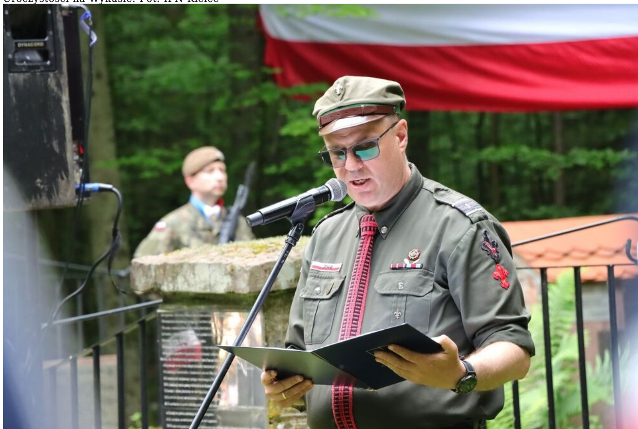
Uroczystości na Wykusie.