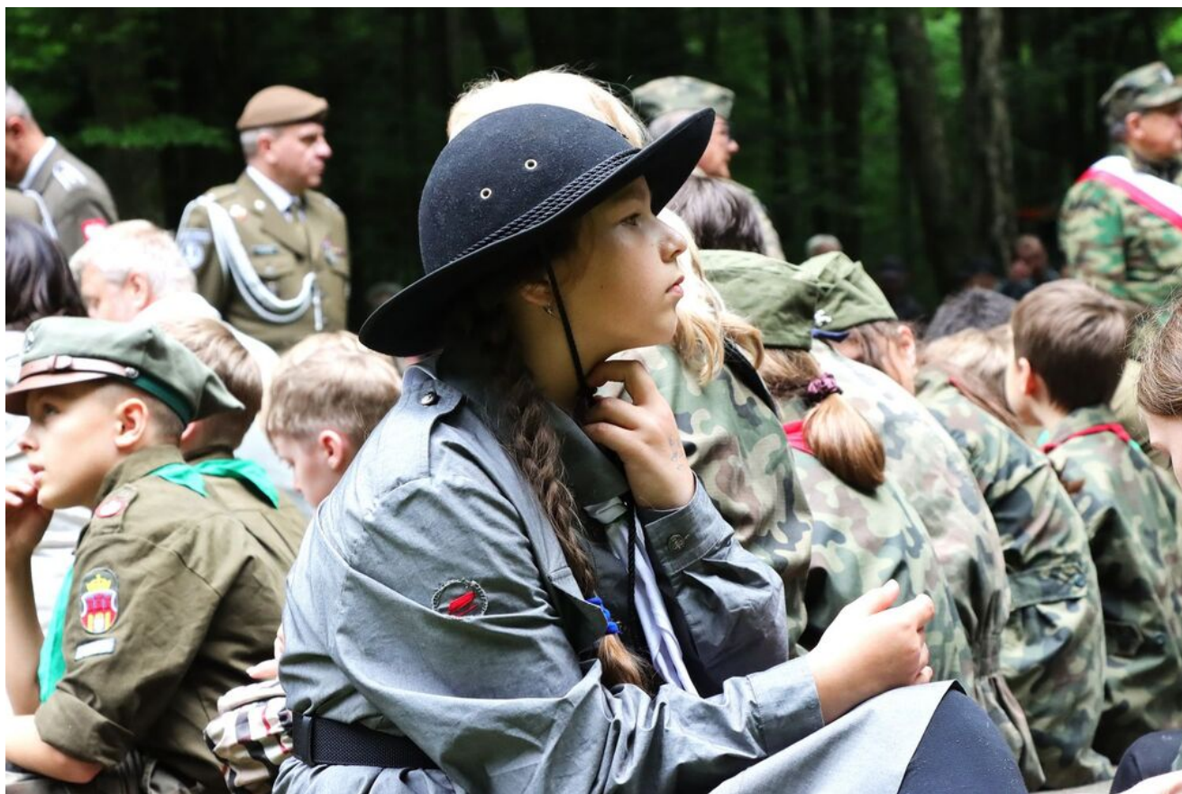
Uroczystości na Wykusie.