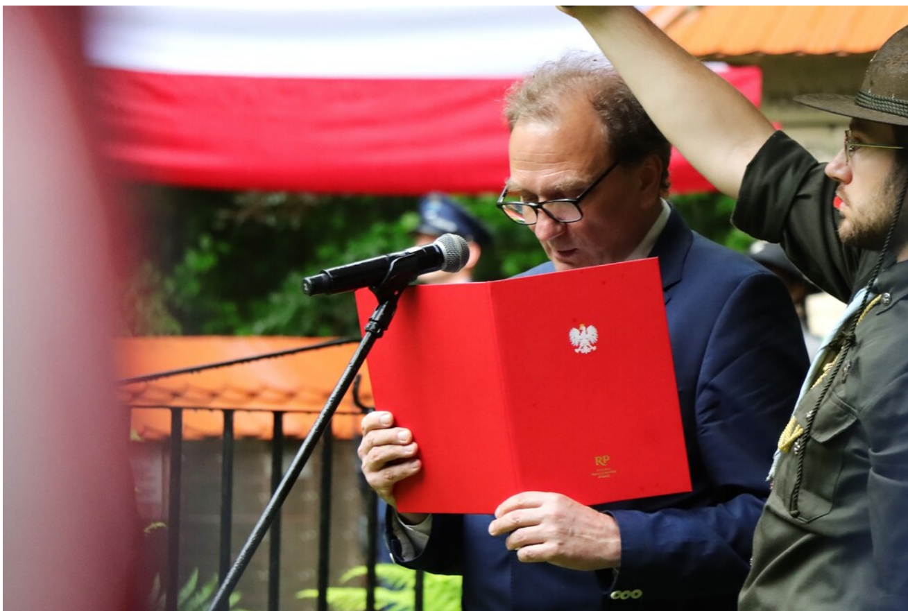
Uroczystości na Wykusie.