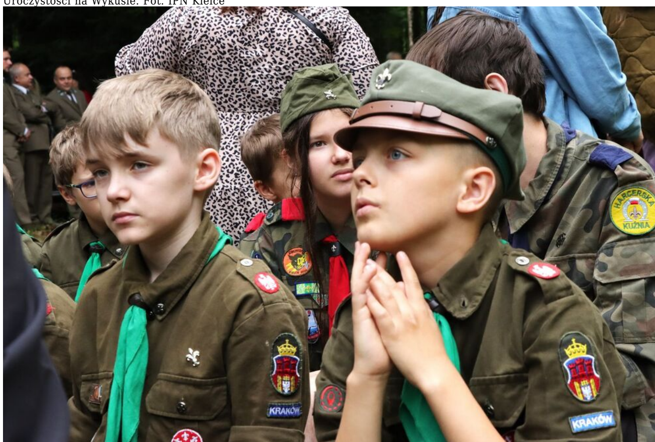
Uroczystości na Wykusie.