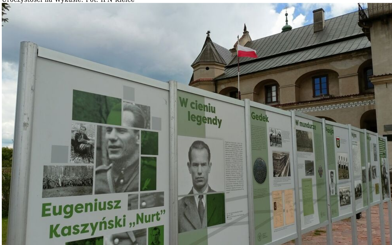
Uroczystości na Wykusie.