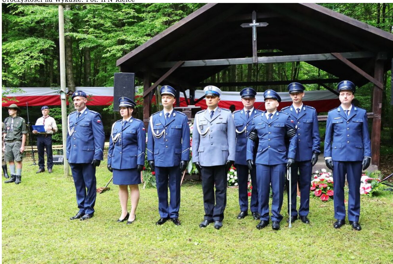
Uroczystości na Wykusie.