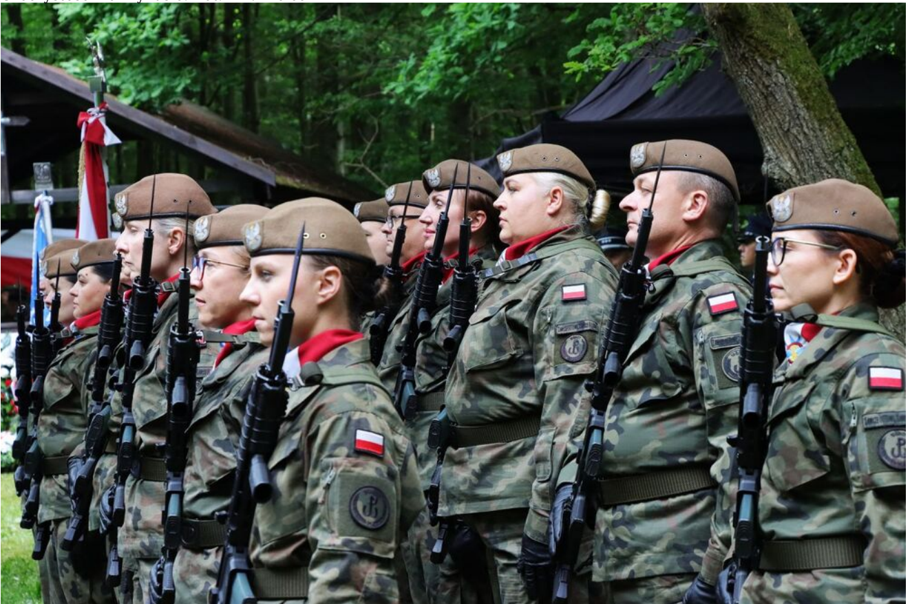
Uroczystości na Wykusie.