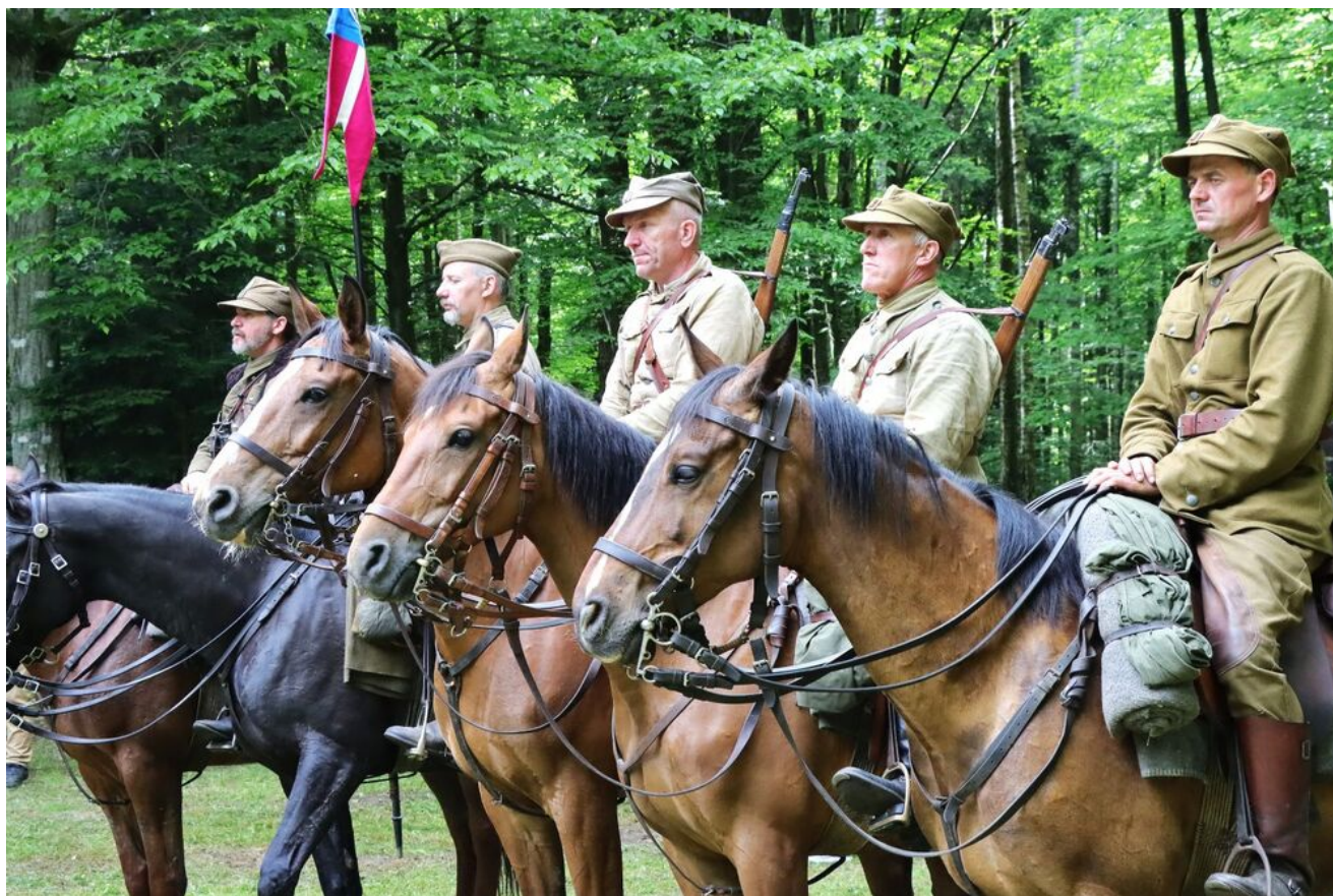
Uroczystości na Wykusie.