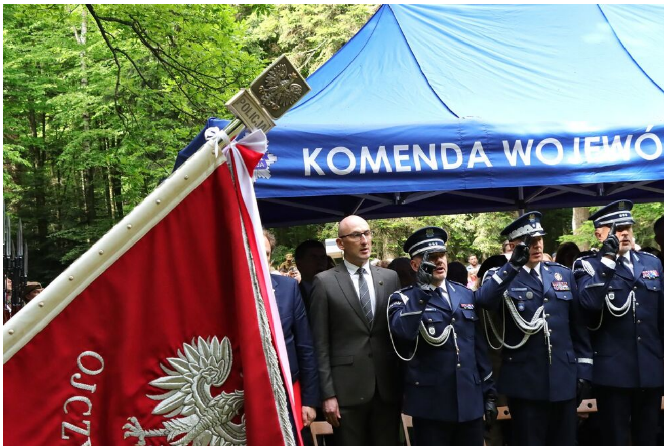
Uroczystości na Wykusie.