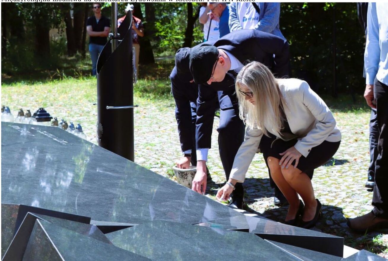
Międzyreligijna modlitwa na Cmentarzu Żydowskim w Kielcach.

Uroczystości upamiętniające 80. rocznicę pogromu ludności żydowskiej w Kielcach rozpoczęły się w piątek, już o godz. 12.00, międzyreligijną modlitwą na Cmentarzu Żydowskim. Zaprosili na nią wspólnie Stowarzyszenie im. Jana Karłowicza oraz Polska Rada Chrześcijan i Żydów. Po odczytaniu tekstów psalmów przez przedstawicieli m.in. kościoła katolickiego i ewangelicko-reformowanego,