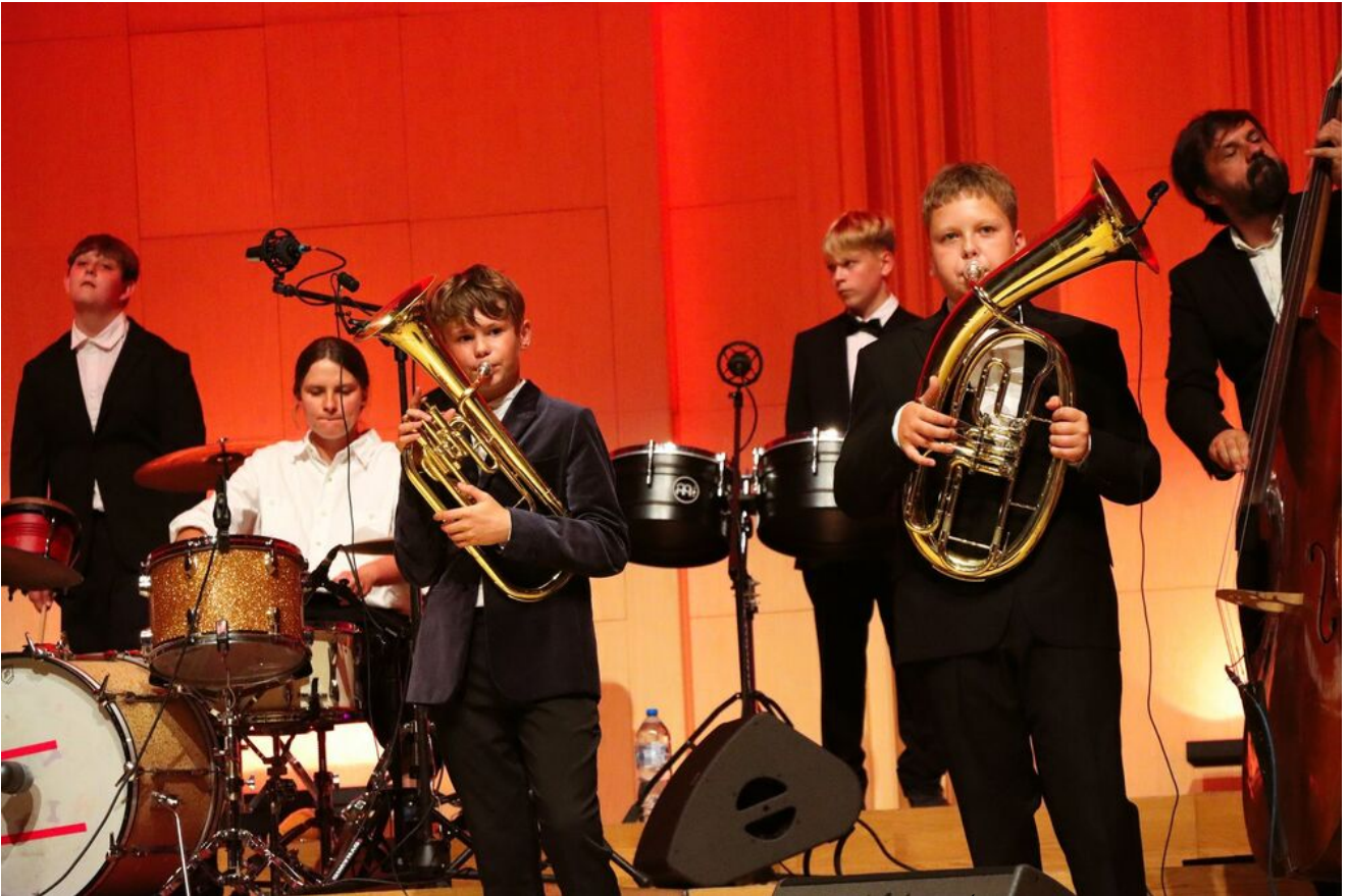
„Wieczór pamięci Żydów zamordowanych w Kielcach w lipcu 1946 roku” w Filharmonii Świętokrzyskiej.