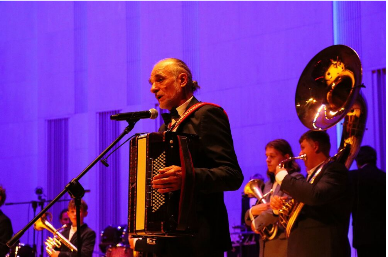
„Wieczór pamięci Żydów zamordowanych w Kielcach w lipcu 1946 roku” w Filharmonii Świętokrzyskiej.