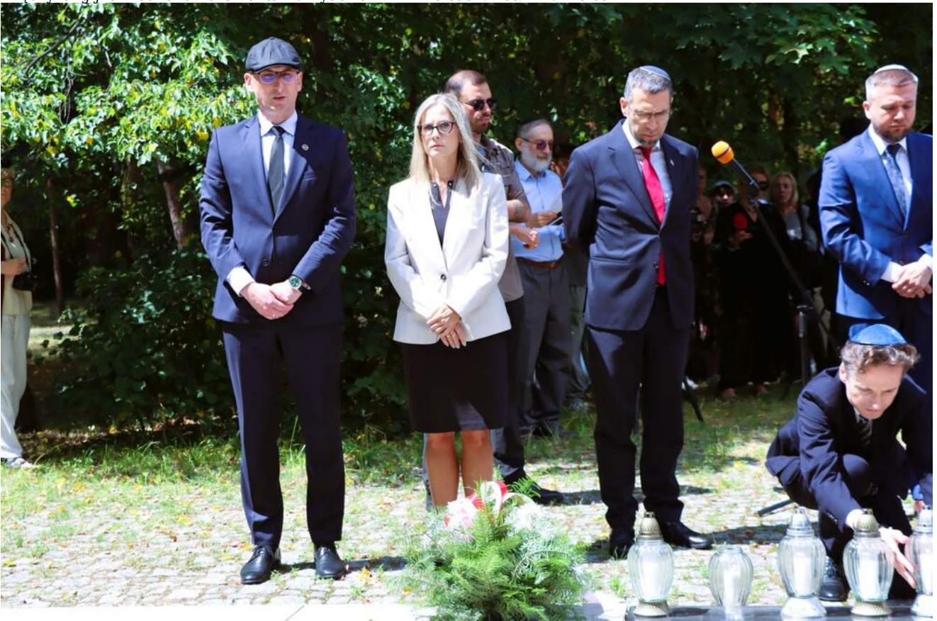
Międzyreligijna modlitwa na Cmentarzu Żydowskim w Kielcach.