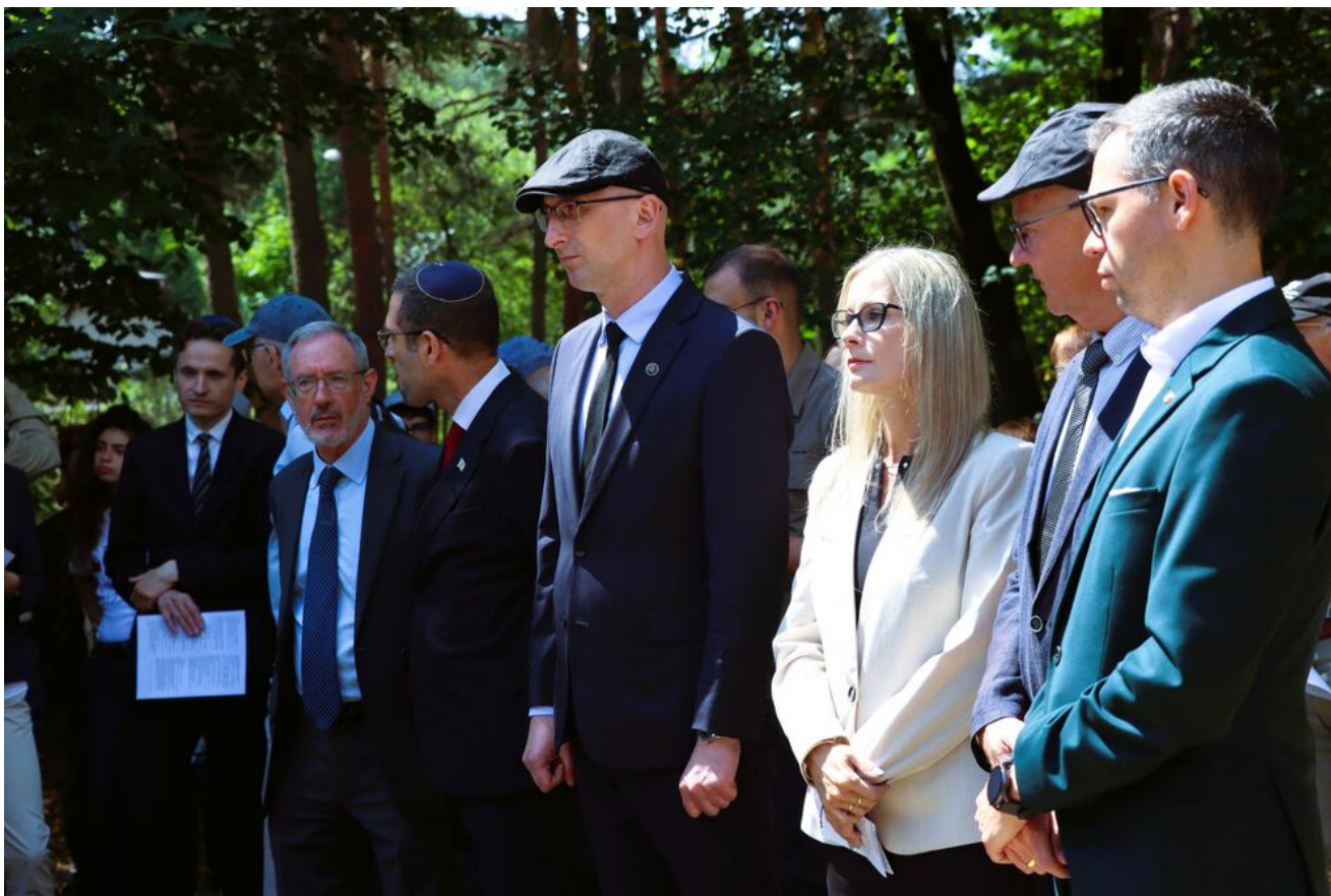
Międzyreligijna modlitwa na Cmentarzu Żydowskim w Kielcach.

Organizatorem wydarzenia była Delegatura IPN w Kielcach.