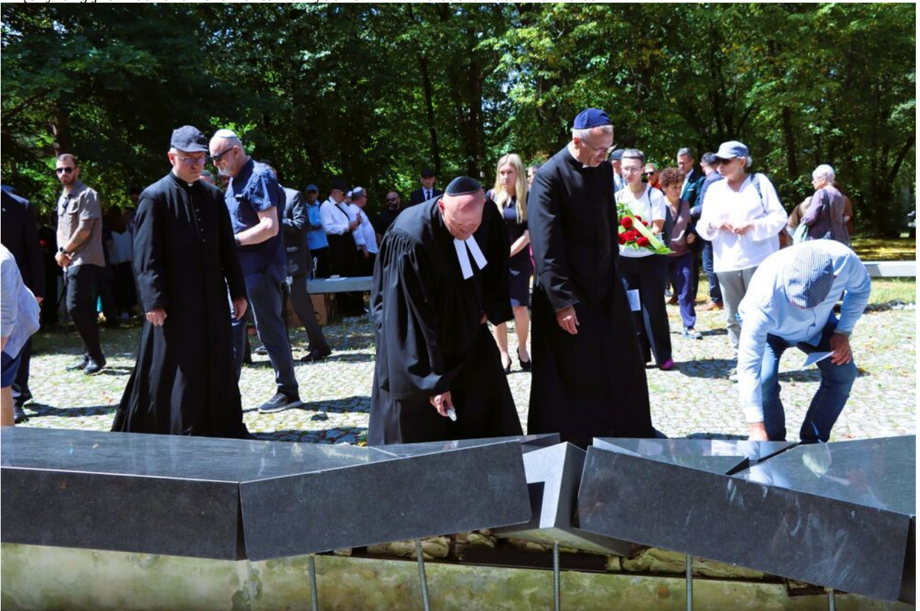
Międzyreligijna modlitwa na Cmentarzu Żydowskim w Kielcach.