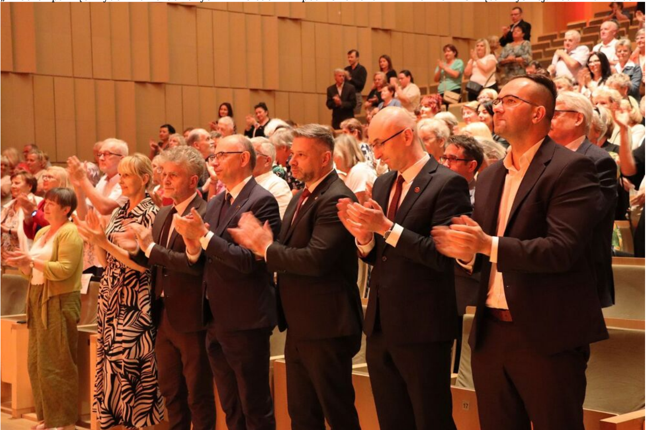
„Wieczór pamięci Żydów zamordowanych w Kielcach w lipcu 1946 roku” w Filharmonii Świętokrzyskiej.