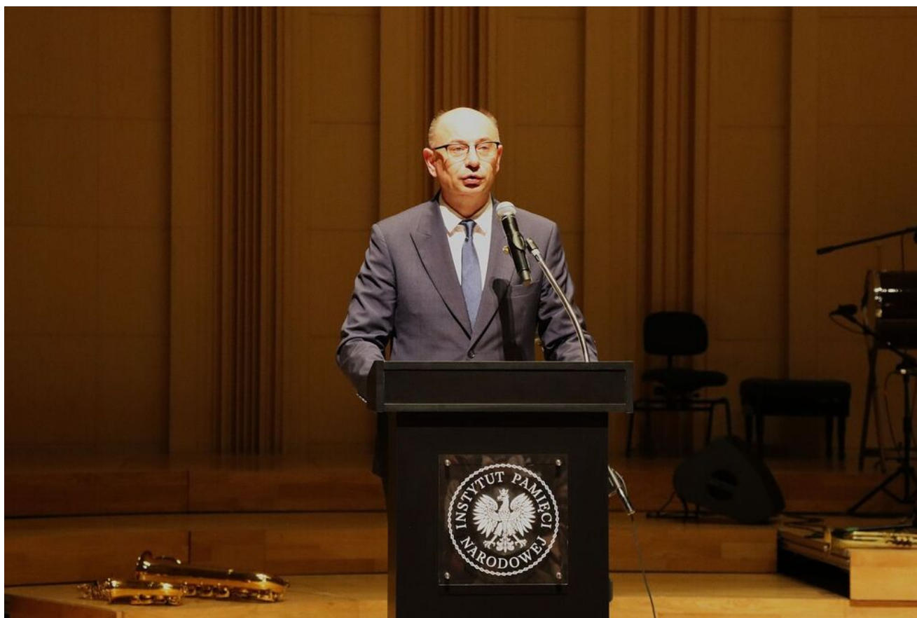
„Wieczór pamięci Żydów zamordowanych w Kielcach w lipcu 1946 roku” w Filharmonii Świętokrzyskiej.

- 4 lipca 1946 roku w Kielcach doszło do rozruchów, w wyniku których zostało zamordowanych kilkadziesiąt osób narodowości żydowskiej. Dzisiaj szerzej rozumiemy kontekst tych zbrodni. Rozumieć nie znaczy jednak usprawiedliwiać. Tłum podburzyła fałszywa plotka o rzekomym porwaniu ośmioletniego Henryka Błaszczyka przez Żydów i przetrzymywaniu go, wraz z innymi polskimi dziećmi, w piwnicy budynku przy ulicy Planty 7/9. Ojciec chłopca złożył doniesienie na milicję, a sprawa szybko zatoczyła szerokie kręgi - relacjonował.