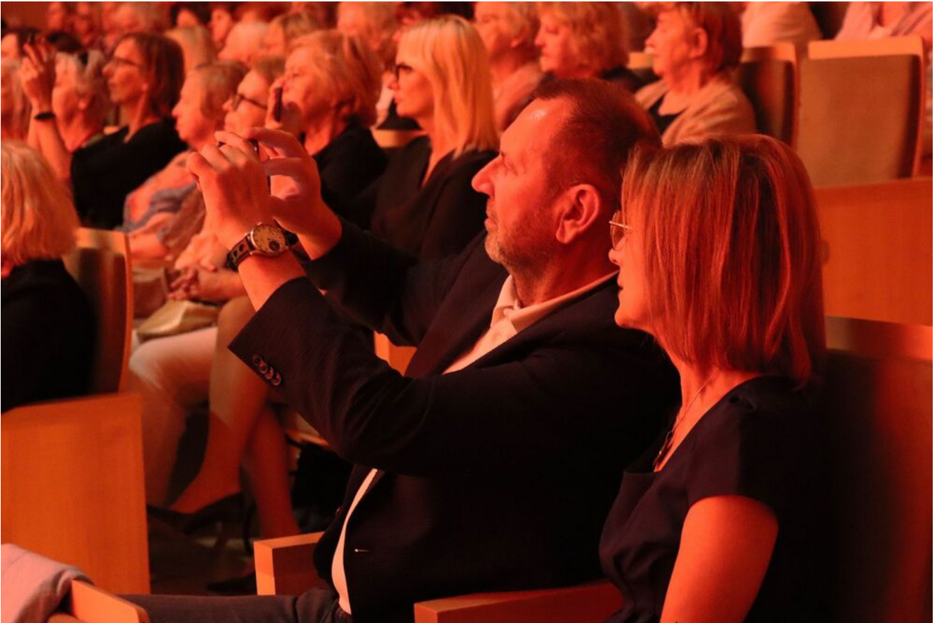
„Wieczór pamięci Żydów zamordowanych w Kielcach w lipcu 1946 roku” w Filharmonii Świętokrzyskiej.