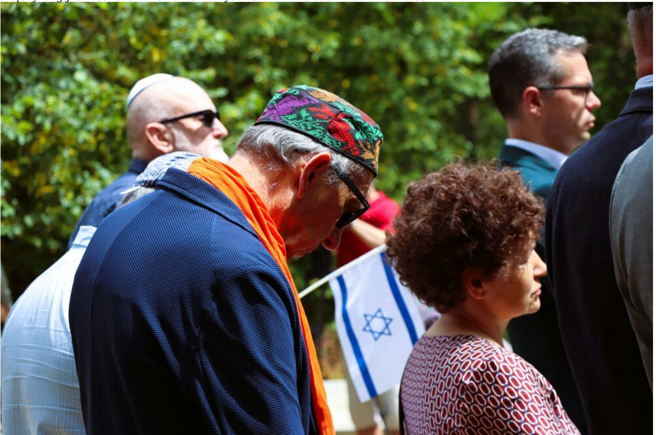
Międzyreligijna modlitwa na Cmentarzu Żydowskim w Kielcach.