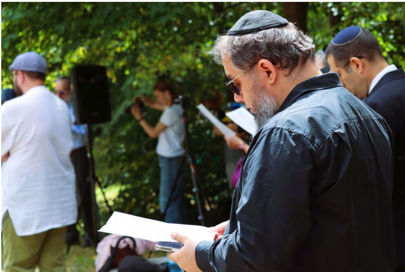
Międzyreligijna modlitwa na Cmentarzu Żydowskim w Kielcach.