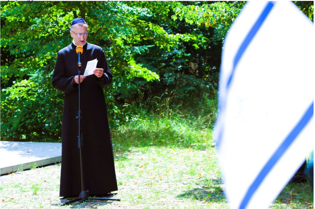
Międzyreligijna modlitwa na Cmentarzu Żydowskim w Kielcach.