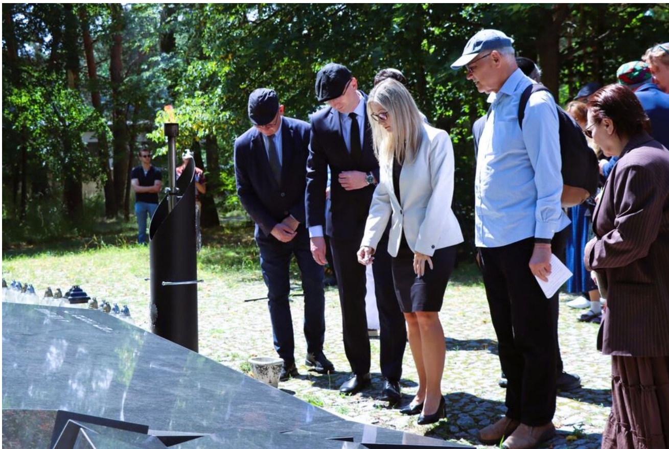
Międzyreligijna modlitwa na Cmentarzu Żydowskim w Kielcach.