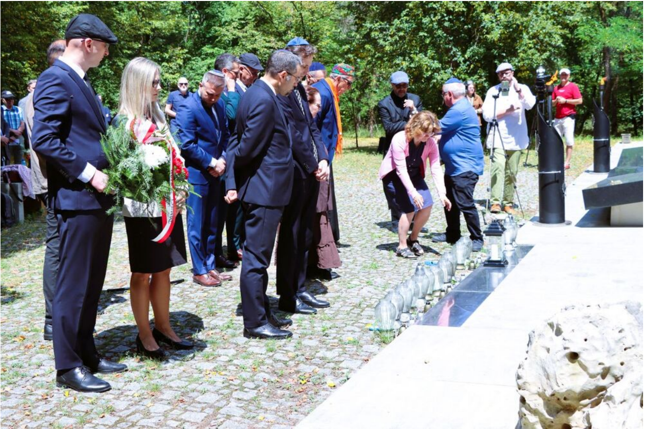
Międzyreligijna modlitwa na Cmentarzu Żydowskim w Kielcach.