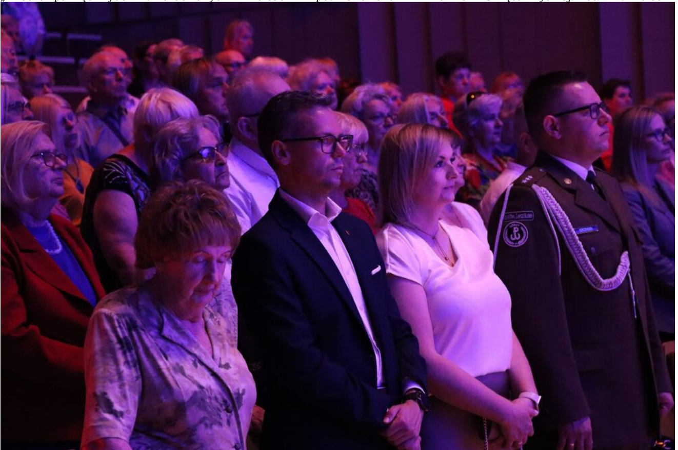
„Wieczór pamięci Żydów zamordowanych w Kielcach w lipcu 1946 roku” w Filharmonii Świętokrzyskiej.