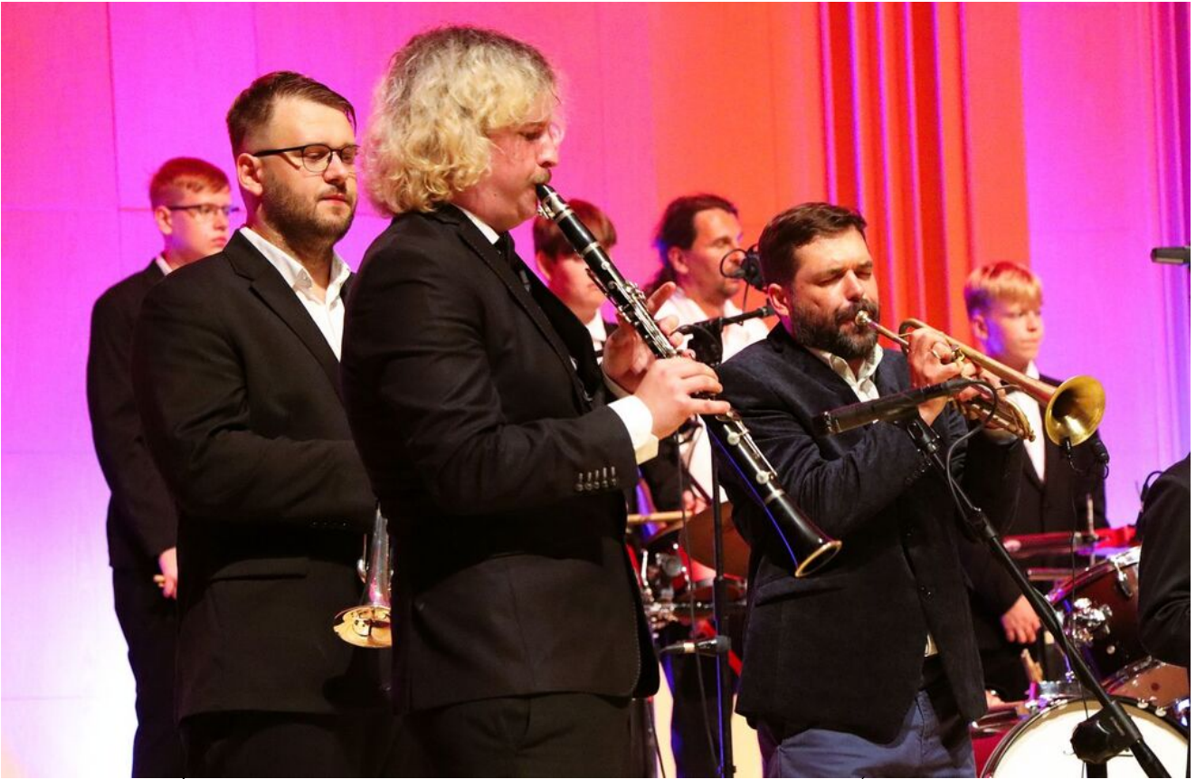
„Wieczór pamięci Żydów zamordowanych w Kielcach w lipcu 1946 roku” w Filharmonii Świętokrzyskiej.