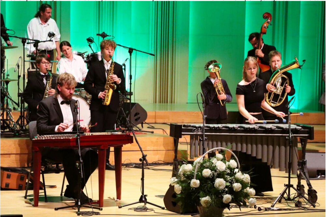
„Wieczór pamięci Żydów zamordowanych w Kielcach w lipcu 1946 roku” w Filharmonii Świętokrzyskiej.