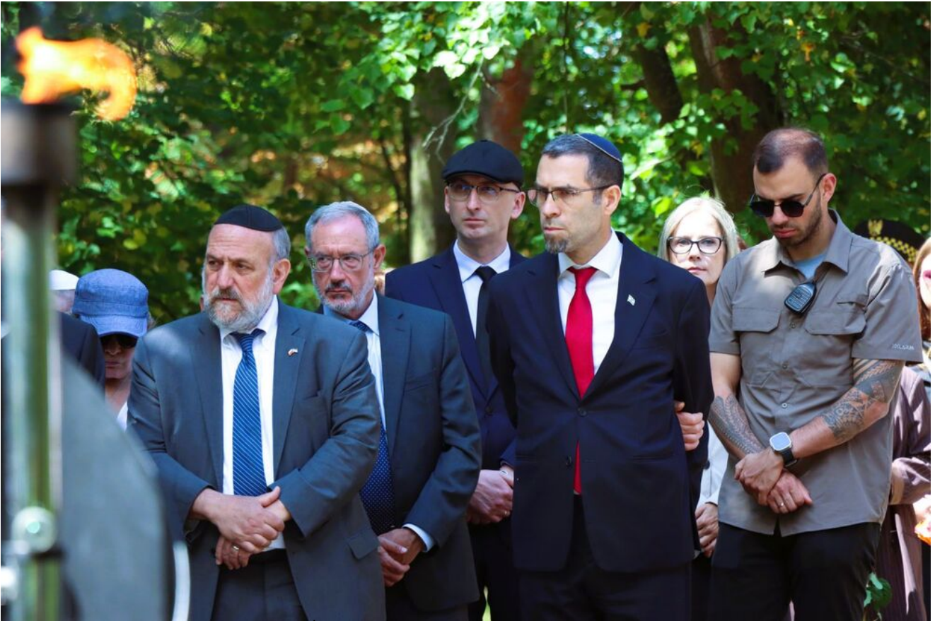
Międzyreligijna modlitwa na Cmentarzu Żydowskim w Kielcach.