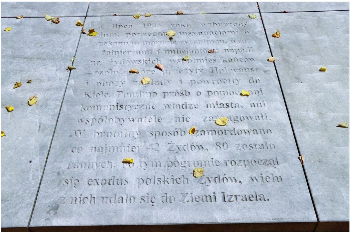
Międzyreligijna modlitwa na Cmentarzu Żydowskim w Kielcach.