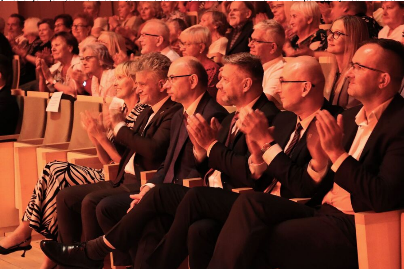
„Wieczór pamięci Żydów zamordowanych w Kielcach w lipcu 1946 roku” w Filharmonii Świętokrzyskiej.