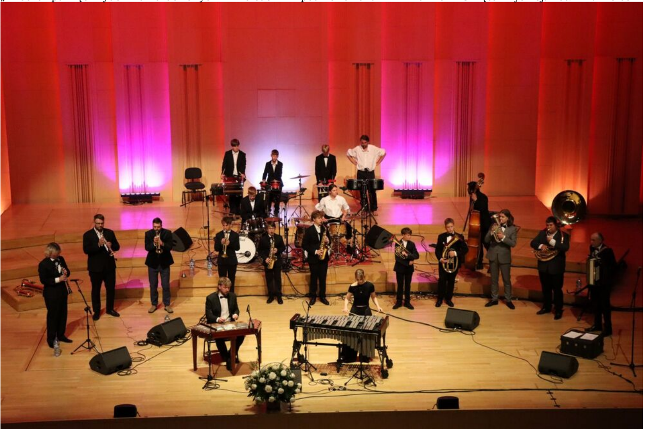
„Wieczór pamięci Żydów zamordowanych w Kielcach w lipcu 1946 roku” w Filharmonii Świętokrzyskiej.