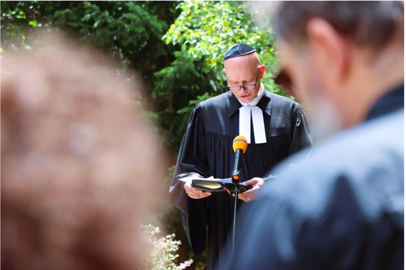
Międzyreligijna modlitwa na Cmentarzu Żydowskim w Kielcach.