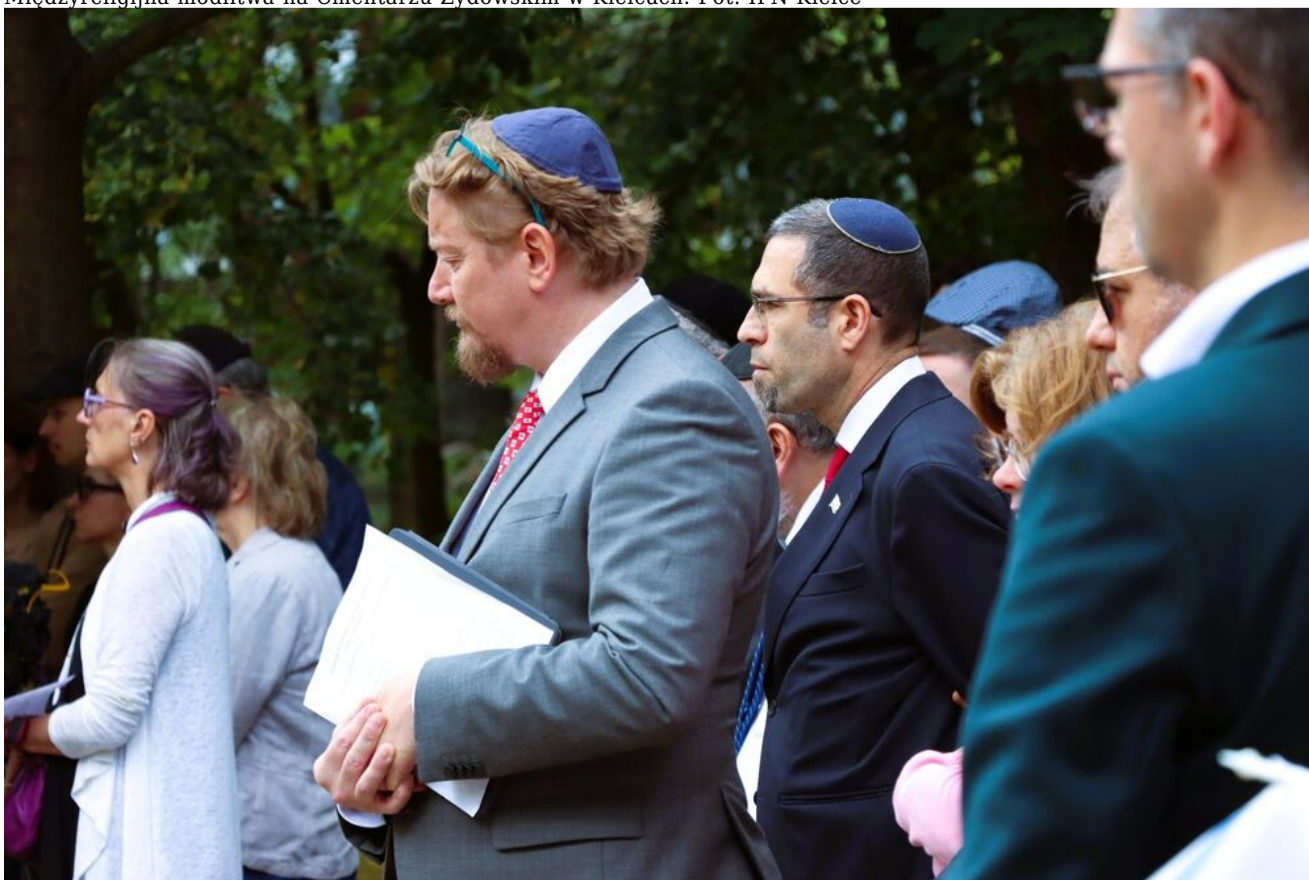
Międzyreligijna modlitwa na Cmentarzu Żydowskim w Kielcach.