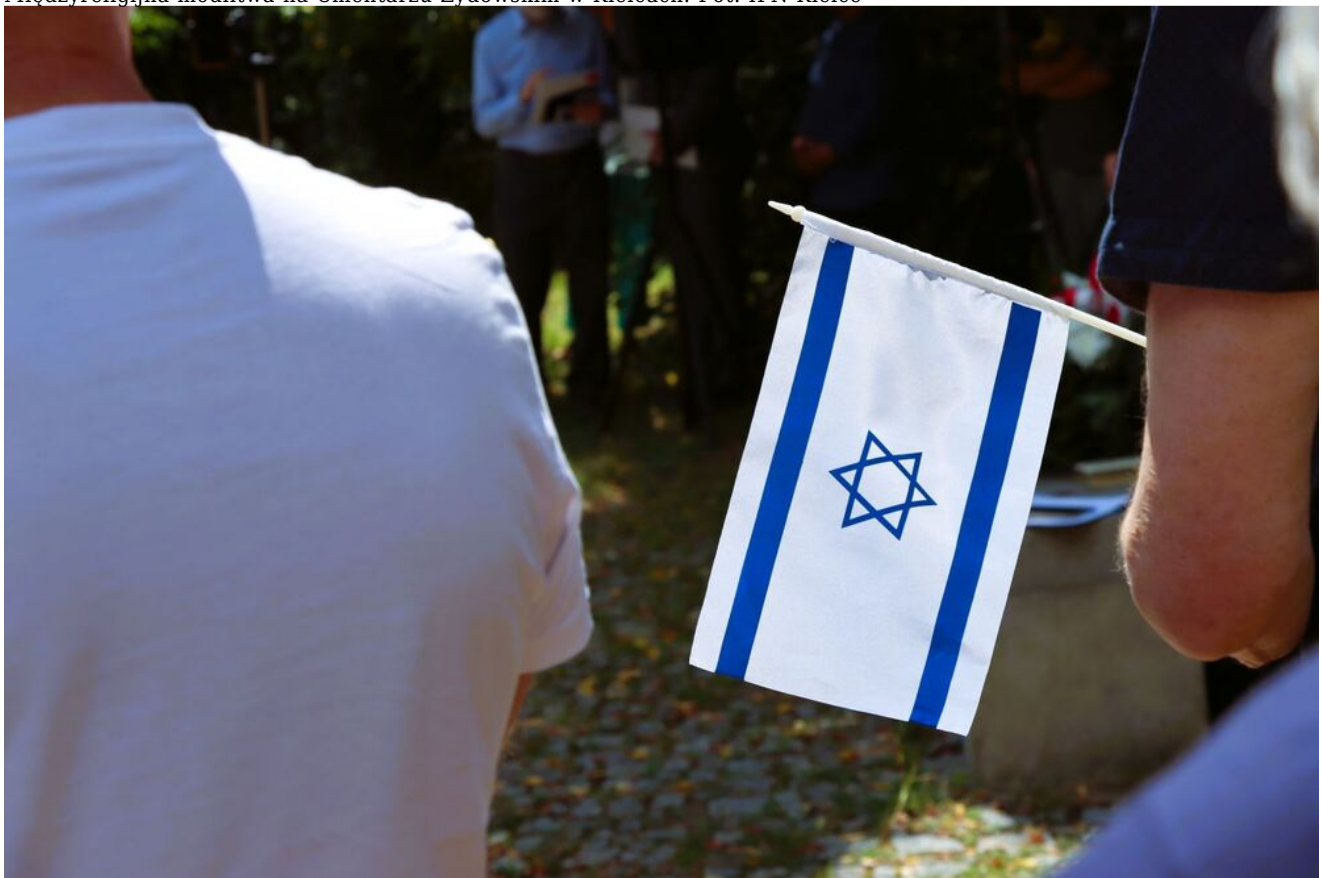
Międzyreligijna modlitwa na Cmentarzu Żydowskim w Kielcach.