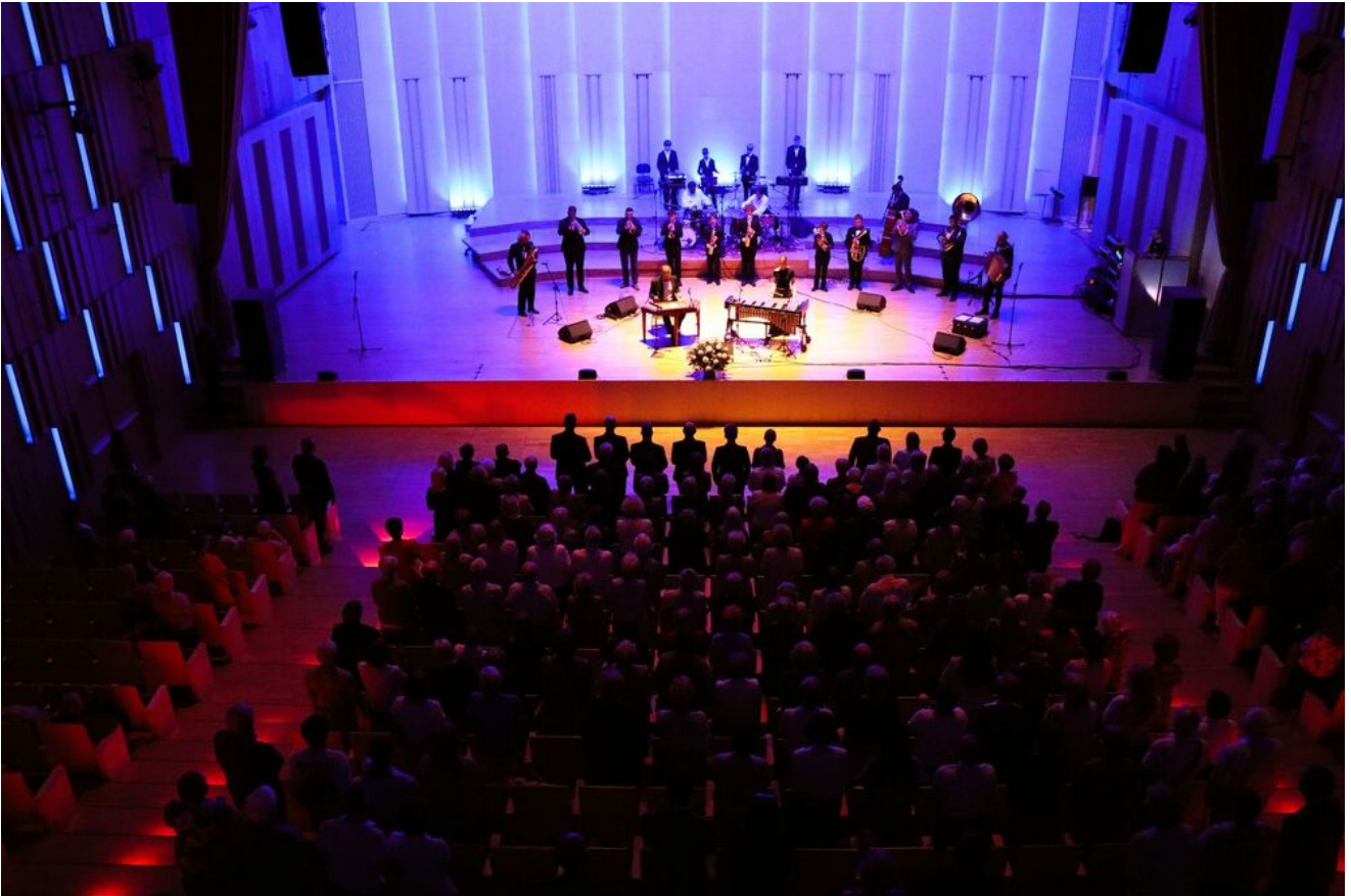
„Wieczór pamięci Żydów zamordowanych w Kielcach w lipcu 1946 roku” w Filharmonii Świętokrzyskiej.