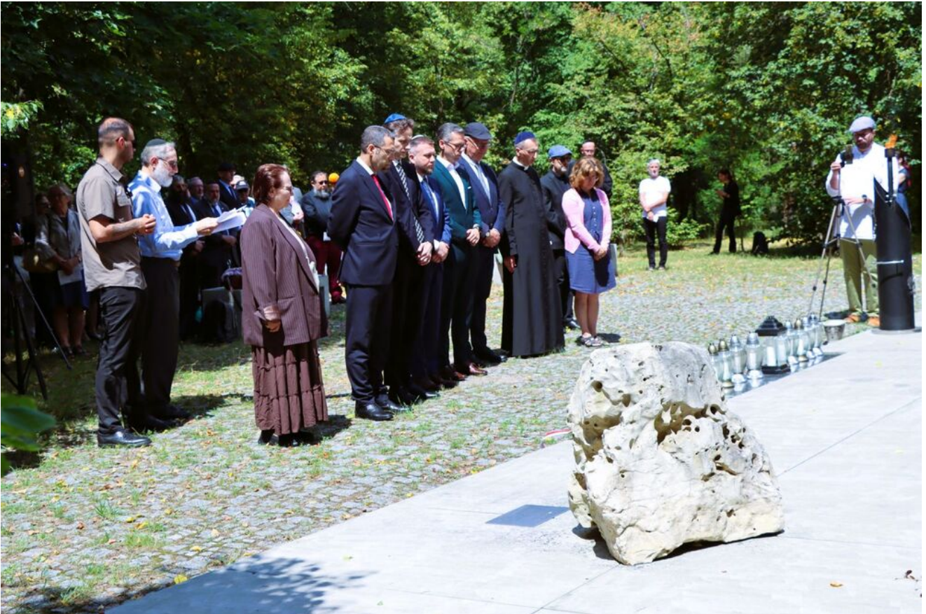
Międzyreligijna modlitwa na Cmentarzu Żydowskim w Kielcach.