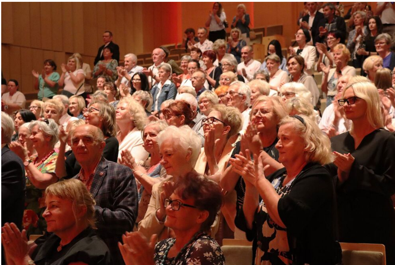
„Wieczór pamięci Żydów zamordowanych w Kielcach w lipcu 1946 roku” w Filharmonii Świętokrzyskiej.