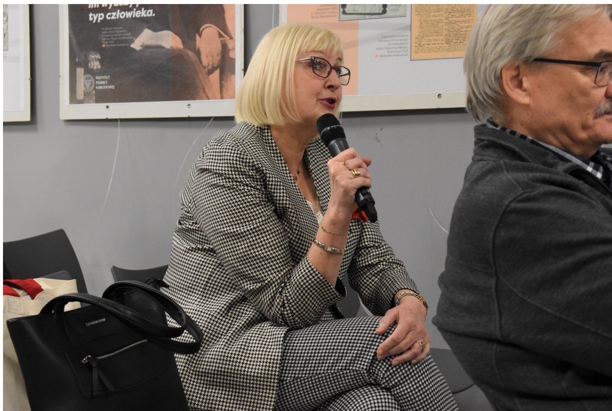
Kielce. Promocja książki „Stan badań nad pomocą Żydom na ziemiach polskich pod okupacją niemiecką – przegląd piśmiennictwa”.