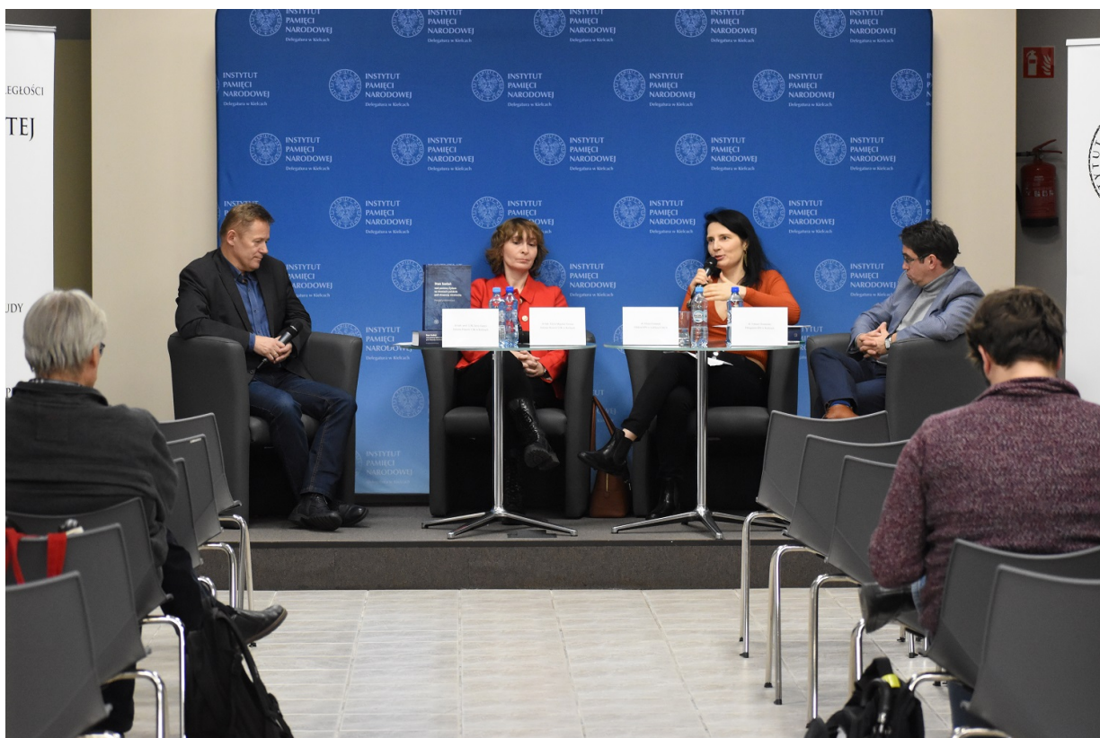
Kielce. Promocja książki „Stan badań nad pomocą Żydom na ziemiach polskich pod okupacją niemiecką – przegląd piśmiennictwa”.