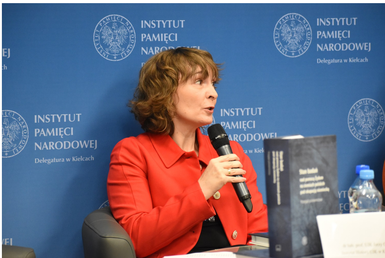
Kielce. Promocja książki „Stan badań nad pomocą Żydom na ziemiach polskich pod okupacją niemiecką - przegląd piśmiennictwa”.