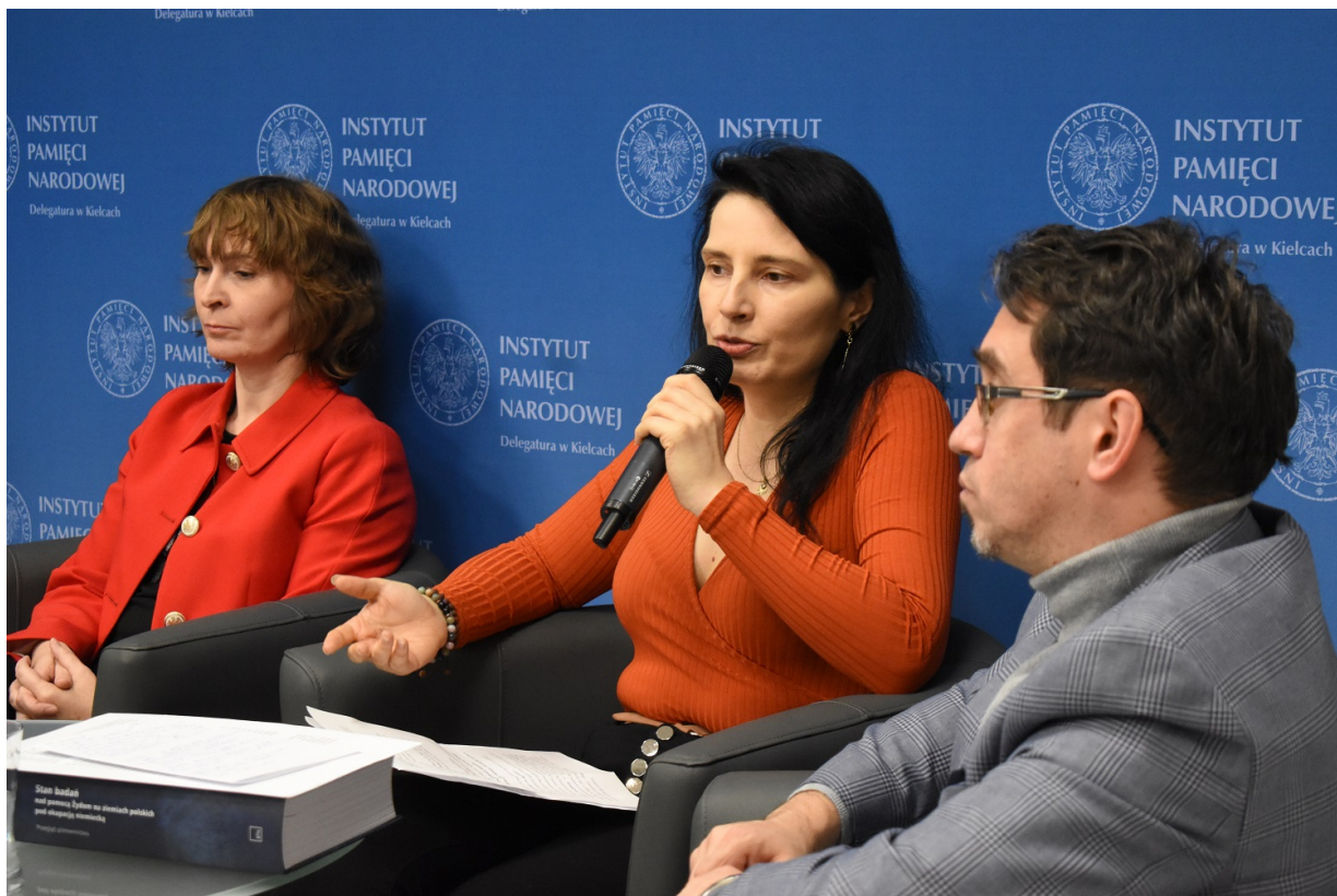
Kielce. Promocja książki „Stan badań nad pomocą Żydom na ziemiach polskich pod okupacją niemiecką - przegląd piśmiennictwa”.