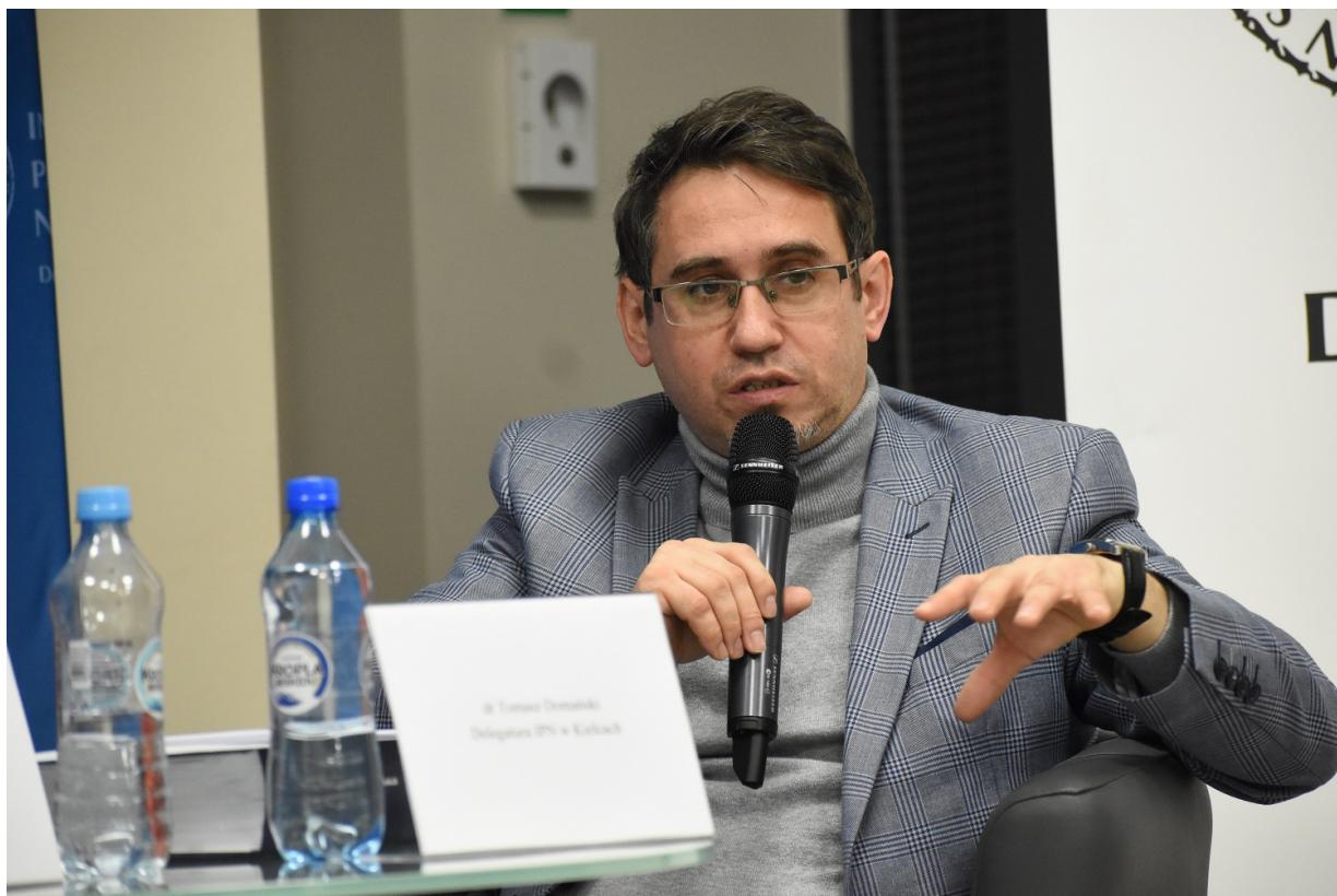
Kielce. Promocja książki „Stan badań nad pomocą Żydom na ziemiach polskich pod okupacją niemiecką – przegląd piśmiennictwa”.