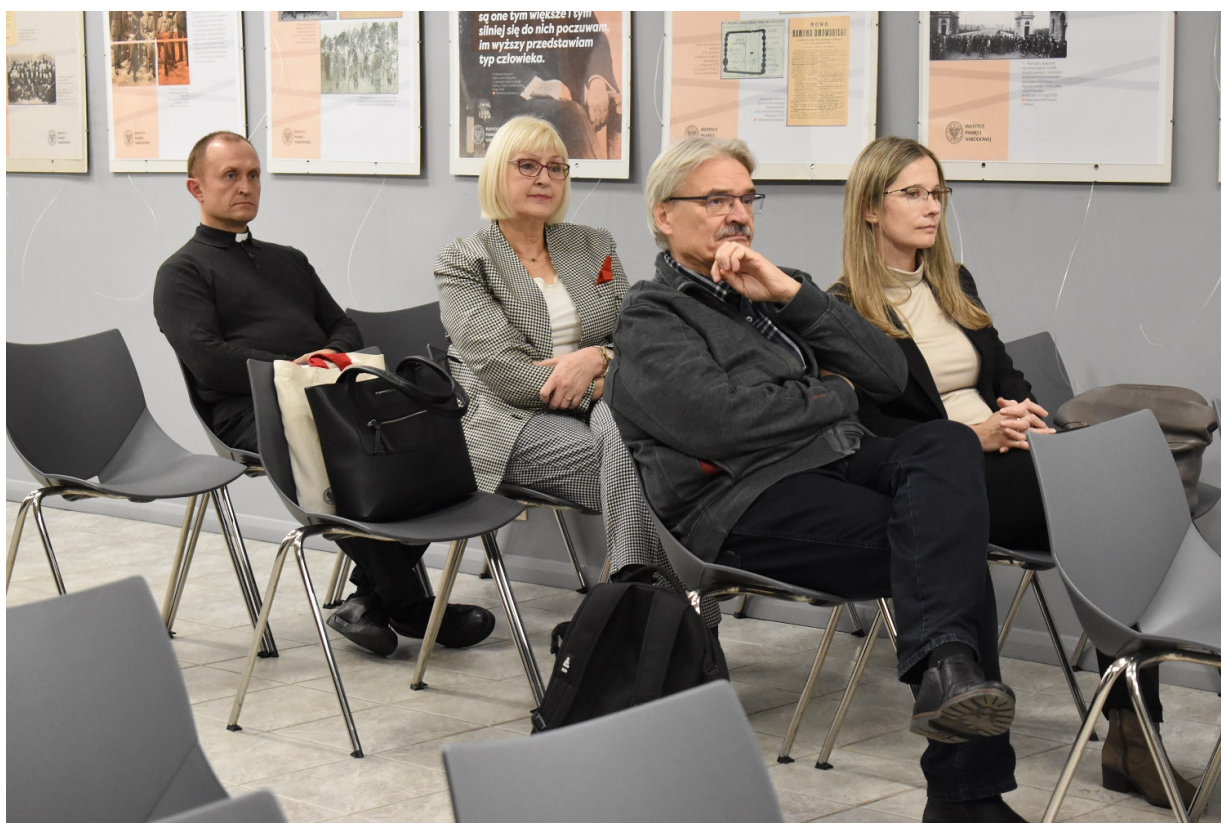
Kielce. Promocja książki „Stan badań nad pomocą Żydom na ziemiach polskich pod okupacją niemiecką - przegląd piśmiennictwa”.

17 listopada 2022 roku na „Przystanku Historia” w Kielcach odbyła się promocja publikacji „Stan badań nad pomocą Żydom na ziemiach polskich pod okupacją niemiecką - przegląd piśmiennictwa” pod redakcją dr. Tomasza Domańskiego i dr Alicji Gontarek.