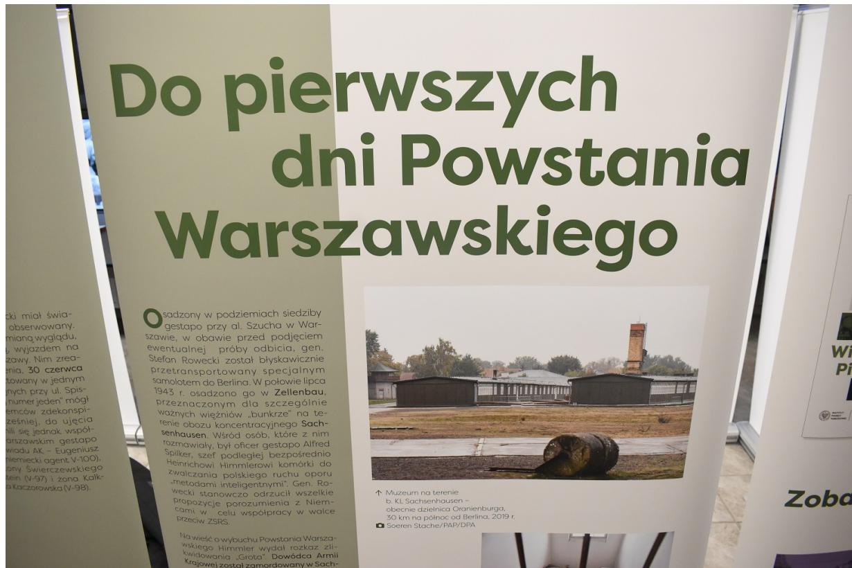
Wystawa o Stefanie Roweckim „Grocie”.

Wystawa o gen. dyw. Stefanie Roweckim „Grocie” jest dostępna w grudniu 2022 r. w Centrum Edukacyjnym „Przystanek Historia” IPN w Kielcach (ul. Warszawska 5). Prezentuje ona losy wojskowego od najmłodszych lat, po śmierć w obozie koncentracyjnym Sachsenhausen.