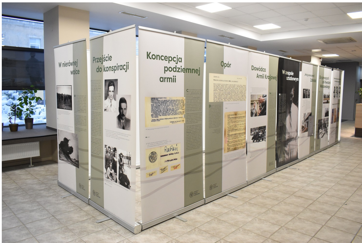
Wystawa o Stefanie Roweckim „Grocie”.