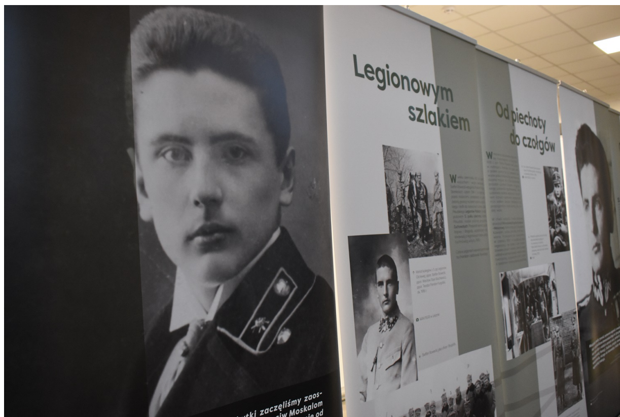
Wystawa o Stefanie Roweckim „Grocie”.