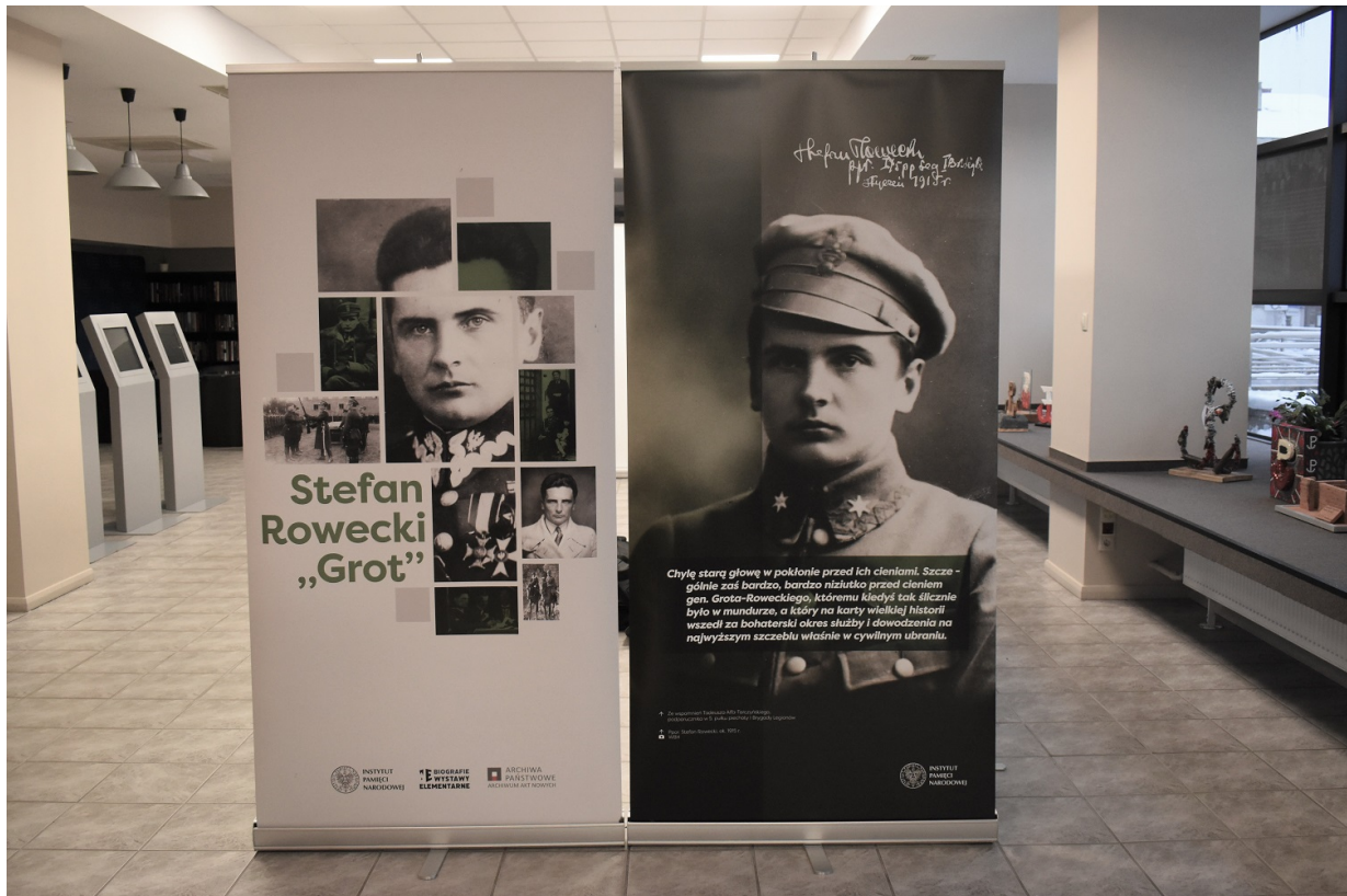
Wystawa o Stefanie Roweckim „Grocie”.