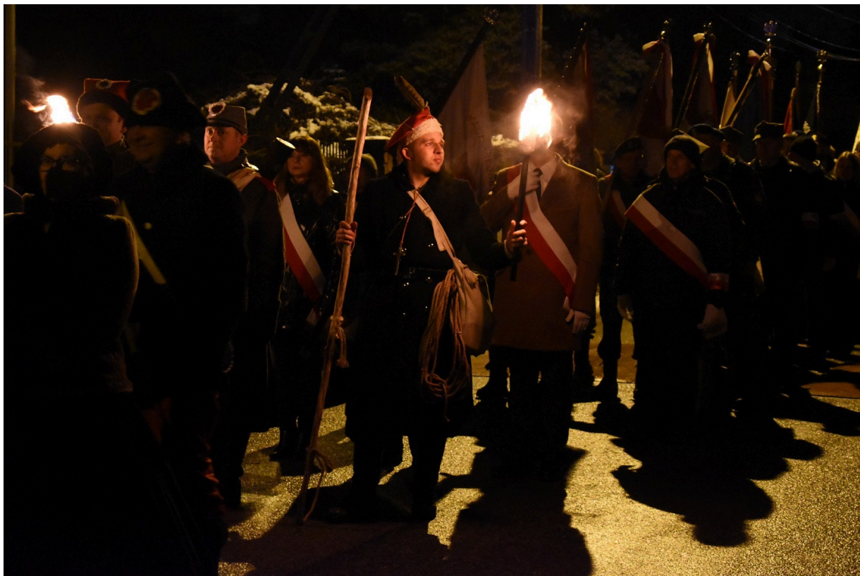
Odstąpienie pomnika na Białogonie w Kielcach w 160 rocznicę wybuchu powstania styczniowego.