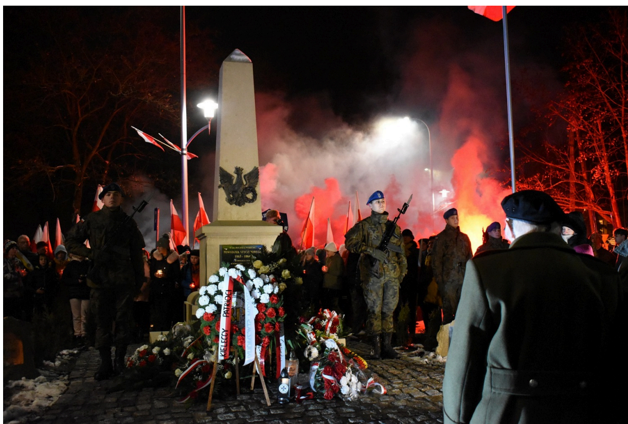
Odślonięcie pomnika na Białogonie w Kielcach w 160 rocznicę wybuchu powstania styczniowego.

22 stycznia 2023 roku w 160. rocznicę wybuchu powstania styczniowego na Białogonie w Kielcach odbyła się uroczystość odsłonięcia pomnika, który upamiętnia największy zryw niepodległościowy XIX wieku. Kielecką Delegaturę IPN reprezentowała dr Dorota Koczwańska-Kalita.