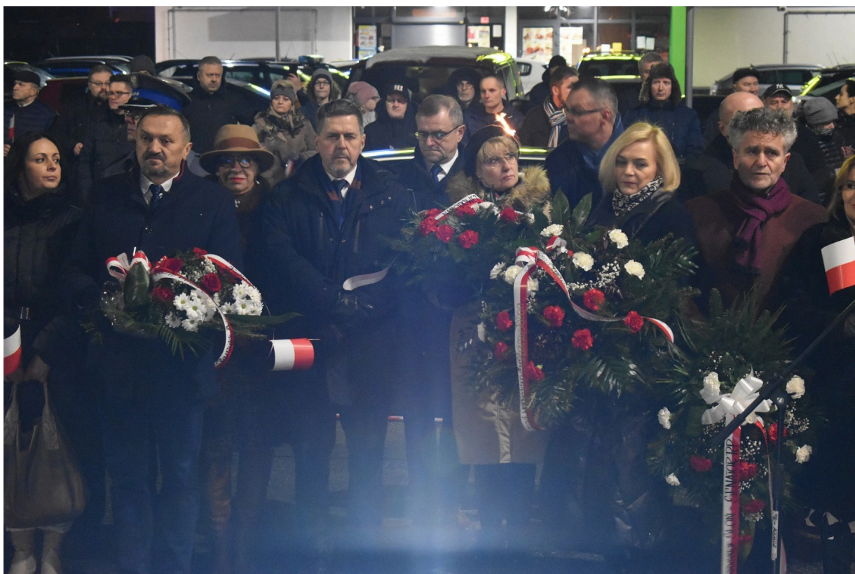
Odstąpienie pomnika na Białogonie w Kielcach w 160 rocznicę wybuchu powstania styczniowego.