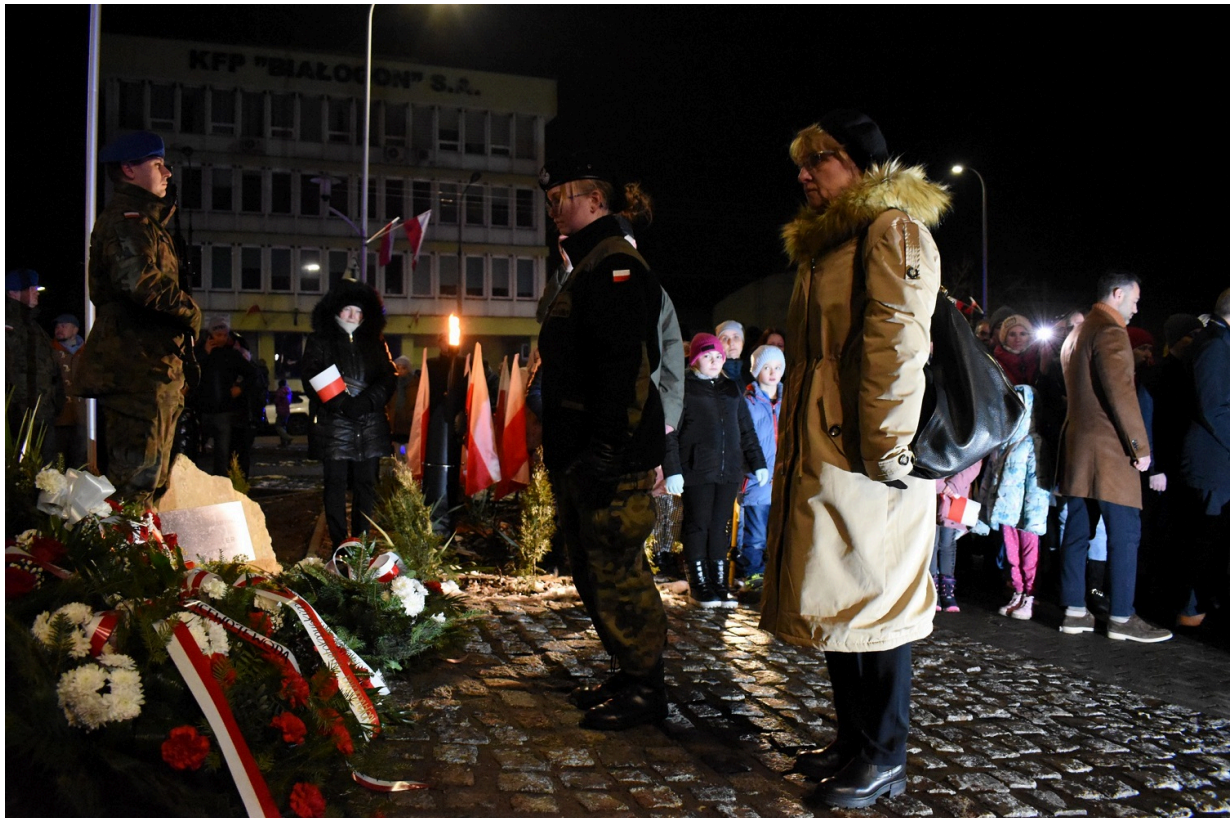
Odświeżenie pomnika na Białogonie w Kielcach w 160 rocznicę wybuchu powstania styczniowego.

Najpierw odprawiona została msza święta w kościele Parafii Przemienienia Pańskiego w intencji ojczyzny. Następnie, zebrani przemaszerowali na róg ulic Kolonia i księcia Druckiego-Lubeckiego, gdzie odbyło się uroczyste odświeżenie pomnika upamiętniającego wybuch powstania styczniowego. Monument udało się wykonać dzięki zaangażowaniu społeczników czy przedsiębiorców.