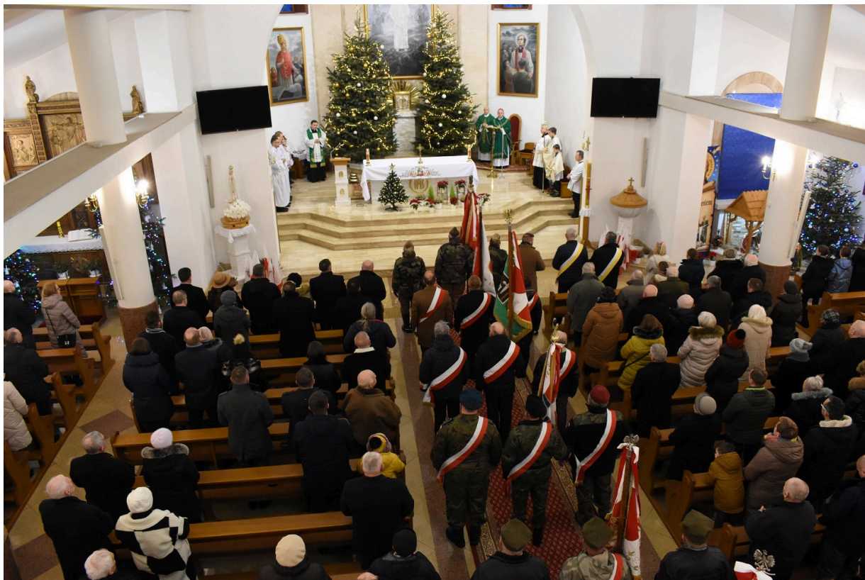
Odstąpienie pomnika na Białogonie w Kielcach w 160 rocznicę wybuchu powstania styczniowego.