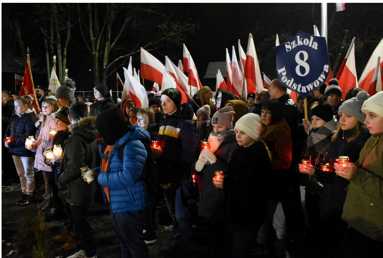
Odstąpienie pomnika na Białogonie w Kielcach w 160 rocznicę wybuchu powstania styczniowego.