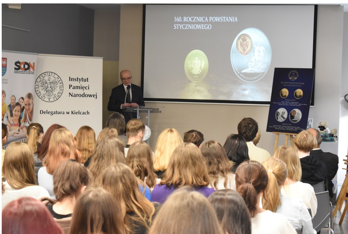
Spotkanie na Przystanku Historia w Kielcach - 160 rocznica wybuchu powstania styczniowego.