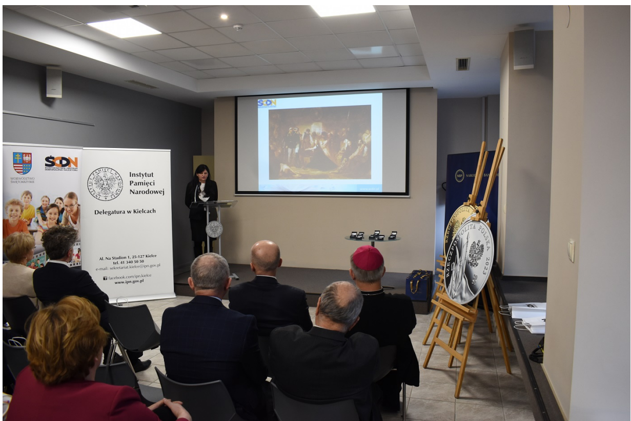
Spotkanie na Przystanku Historia w Kielcach - 160 rocznica wybuchu powstania styczniowego.