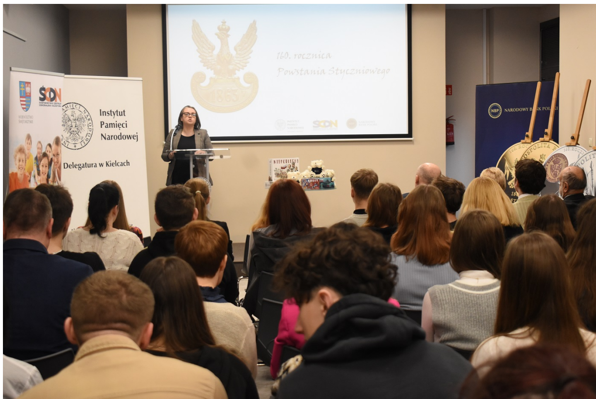
Spotkanie na Przystanku Historia w Kielcach - 160 rocznica wybuchu powstania styczniowego.