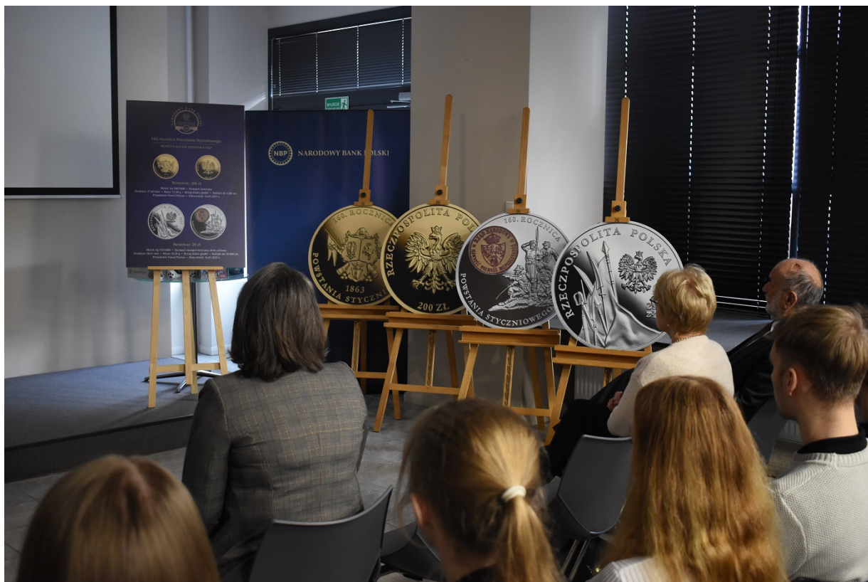
Spotkanie na Przystanku Historia w Kielcach - 160 rocznica wybuchu powstania styczniowego.