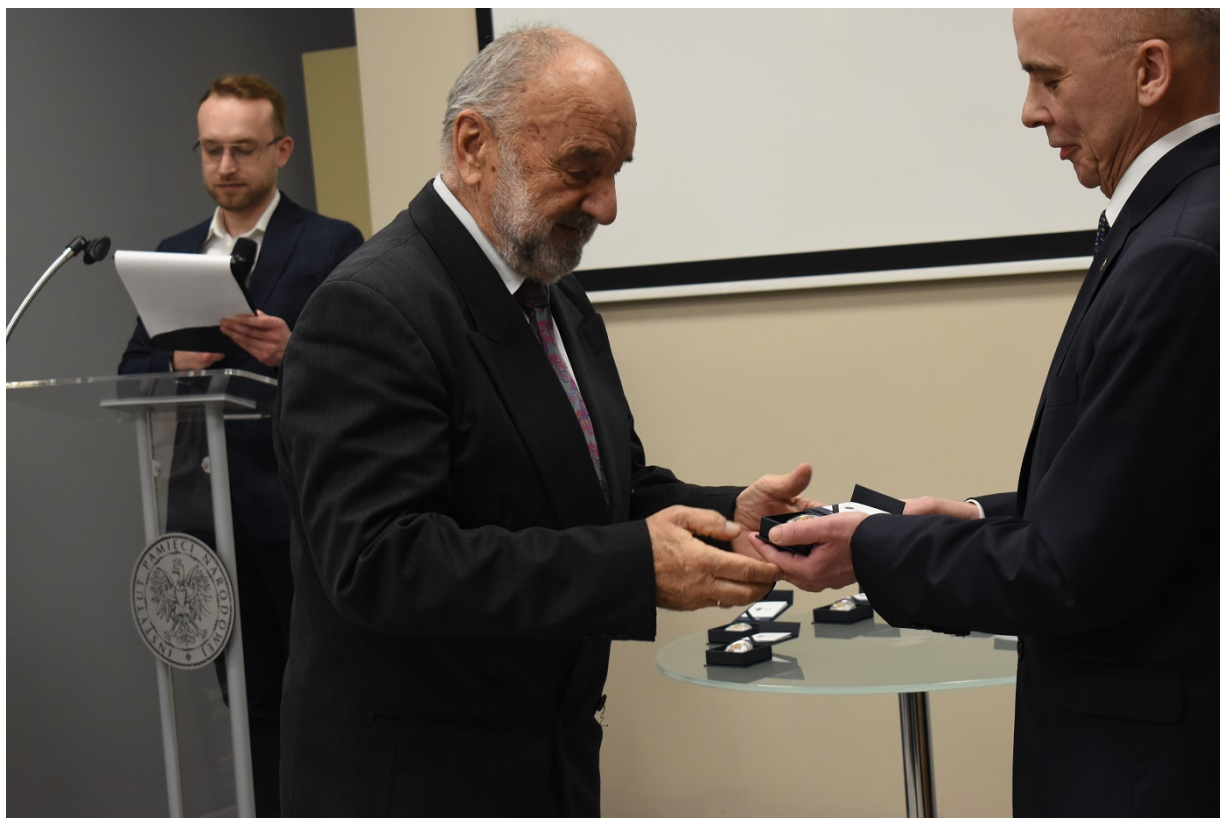
Spotkanie na Przystanku Historia w Kielcach - 160 rocznica wybuchu powstania styczniowego.

Najpierw Centrum Edukacyjne IPN „Przystanek Historia” przy ulicy Warszawskiej odwiedzili uczniowie kieleckich szkół wraz z nauczycielami. Młodzież dowiedziała się więcej o powstaniu styczniowym dzięki prelekcji profesora Adama Massalskiego z Referatu Badań Historycznych IPN w Kielcach pt. „Rok krwawej zamieci 1863”. Badacz opowiedział m.in. o miejscach walk powstańców w regionie świętokrzyskim czy o ważnych postaciach. Na koniec uczniowie sprawdzili swoją wiedzę rozwiązując quiz historyczny w aplikacji Kahoot!