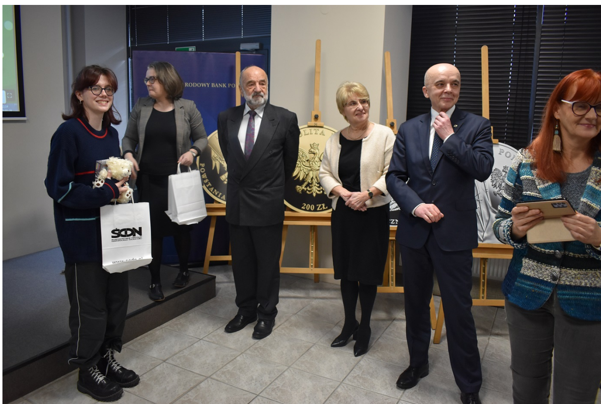
Spotkanie na Przystanku Historia w Kielcach - 160 rocznica wybuchu powstania styczniowego.