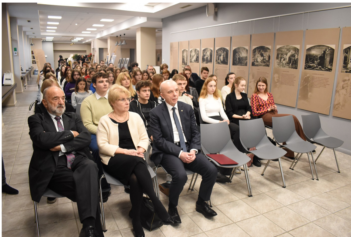
Spotkanie na Przystanku Historia w Kielcach - 160 rocznica wybuchu powstania styczniowego.

Uczestniczyła w nich między innymi młodzież, nauczyciele czy przedstawiciele władz - w sumie niemal dwieście osób w różnym wieku. W programie znalazły się prelekcje, prezentacje monet kolekcjonerskich czy zwiedzanie wystawy.