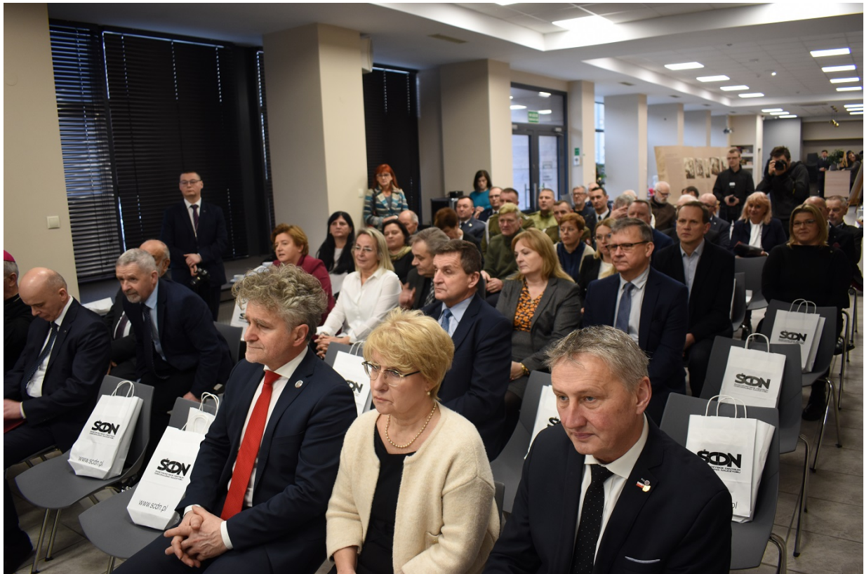
Spotkanie na Przystanku Historia w Kielcach - 160 rocznica wybuchu powstania styczniowego.