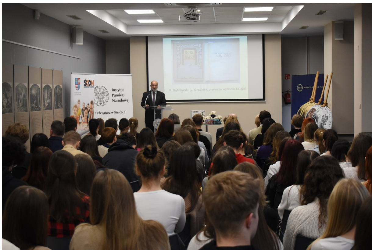
Spotkanie na Przystanku Historia w Kielcach - 160 rocznica wybuchu powstania styczniowego.