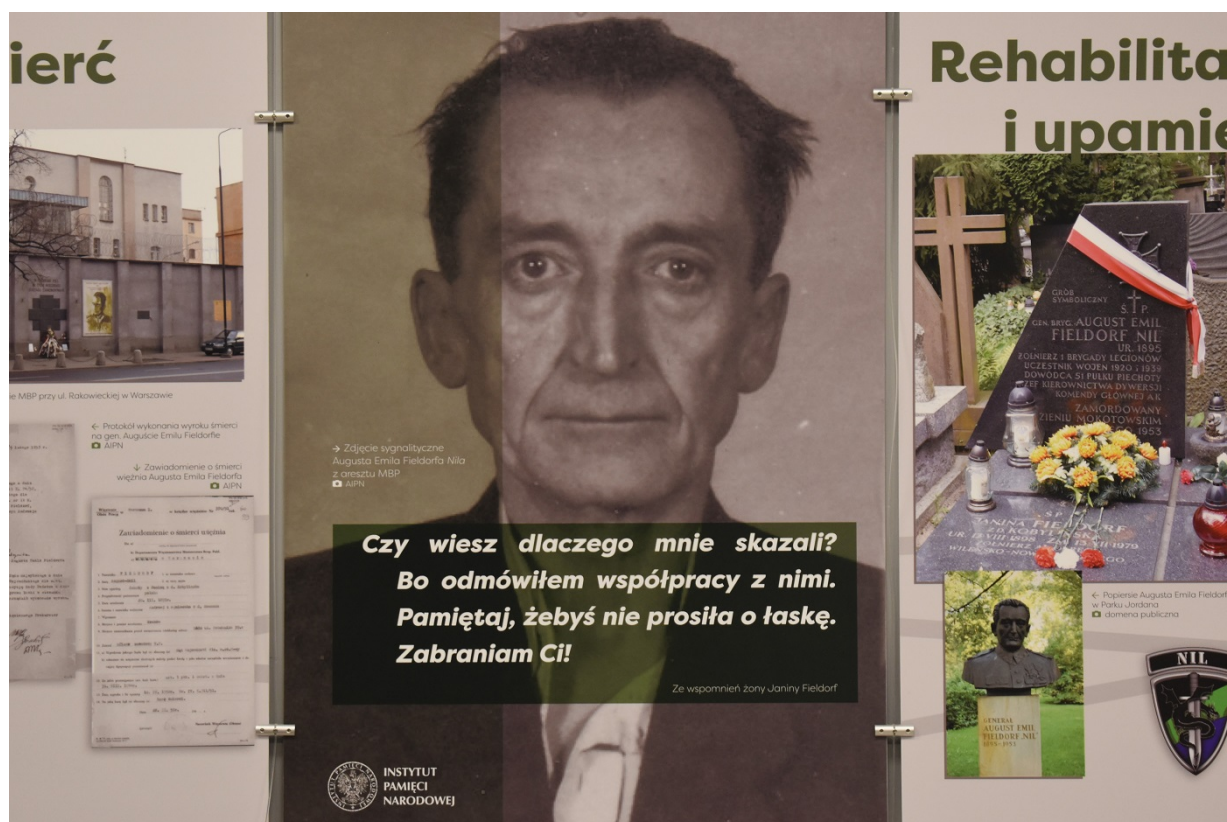
August Emil Fieldorf „Nil” bohaterem nowej wystawy w „Przystanku Historia” w Kielcach.