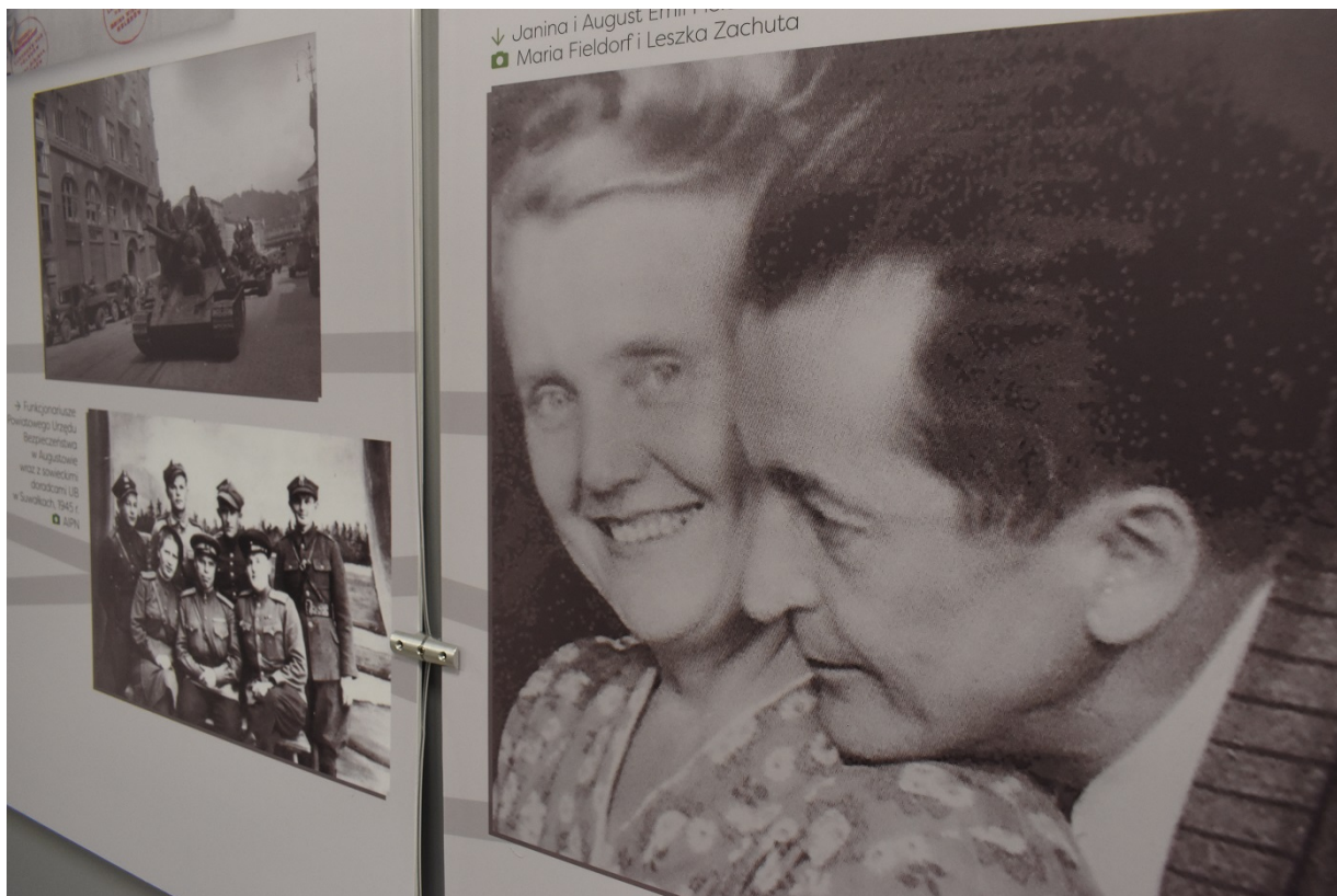
August Emil Fieldorf „Nil” bohaterem nowej wystawy w „Przystanku Historia” w Kielcach.