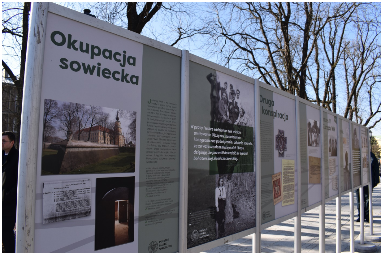
Wystawa o Łukaszu Cieplińskim – Kielce, 28 lutego – 23 marca 2023 r.

Biograficzna wystawa na 15 planszach prezentuje postać pułkownika Łukasza Cieplińskiego - Prezesa IV Zarządu WiN, który stał się symbolem walki Polaków o niepodległość. Ciepliński należał do elity pokolenia wychowanego w II Rzeczypospolitej. Walczył w obronie kraju w 1939 r. Za swoją bohaterską postawę podczas bitwy nad Bzurą został odznaczony Krzyżem Orderu Virtuti Militari. W ZWZ - AK pełnił funkcję inspektora rzeszowskiego. Pod jego dowództwem Inspektorat AK Rzeszów był najsilniejszym ze wschodnich inspektoratów krakowskiego Okręgu AK. Na panelach wystawy dotyczących okresu po 1944 r. zaprezentowano działalność Łukasza Cieplińskiego w konspiracji antykomunistycznej, jego aresztowanie, proces i tragiczną śmierć 1 marca 1951 r.