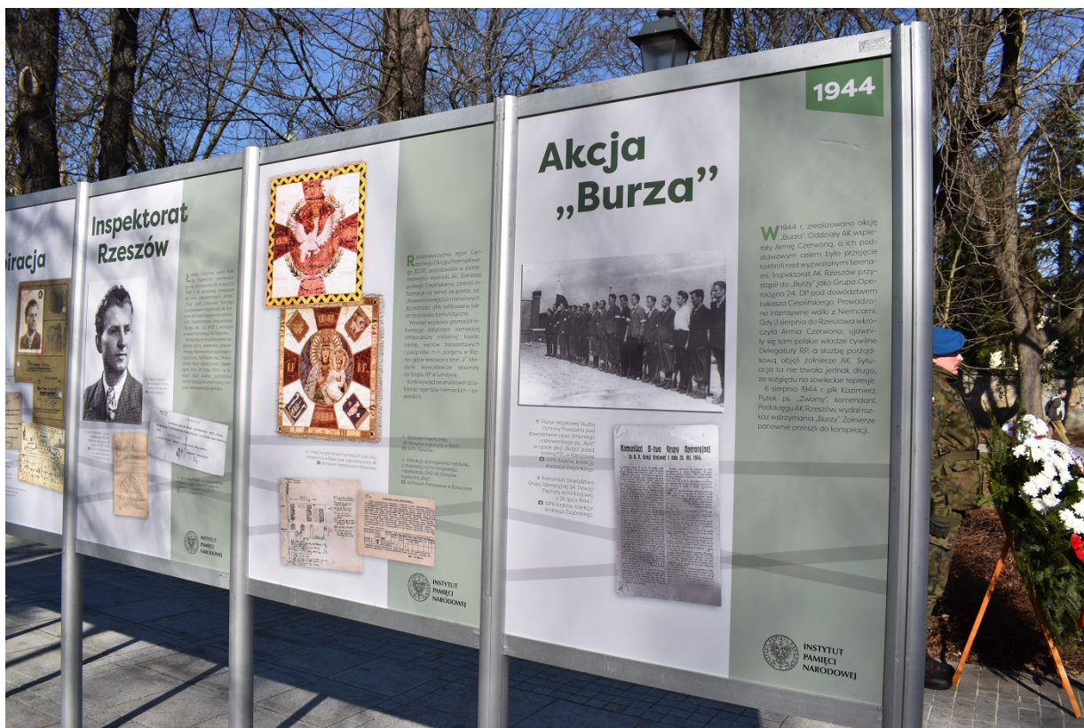
Wystawa o Łukaszu Cieplińskim - Kielce, 28 lutego - 23 marca 2023 r.

Wystawa prezentująca losy Łukasza Cieplińskiego jest dostępna do 23 marca 2023 roku na Skwerze im. Stefana Żeromskiego. Delegatura IPN w Kielcach pokazuje tę wystawę w związku z obchodami Narodowego Dnia Pamięci Żołnierzy Wyklętych.