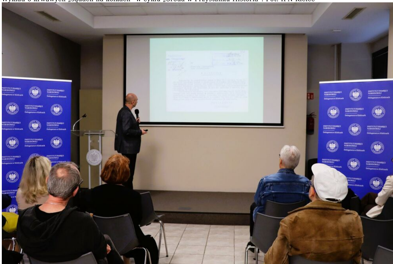
Wykład o krwawych „sądach na kółkach” w cyklu „Sroda w Przystanku Historia”.