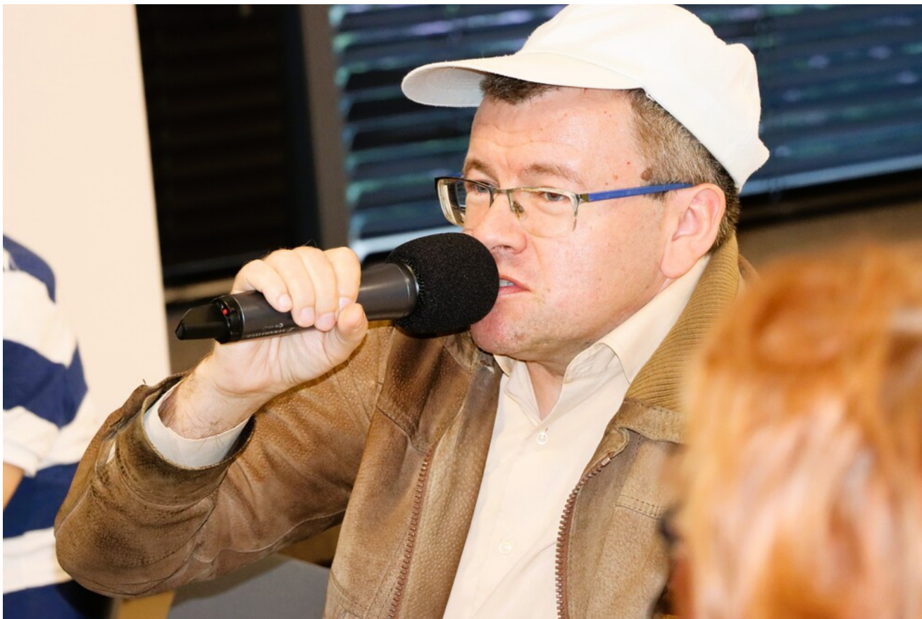
Wykład o krwawych „sądach na kółkach” w cyklu „Sroda w Przystanku Historia”.