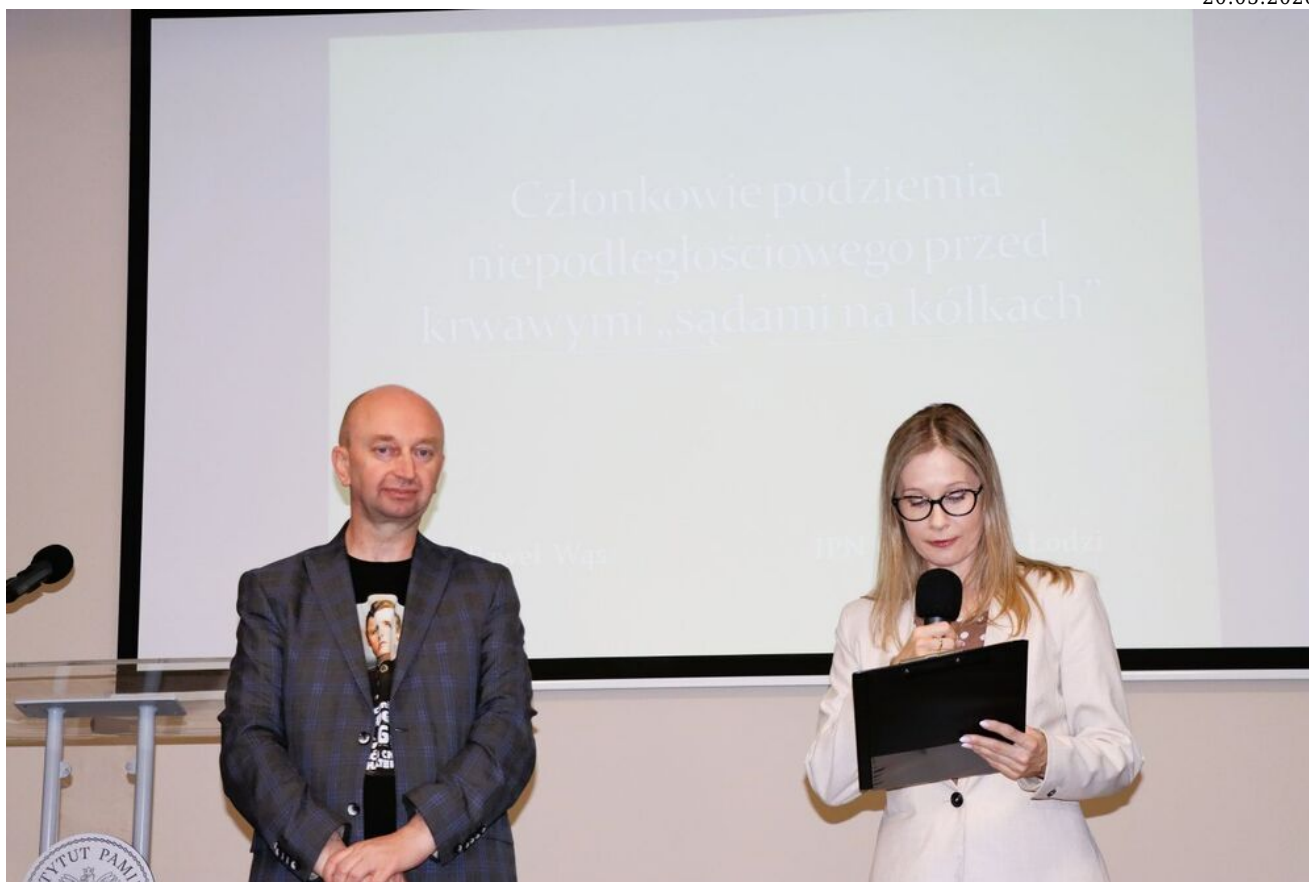
Wykład o krwawych „sądach na kółkach” w cyklu „Środa w Przystanku Historia”.