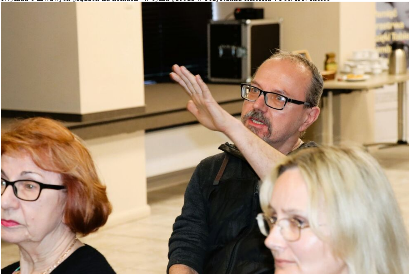
Wykład o krwawych „sądach na kółkach” w cyklu „Sroda w Przystanku Historia”.