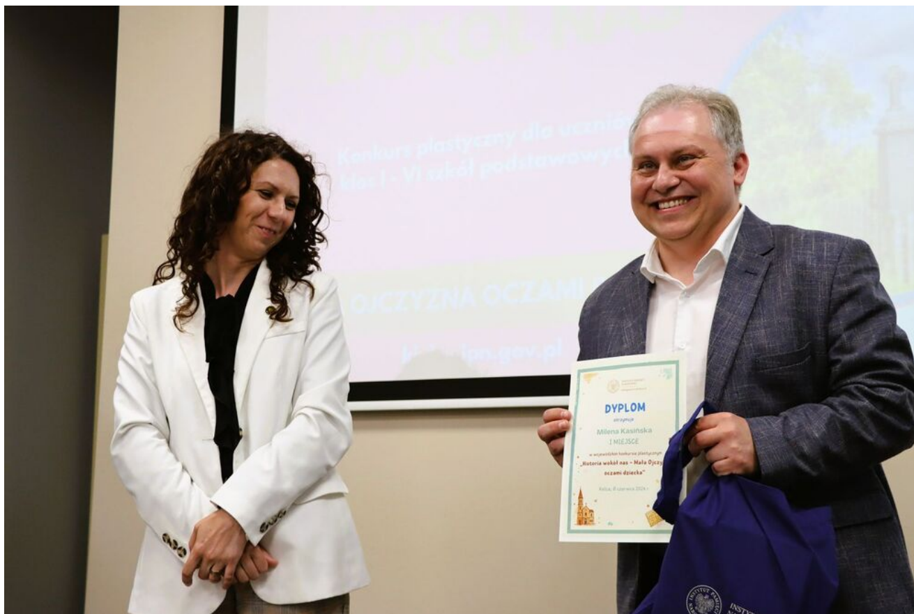
„Historia wokół nas - Mała Ojczyzna oczami dziecka”.