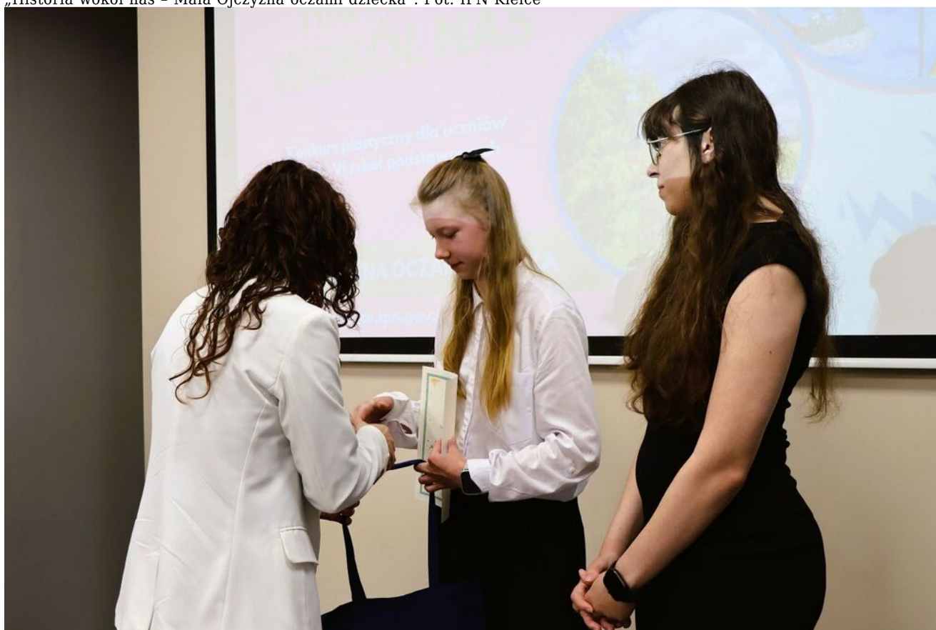
„Historia wokół nas - Mała Ojczyzna oczami dziecka”.