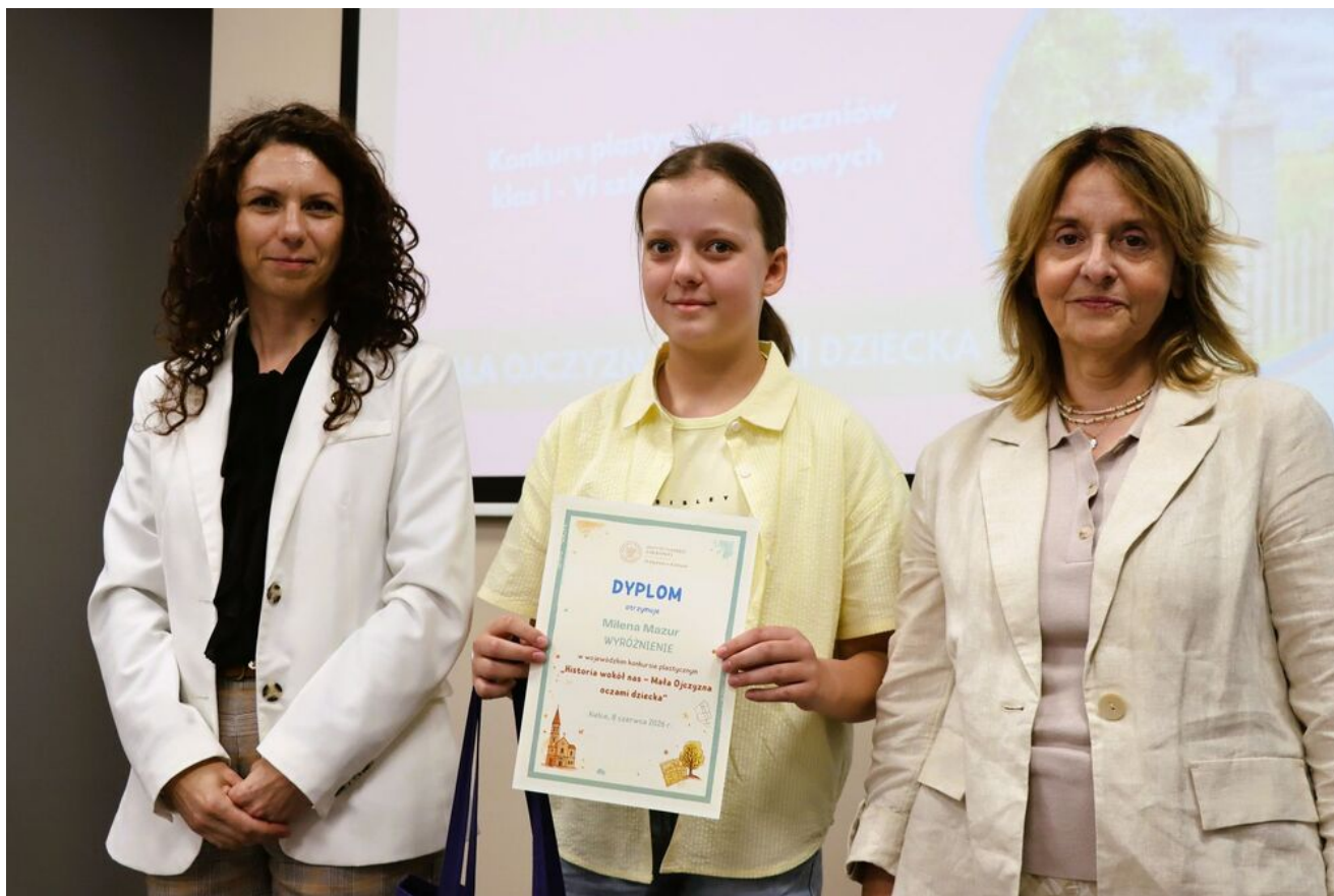
„Historia wokół nas - Mała Ojczyzna oczami dziecka”.