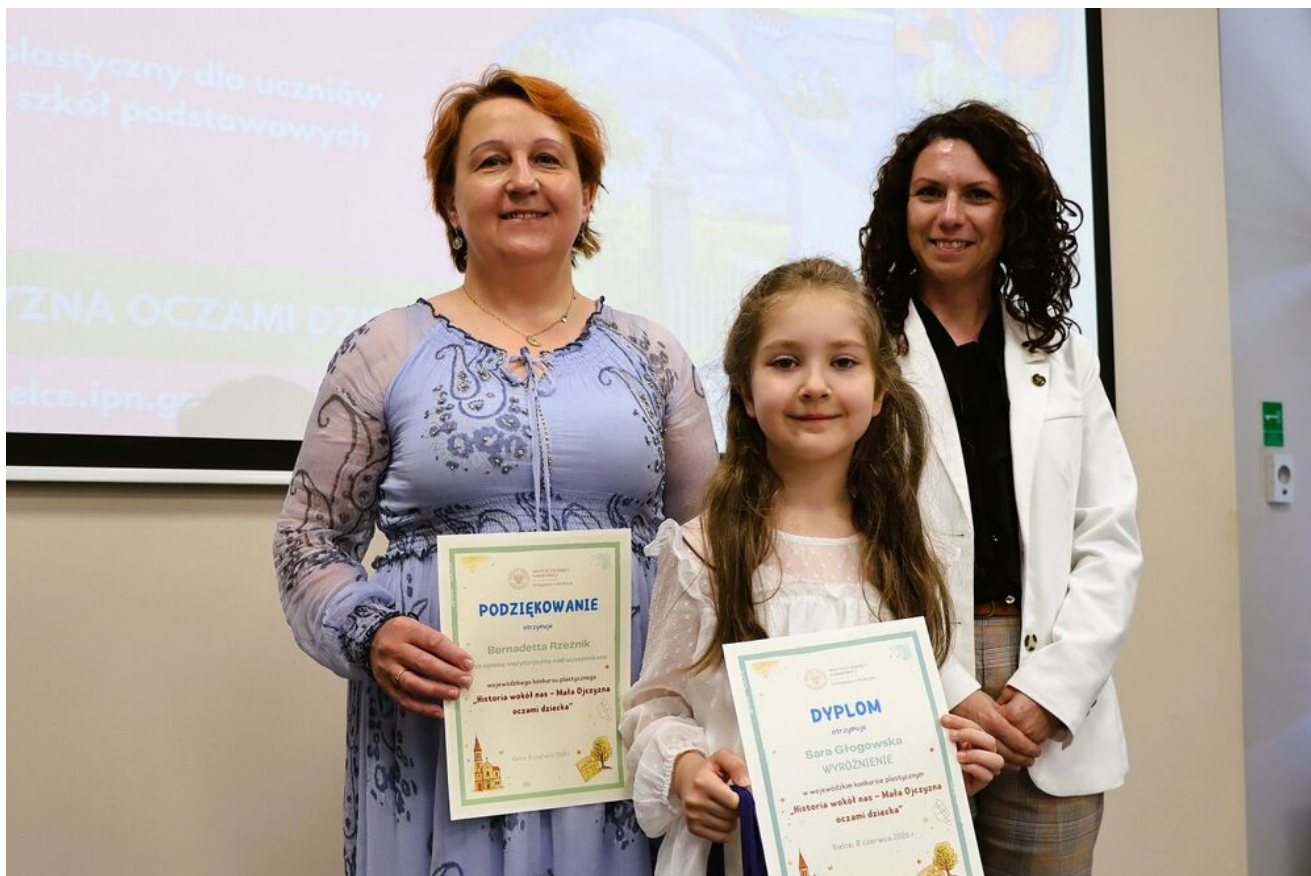
„Historia wokół nas - Mała Ojczyzna oczami dziecka”.