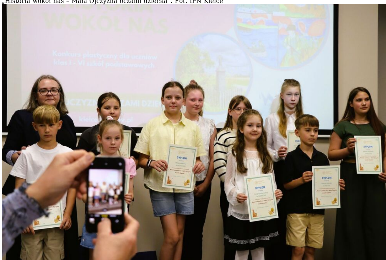
„Historia wokół nas - Mała Ojczyzna oczami dziecka”.

Laureaci i wyróżnieni w konkursie „Historia wokół nas - Mała Ojczyzna oczami dziecka” Uczniowie klas I-III