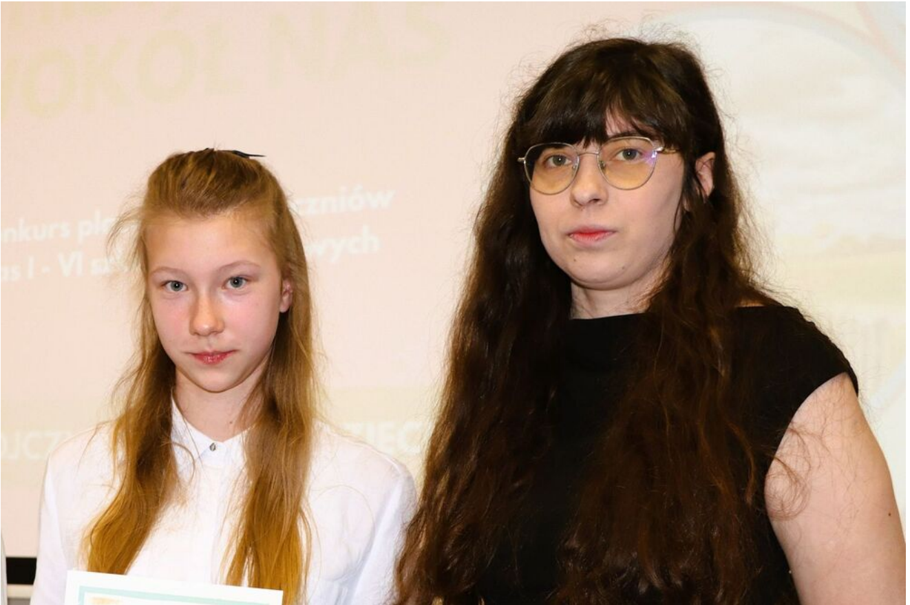
„Historia wokół nas – Mała Ojczyzna oczami dziecka”.