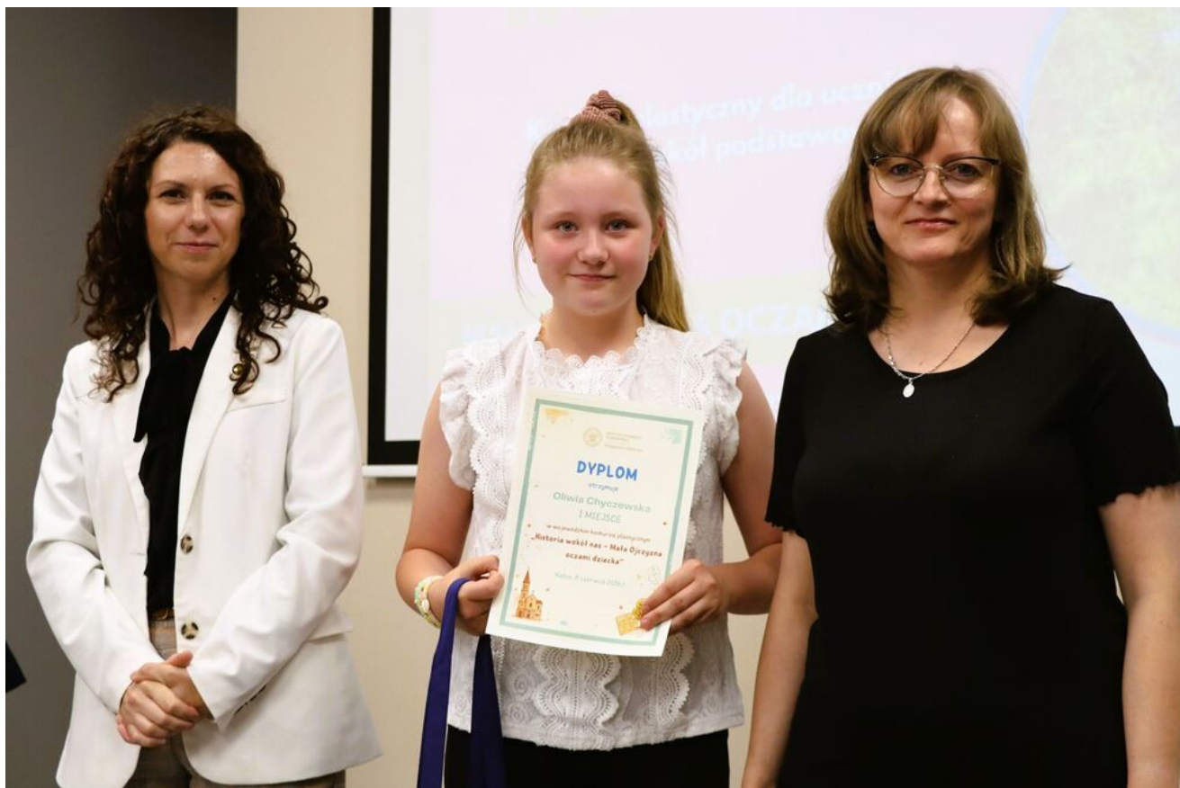
„Historia wokół nas - Mała Ojczyzna oczami dziecka”.