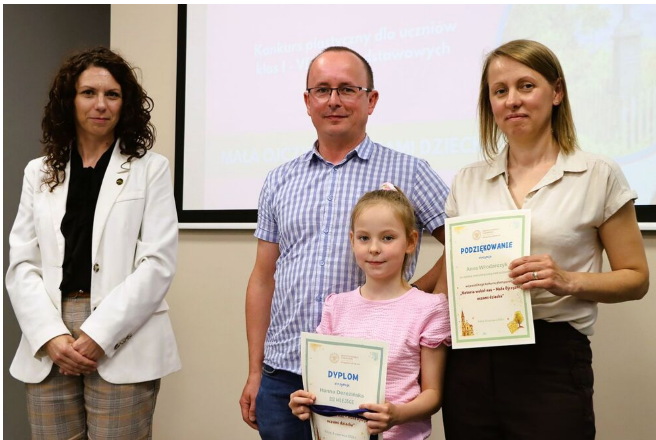
„Historia wokół nas - Mała Ojczyzna oczami dziecka”.