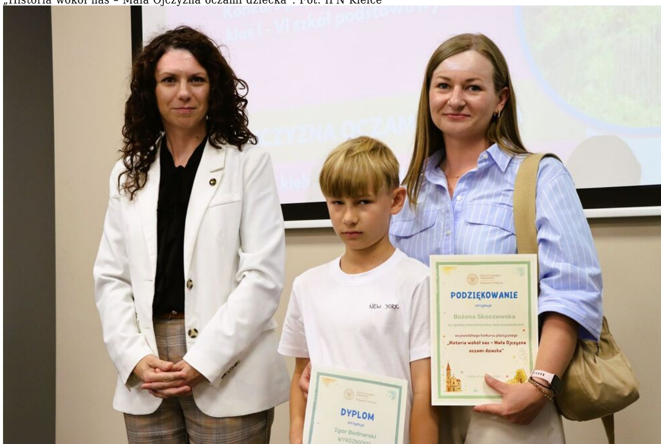
„Historia wokół nas - Mała Ojczyzna oczami dziecka”.