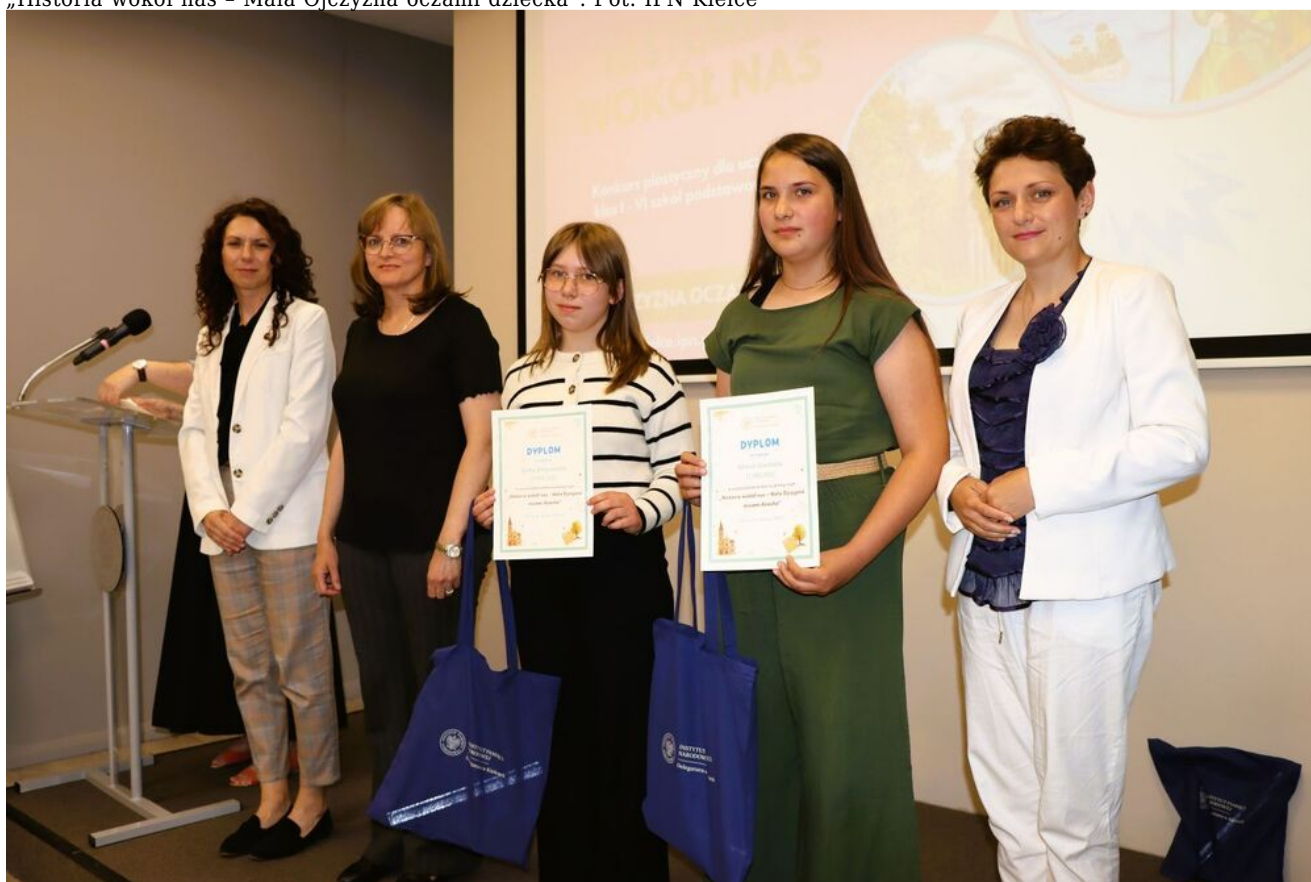
„Historia wokół nas - Mała Ojczyzna oczami dziecka”.