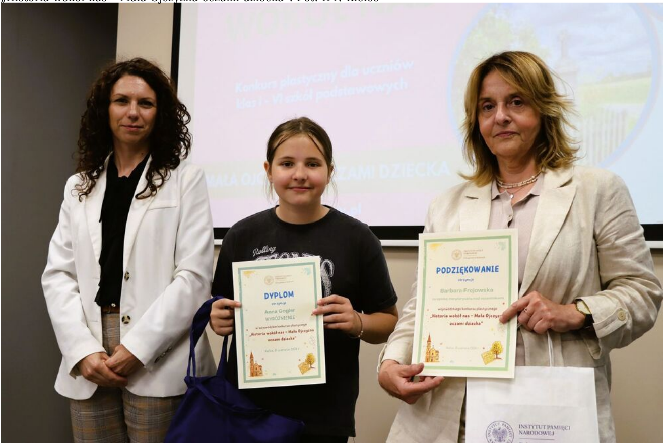
„Historia wokół nas – Mała Ojczyzna oczami dziecka”.