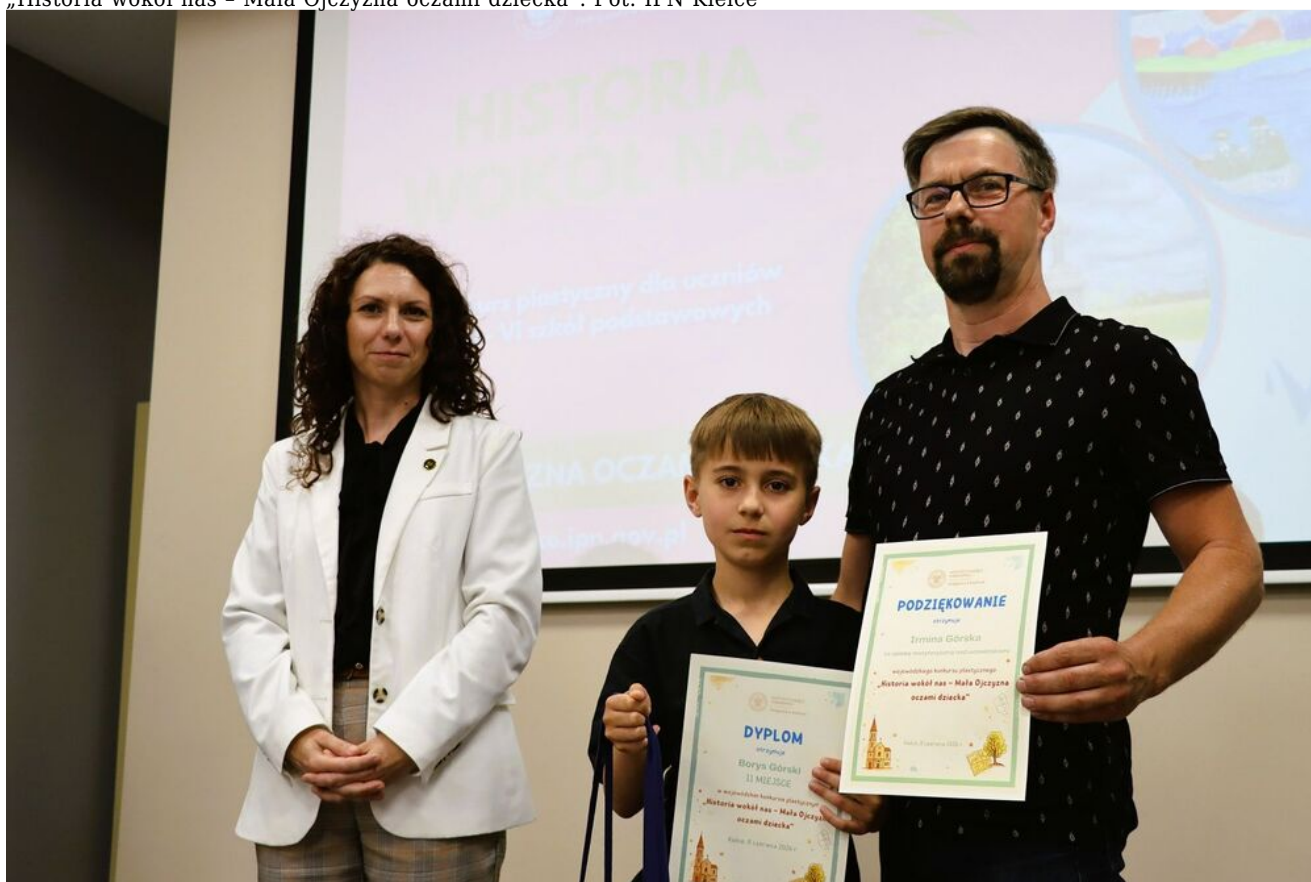
„Historia wokół nas - Mała Ojczyzna oczami dziecka”.