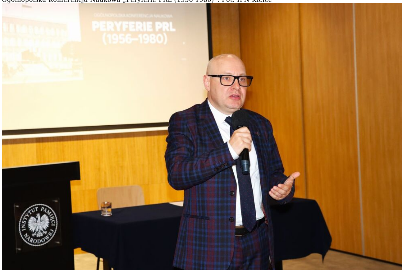
Ogólnopolska Konferencja Naukowa „Peryferie PRL (1956-1980)”.