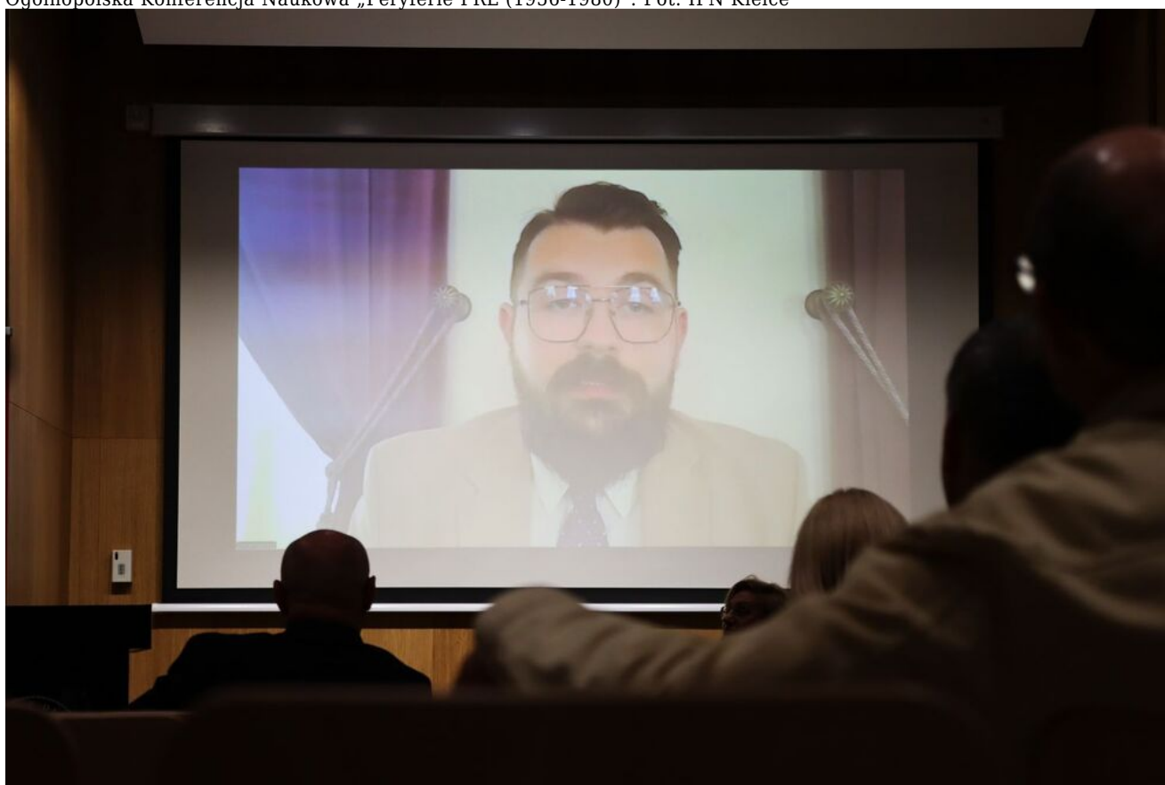
Ogólnopolska Konferencja Naukowa „Peryferie PRL (1956-1980)”.