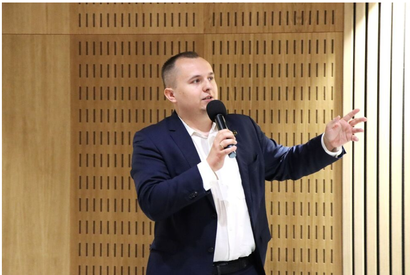
Ogólnopolska Konferencja Naukowa „Peryferie PRL (1956-1980)”.