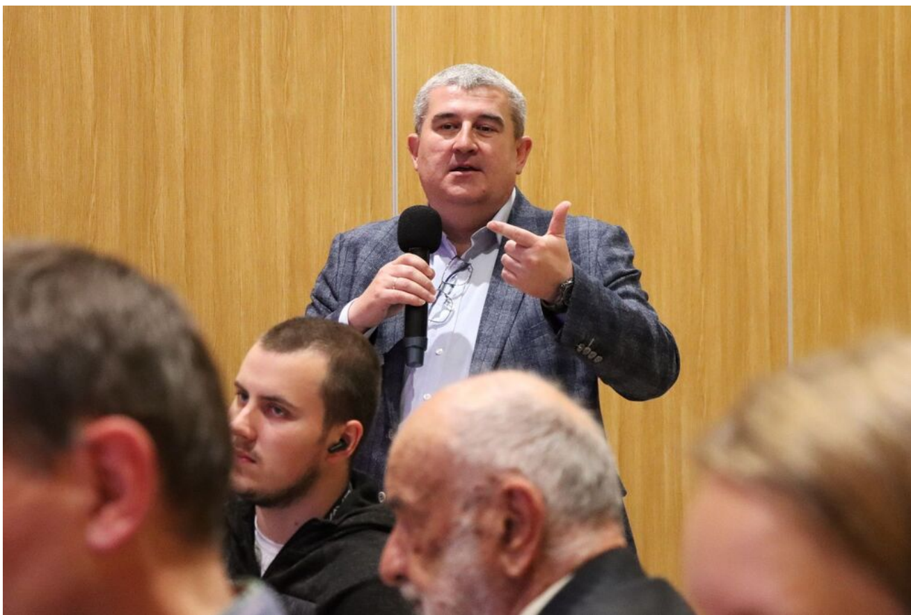
Ogólnopolska Konferencja Naukowa „Peryferie PRL (1956-1980)”.

Podsumowaniem wydarzenia będzie wydawnictwo pokonferencyjne.