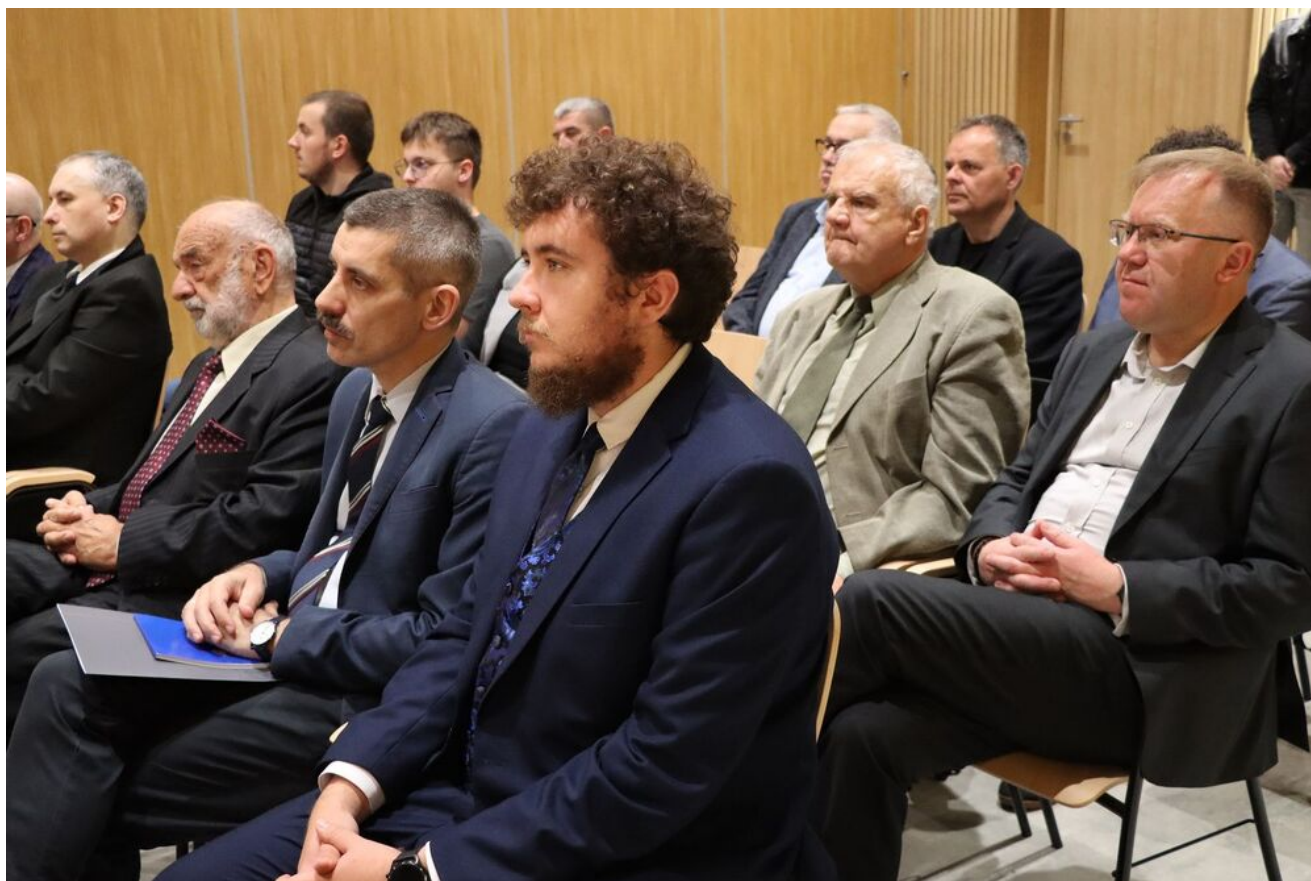
Ogólnopolska Konferencja Naukowa „Peryferie PRL (1956-1980)”.