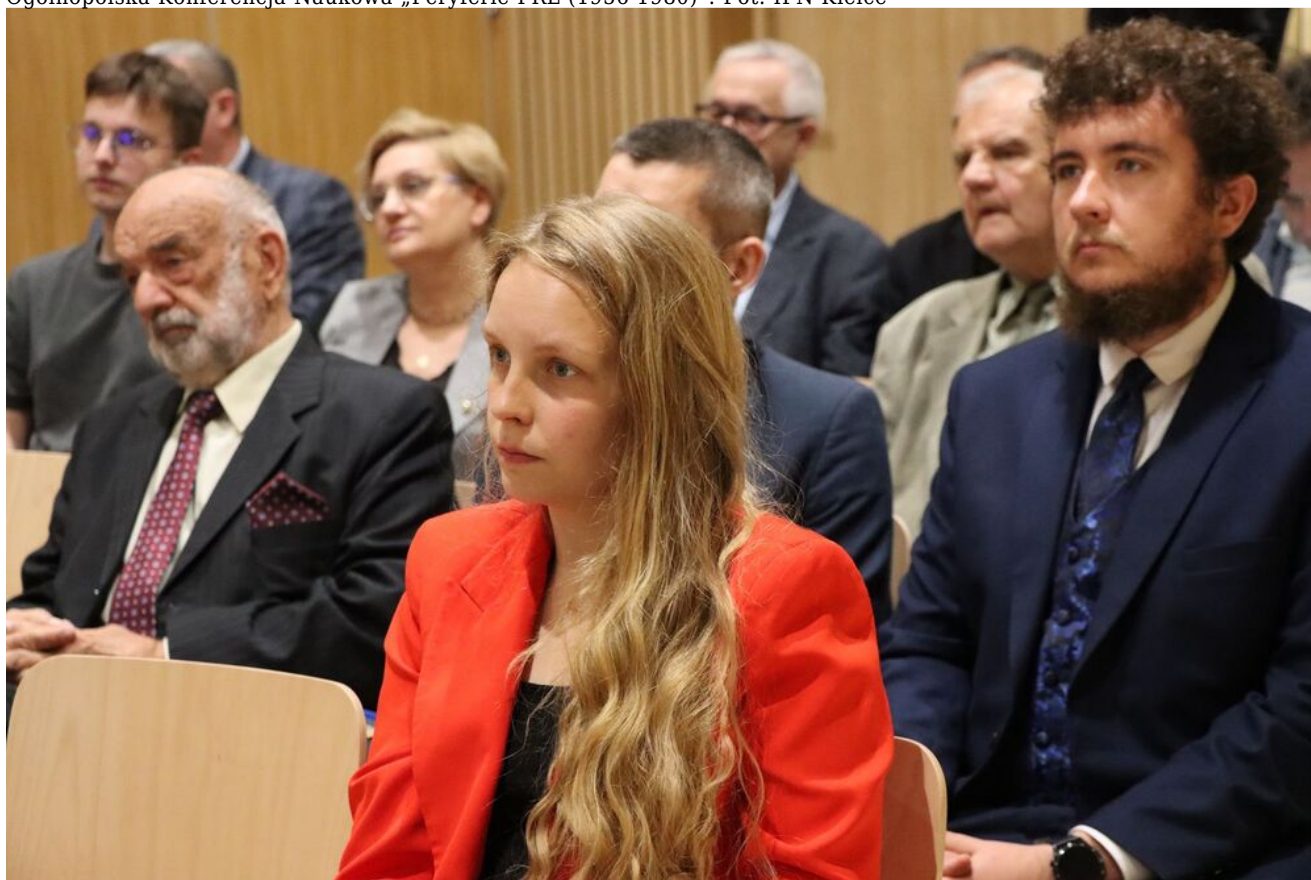
Ogólnopolska Konferencja Naukowa „Peryferie PRL (1956-1980)”.