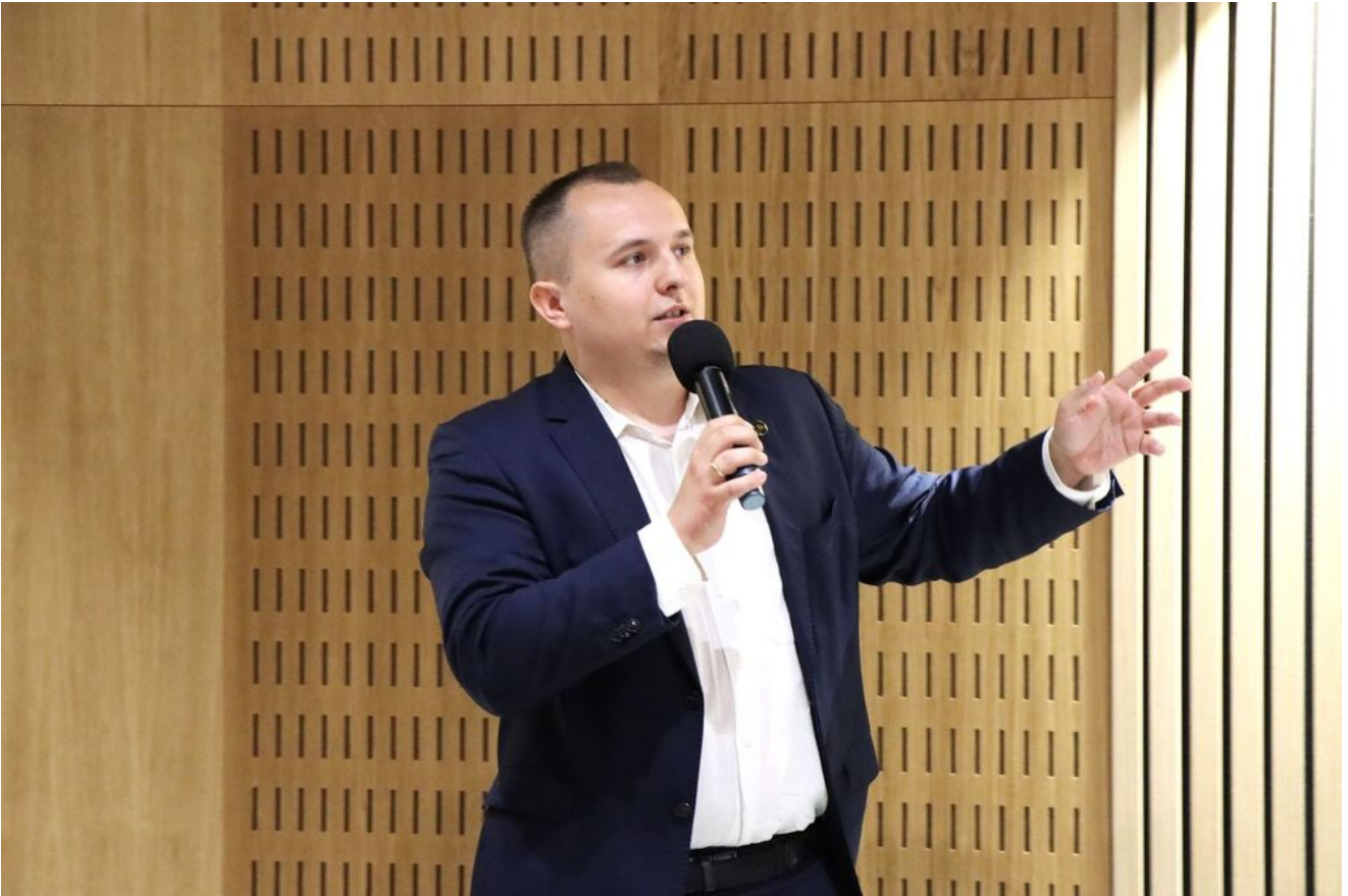
Ogólnopolska Konferencja Naukowa „Peryferie PRL (1956-1980)”.