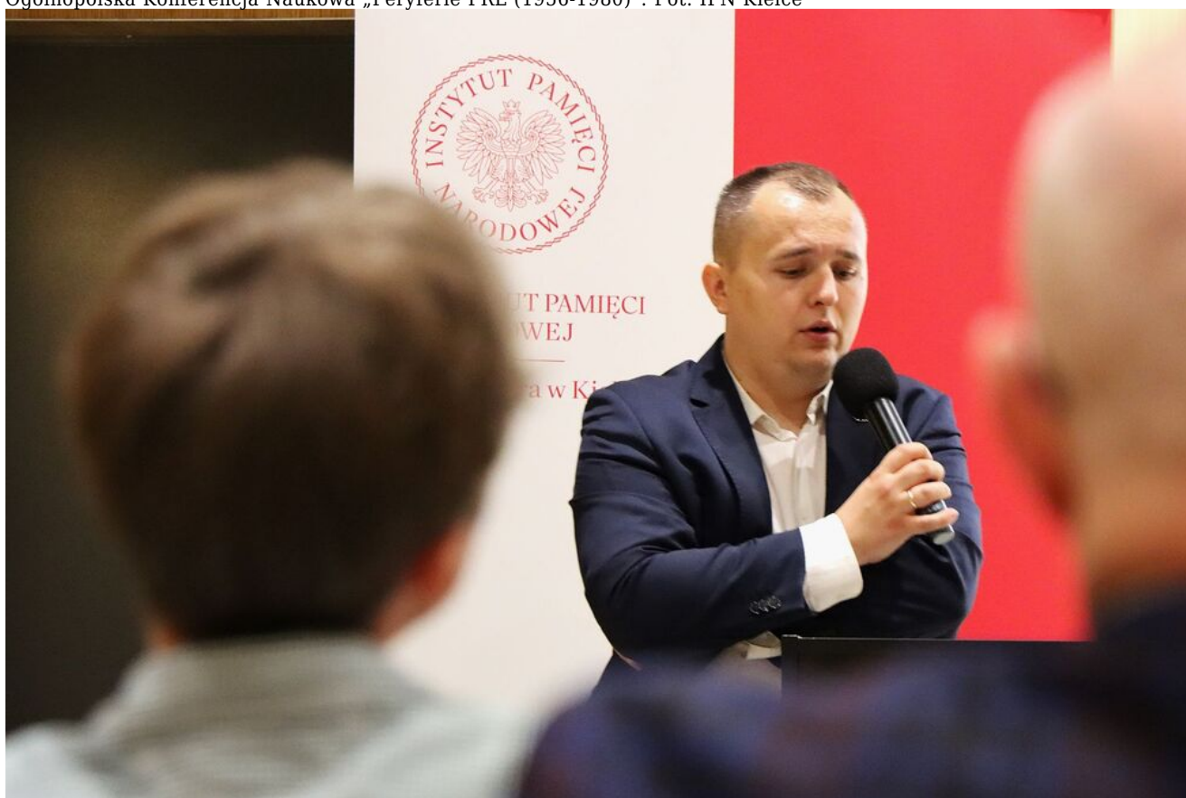
Ogólnopolska Konferencja Naukowa „Peryferie PRL (1956-1980)”.