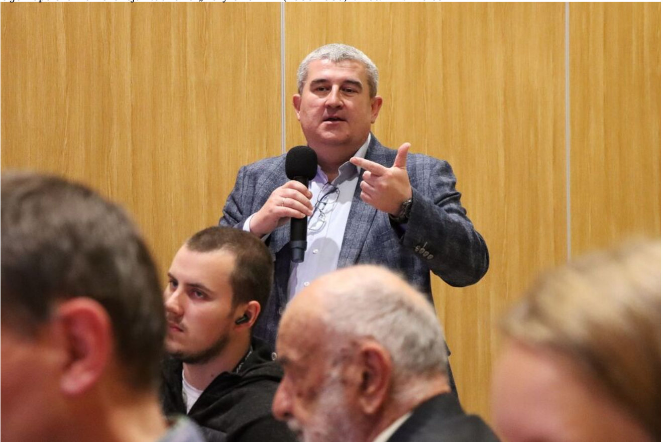
Ogólnopolska Konferencja Naukowa „Peryferie PRL (1956-1980)”.