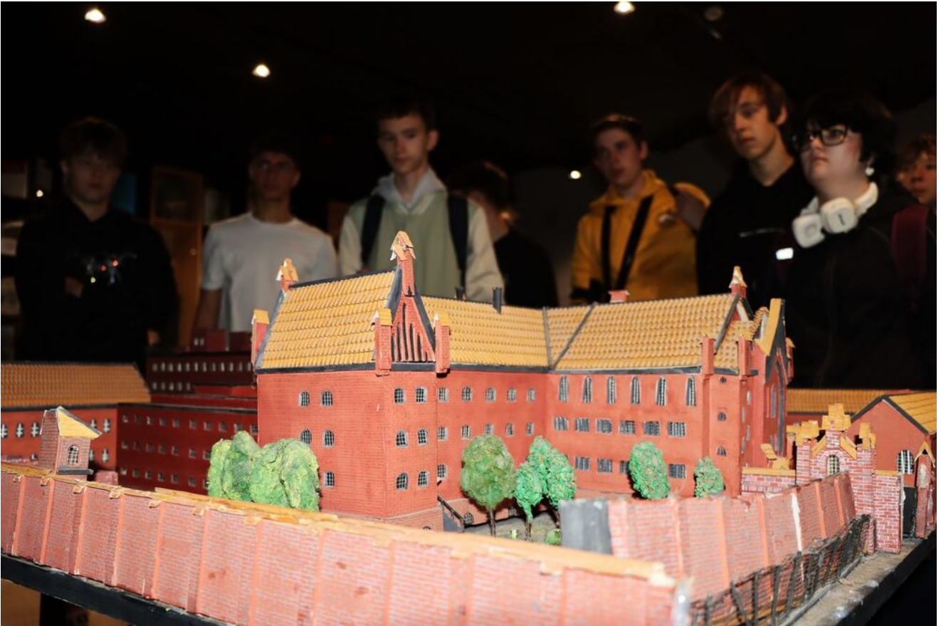
Wycieczka edukacyjna uczniów z Zespołu Szkół Przemysłu Spożywczego m. Danuty Siedzikówny „Inki” w Kielcach.