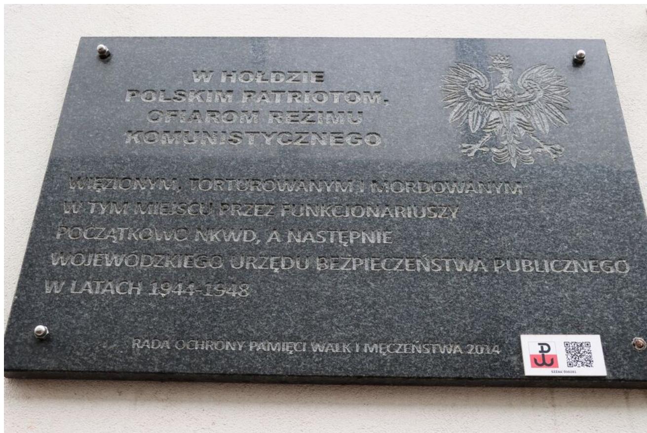
Wycieczka edukacyjna uczniów z Zespołu Szkół Przemysłu Spożywczego m. Danuty Siedzikówny „Inki” w Kielcach.