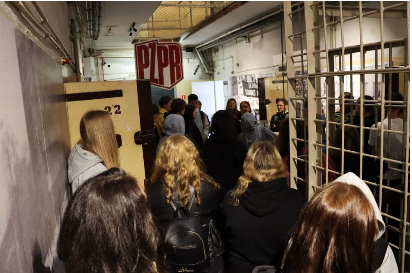
Wycieczka edukacyjna uczniów z Zespołu Szkół Przemysłu Spożywczego m. Danuty Siedzikówny „Inki” w Kielcach.