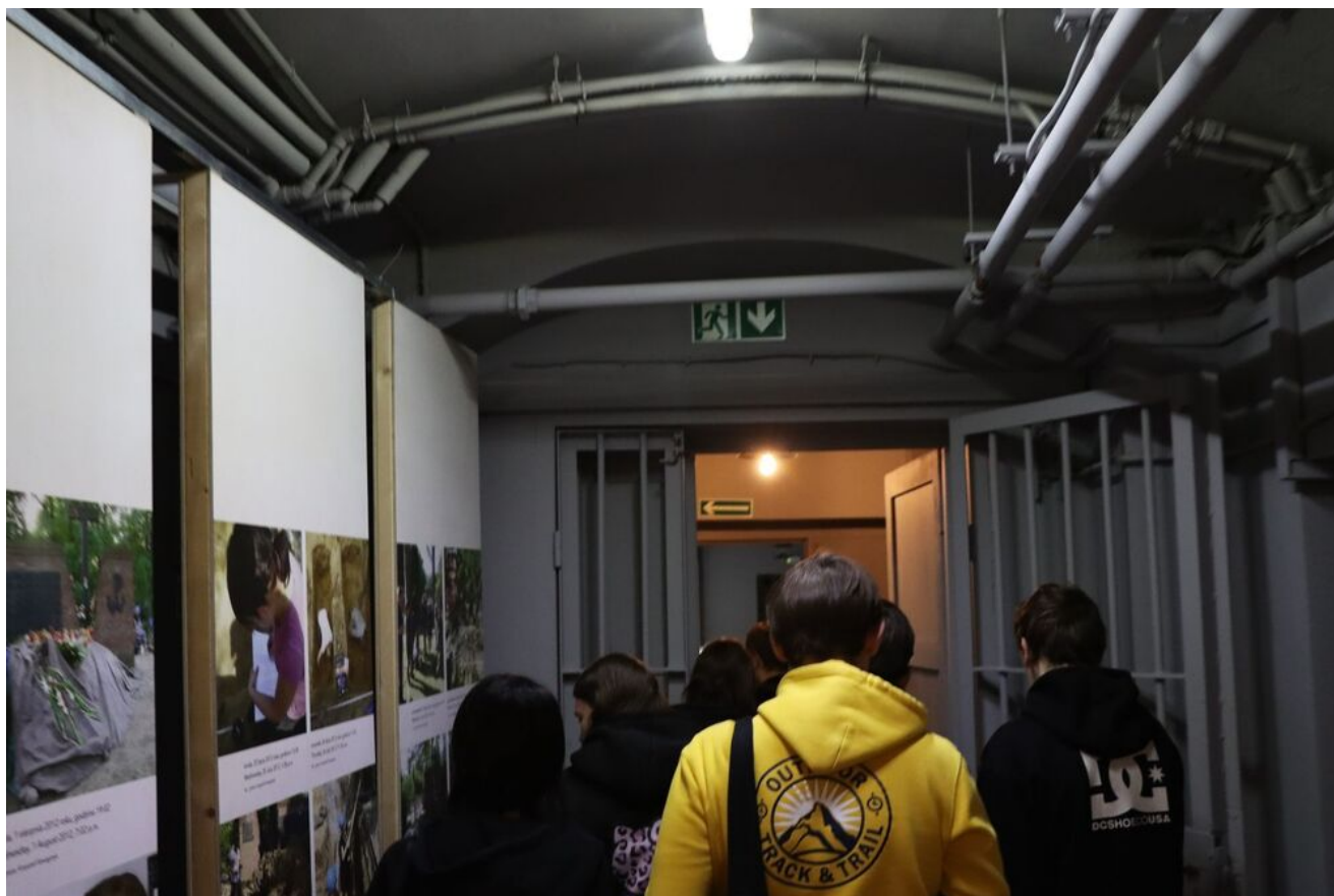
Wycieczka edukacyjna uczniów z Zespołu Szkół Przemysłu Spożywczego m. Danuty Siedzikówny „Inki” w Kielcach. Fot. IPN Kielce