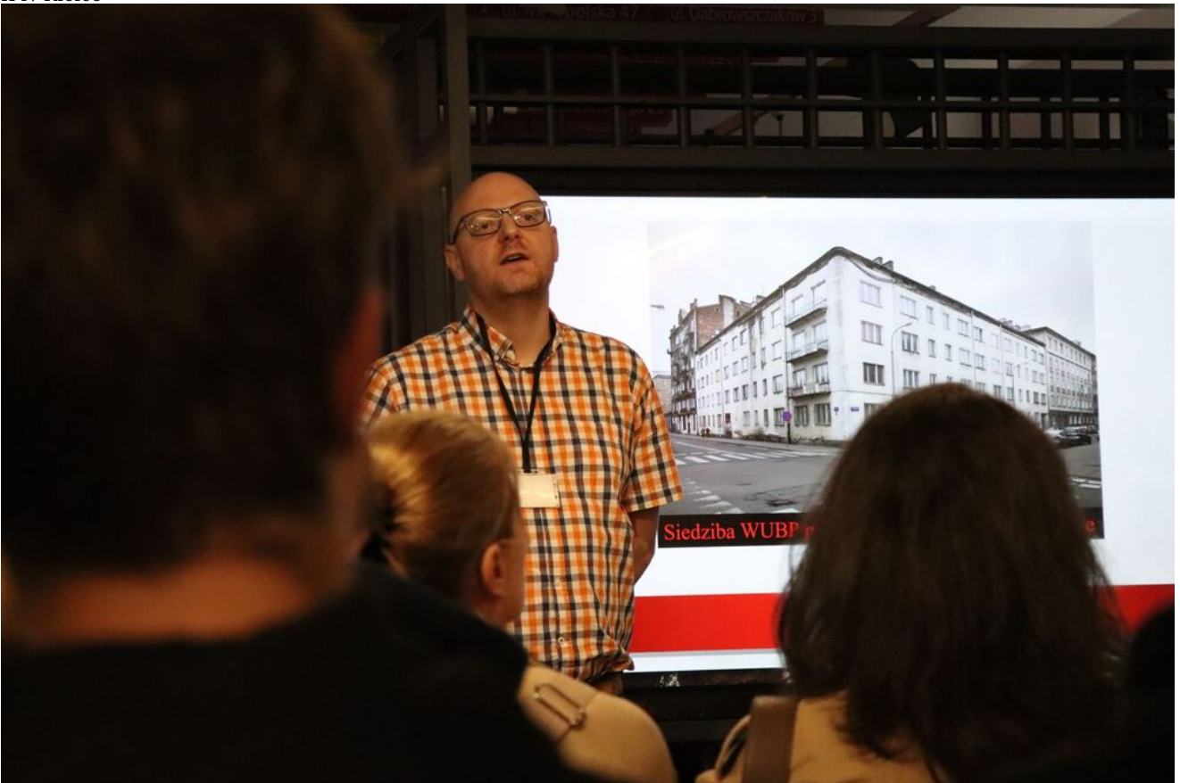
Wycieczka edukacyjna uczniów z Zespołu Szkół Przemysłu Spożywczego m. Danuty Siedzikówny „Inki” w Kielcach.