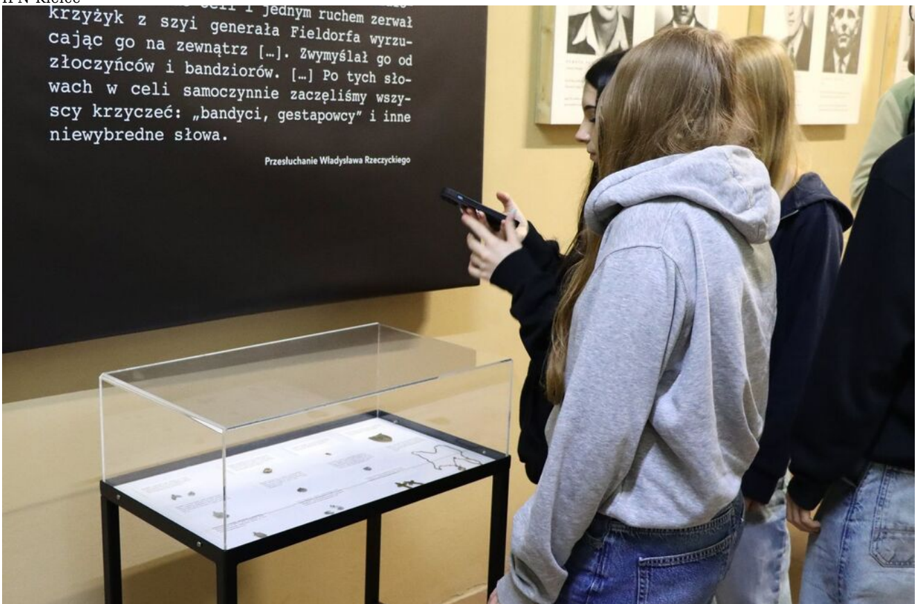
Wycieczka edukacyjna uczniów z Zespołu Szkół Przemysłu Spożywczego m. Danuty Siedzikówny „Inki” w Kielcach.