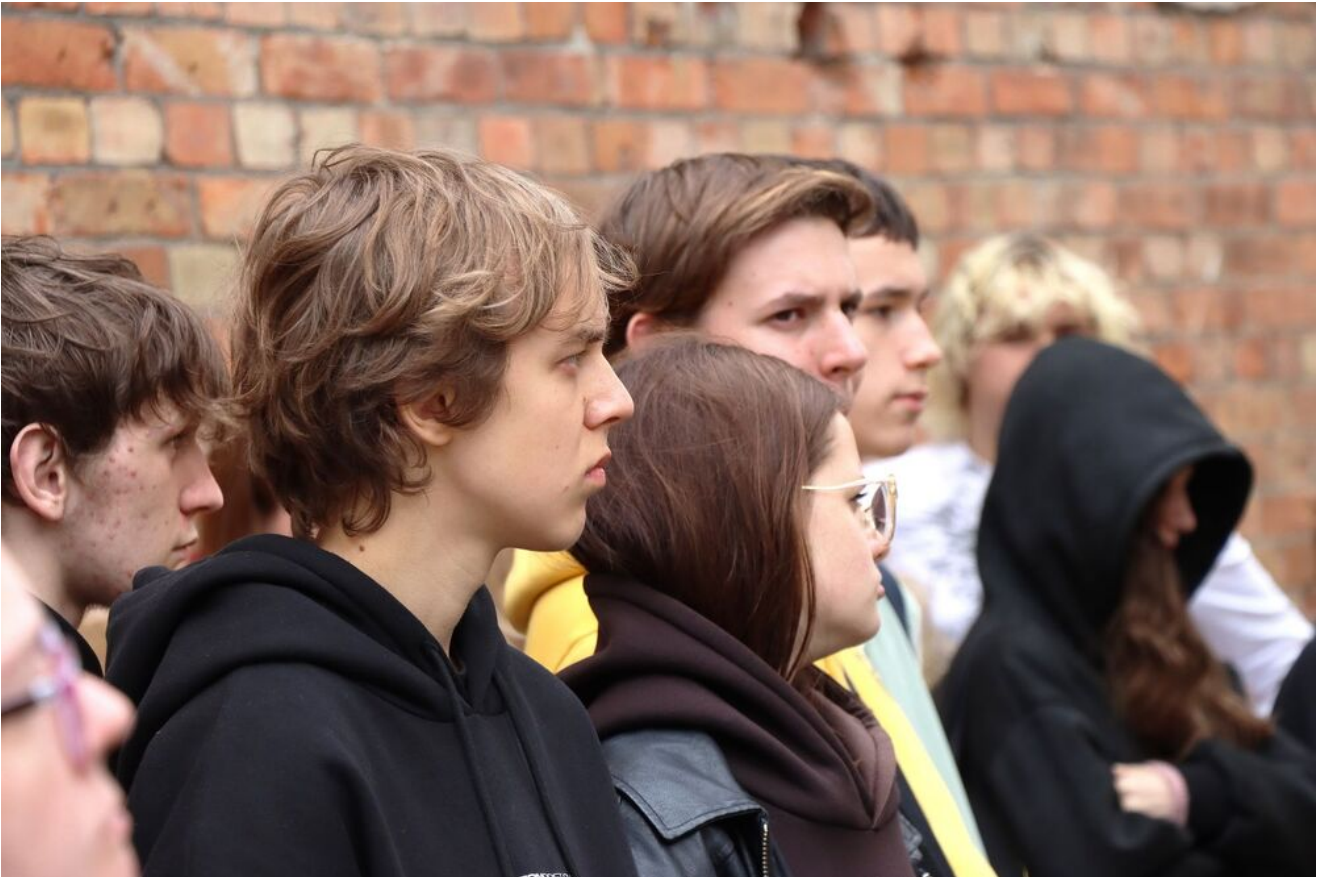
Wycieczka edukacyjna uczniów z Zespołu Szkół Przemysłu Spożywczego m. Danuty Siedzikówny „Inki” w Kielcach. Fot. IPN Kielce