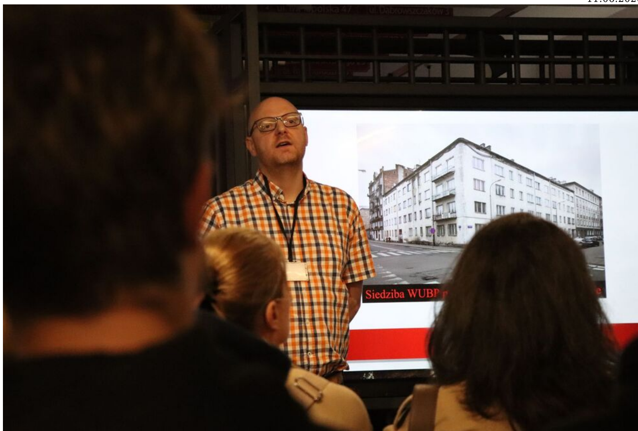
Wycieczka edukacyjna uczniów z Zespołu Szkół Przemysłu Spożywczego m. Danuty Siedzikówny „Inki” w Kielcach.