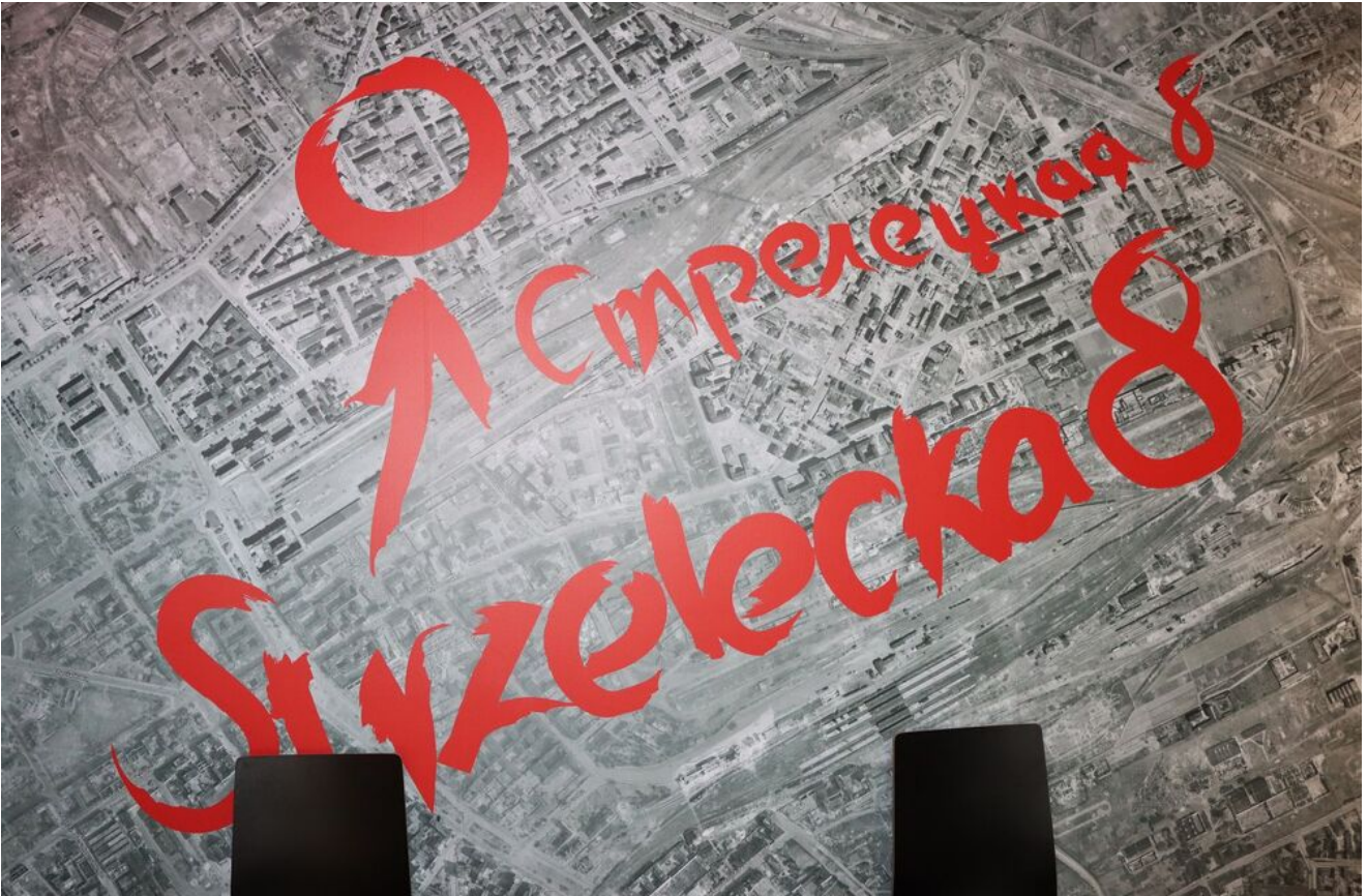
Wycieczka edukacyjna uczniów z Zespołu Szkół Przemysłu Spożywczego m. Danuty Siedzikówny „Inki” w Kielcach.