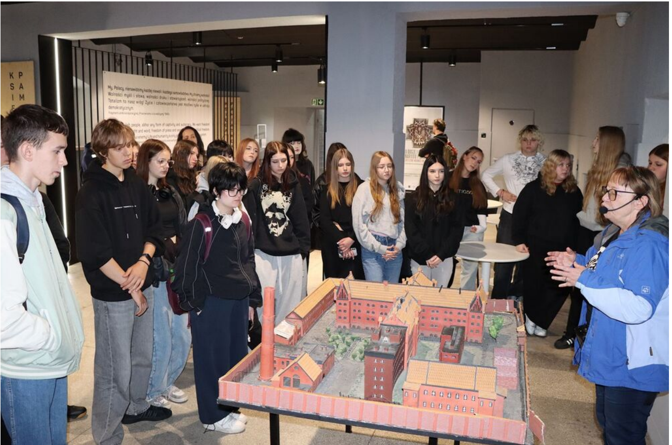
Wycieczka edukacyjna uczniów z Zespołu Szkół Przemysłu Spożywczego m. Danuty Siedzikówny „Inki” w Kielcach.