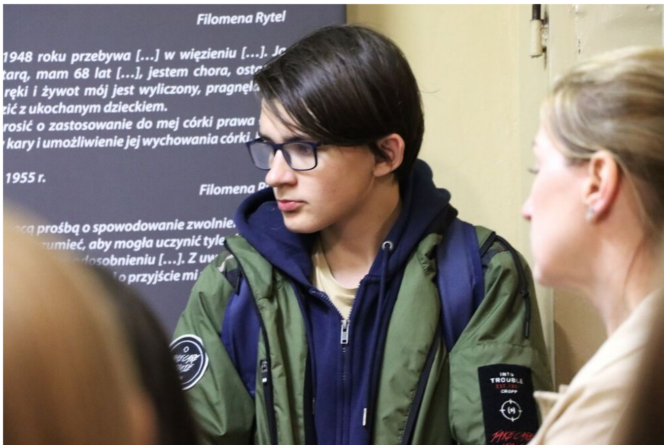
Wycieczka edukacyjna uczniów z Zespołu Szkół Przemysłu Spożywczego m. Danuty Siedzikówny „Inki” w Kielcach.