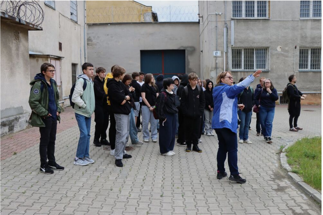
Wycieczka edukacyjna uczniów z Zespołu Szkół Przemysłu Spożywczego m. Danuty Siedzikówny „Inki” w Kielcach. Fot. IPN Kielce