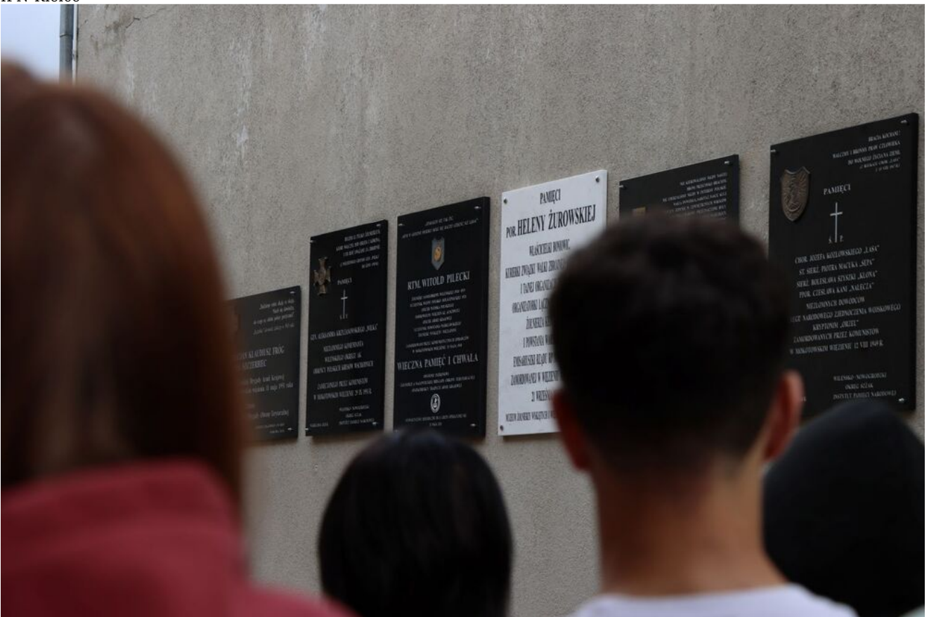
Wycieczka edukacyjna uczniów z Zespołu Szkół Przemysłu Spożywczego m. Danuty Siedzikówny „Inki” w Kielcach.