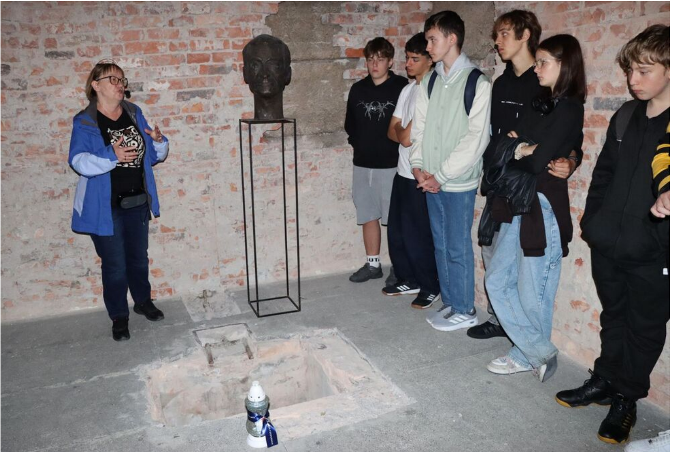
Wycieczka edukacyjna uczniów z Zespołu Szkół Przemysłu Spożywczego m. Danuty Siedzikówny „Inki” w Kielcach.