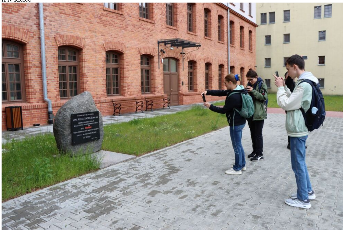
Wycieczka edukacyjna uczniów z Zespołu Szkół Przemysłu Spożywczego m. Danuty Siedzikówny „Inki” w Kielcach.

Wizyta w Warszawie była jednym z elementów projektu edukacyjnego „Klasa patronacka IPN”, realizowanego przez Delegaturę IPN w Kielcach z Zespołem Szkół Przemysłu Spożywczego w Kielcach.