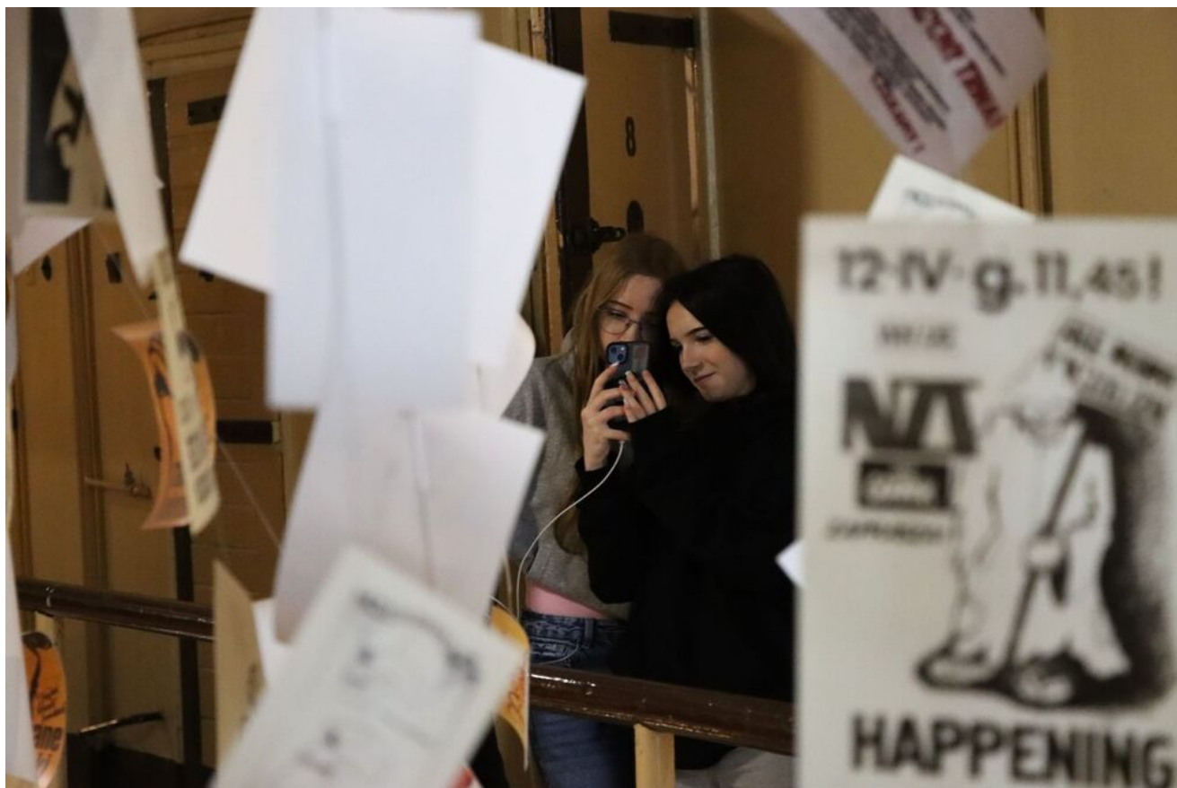
Wycieczka edukacyjna uczniów z Zespołu Szkół Przemysłu Spożywczego m. Danuty Siedzikówny „Inki” w Kielcach.