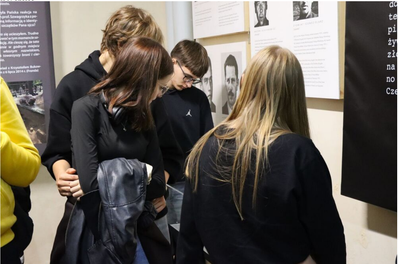
Wycieczka edukacyjna uczniów z Zespołu Szkół Przemysłu Spożywczego m. Danuty Siedzikówny „Inki” w Kielcach.