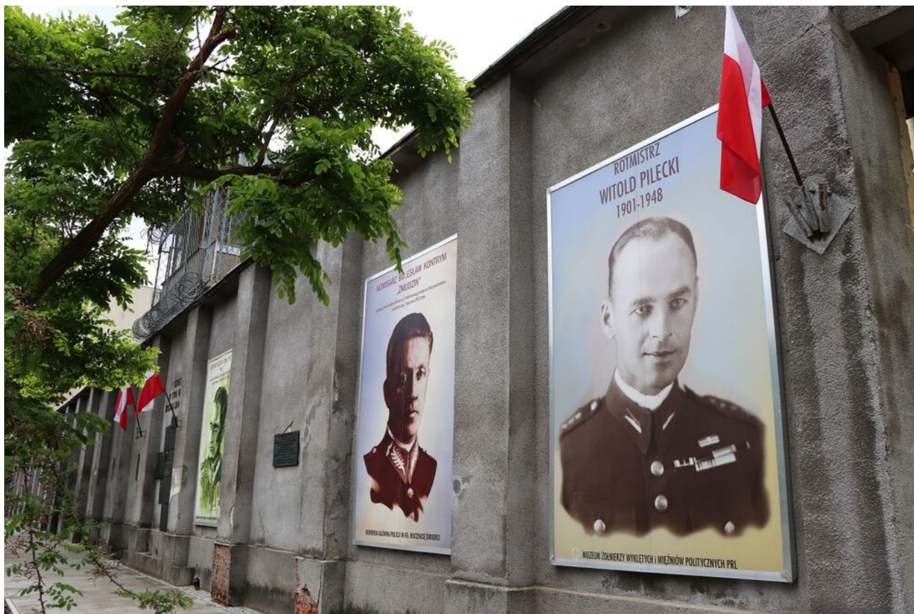
Wycieczka edukacyjna uczniów z Zespołu Szkół Przemysłu Spożywczego m. Danuty Siedzikówny „Inki” w Kielcach.