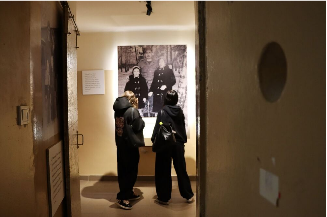
Wycieczka edukacyjna uczniów z Zespołu Szkół Przemysłu Spożywczego m. Danuty Siedzikówny „Inki” w Kielcach.